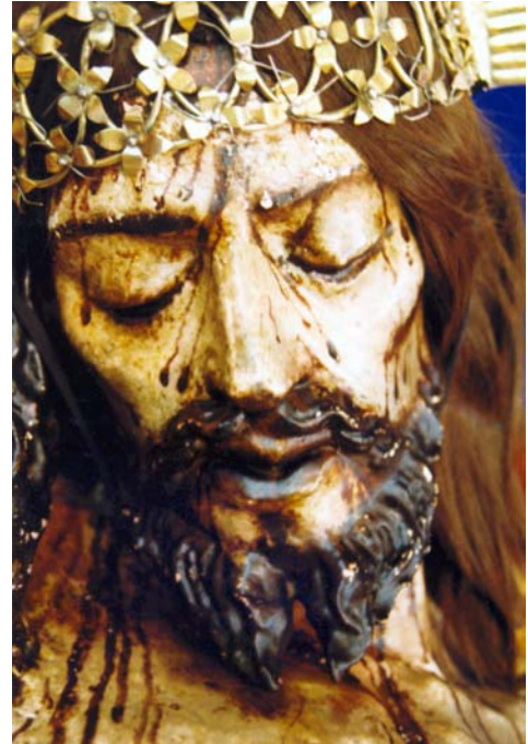
Señor de Ayuxi

La razón principal por la que parte de la población, (entre la que se encontraban los más viejos) se negó a que se restaurara, ya que el Señor de Ayuxi era quien decidía la suerte de cada persona de Yanhuitlán y él tenía el poder y la voluntad para decidir si se deterioraba, se conservaba o restauraba y actuaría en consecuencia en el momento que le pareciera oportuno. Durante siglos había estado con ellos y había decidido la suerte de Yanhuitlán, ¿por qué ahora intentarían ellos decidir la suerte de su Señor?.