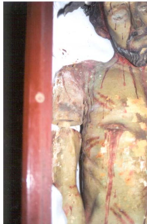
Cristo del Santo Entierro de Ziracuaretiro antes de intervención