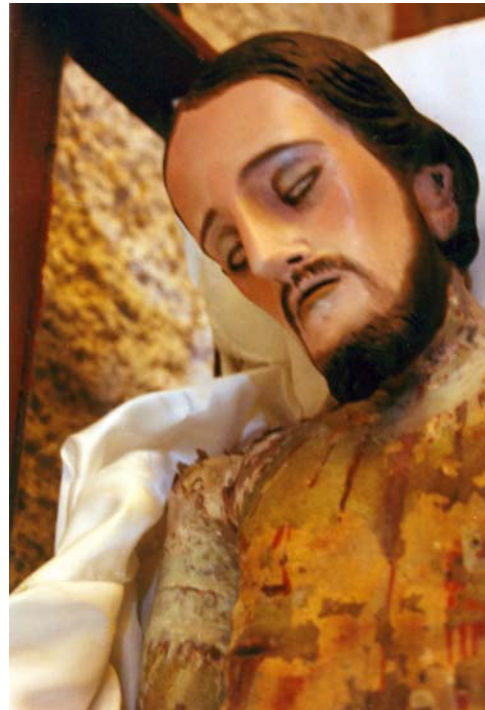
Pérdida de identidad en el Cristo por mala intervención

La importancia de que el trabajo sea realizado por un restaurador que cuente con estudios y una cédula profesional es básica, necesitamos hacer mayor difusión, para que la sociedad sea consciente de la importancia y el valor de su patrimonio, y lo que expone al ponerlo en manos de personas sin la preparación adecuada.