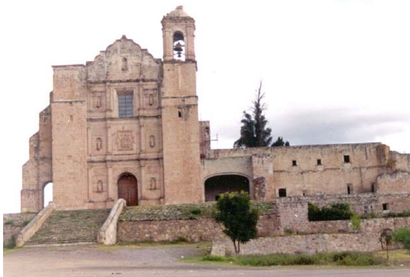
Convento de Santo Domingo Yanhuitán, Oaxaca

Dentro del vasto patrimonio que encontramos en Santo Domingo Yanhuitlán tenemos una importante colección de arcángeles, siendo esculturas de madera policromada que se encuentran albergadas en la sala del museo de sitio del Convento. Su atención se busca sea insertada en el marco del Proyecto de Conservación Integral de Santo Domingo Yanhuitlán, Oaxaca, el cual ha representado la construcción de una nueva alternativa para enfrentar el cada vez más grave problema de la protección y conservación del patrimonio cultural con que cuenta nuestro país.