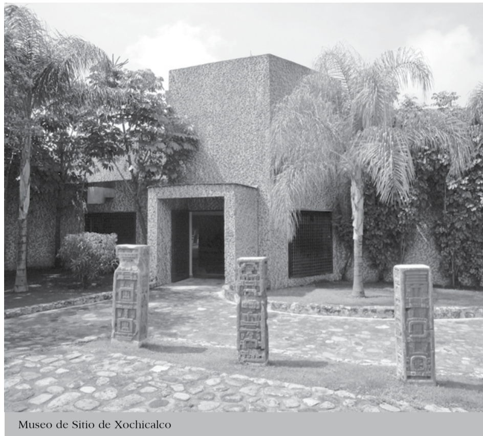
Museo de Sitio de Xochicalco

Oaxtepec, Ocuituco, Tepoztlán, Tlayacapan, Totolapan, Yecapixtla, Zacualpan de Amilpas, Hueyapan. El segundo, aprobado en 1999, es la Zona Arqueológica de Xochicalco .