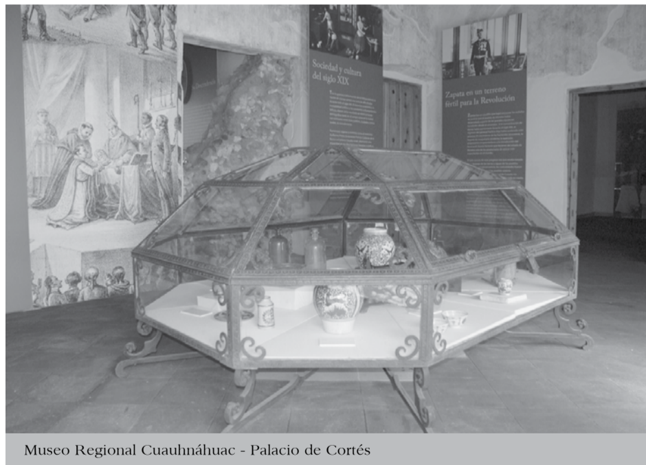
Museo Regional Cuauhnáhuac - Palacio de Cortés

• Hasta 2007 Morelos cuenta con dos bienes inscritos en la Lista de Patrimonio de la Humanidad de la UNESCO. Una aprobada en 1994, conocida como la ruta de los conventos o monasterios del siglo XVI en las faldas del volcán Popocatepetl, que comprende: Atlalahucan, Cuernavaca, Tetela del Volcán,