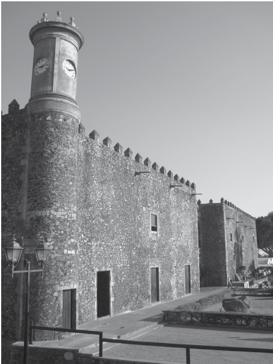
Museo Regional Cuauhnáhuac - Palacio de Cortés

Este domingo 18 de mayo el Museo Regional Cuauhnáhuac – Palacio de Cortés del Instituto Nacional de Antropología e Historia INAH, presenta la Mesa Redonda Los vínculos creados por las colecciones de los museos (tema de este año) para conmemorar el Día Internacional de los Museos en el marco del 75 aniversario del INAH y del 40 de creación de este museo regional.