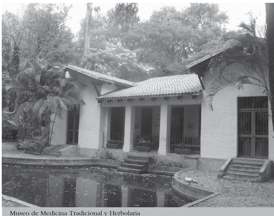
Museo de Medicina Tradicional y Herbolaria