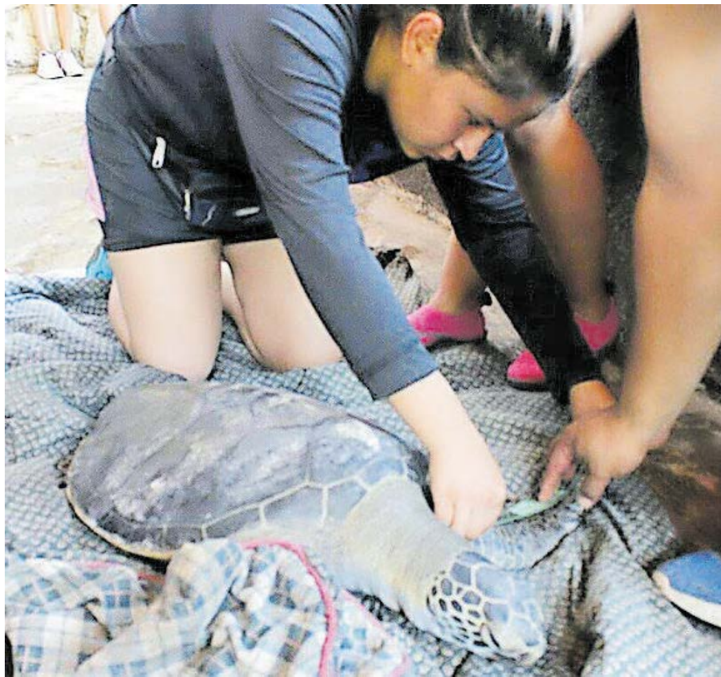
Evaluación a organismo juvenil de la especie Chelonia agassizzi .