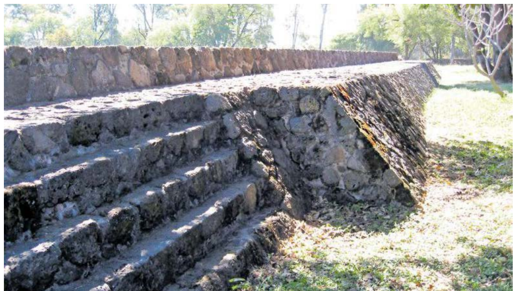
Edificio No. 10 visto desde lado oeste.

las paredes de los cuartos debieron tener aplanados y pinturas. En suma, toda esta edificación tuvo que tener una altura desde nivel de la plaza principal de un poco más de 3 metros.