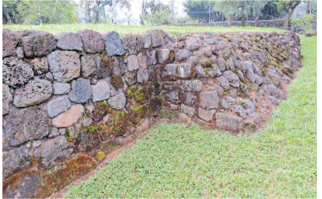
Edificio 15 visto desde lado oeste.