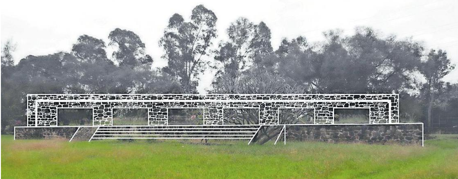
Esquema hipotético del edificio No.2 (palacio)

La mayoría de los edificios prehispánicos que están de pie en Teopanzolco proceden de la época cuando este territorio estaba bajo el dominio mexica.