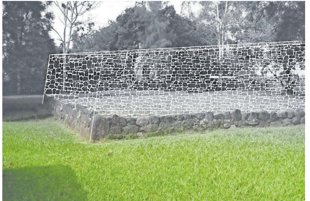
Esquema hipotético de la altura del edificio No. 15