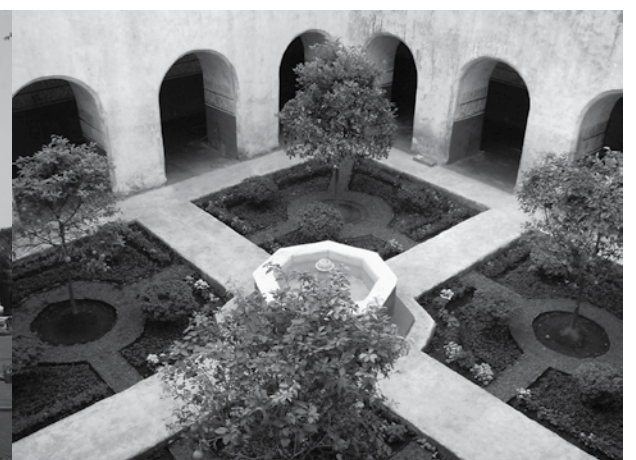
Museo y Exconvento de Tepoztlán