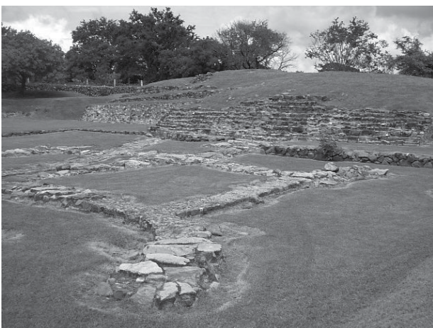
Zona Arqueológica de Las Pilas