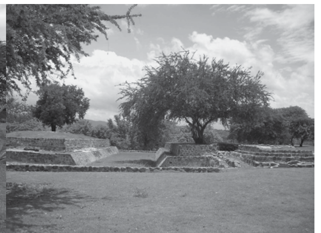
Zona Arqueológica de Coatetelco