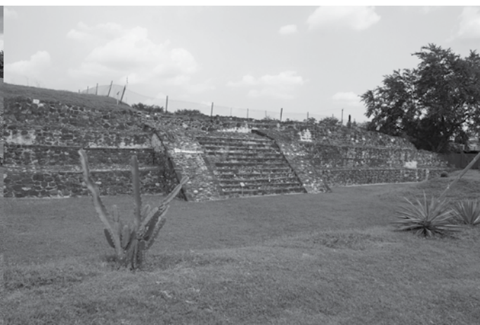
Zona Arqueológica de Yautepec