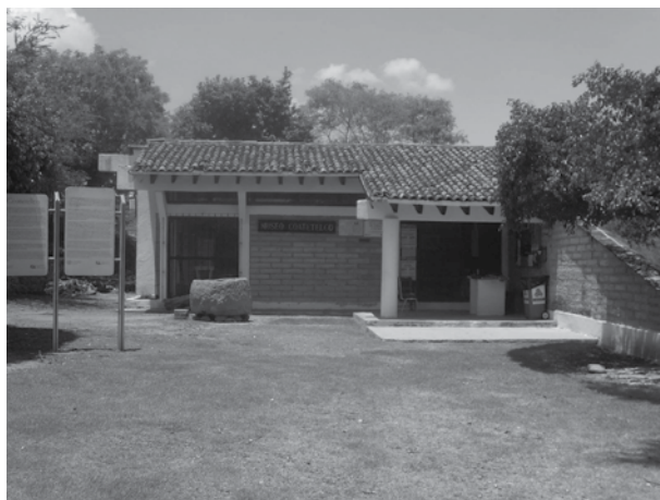
Museo de Sitio de Coatetelco