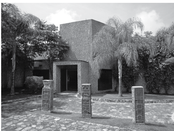
Museo de Sitio de Xochicalco