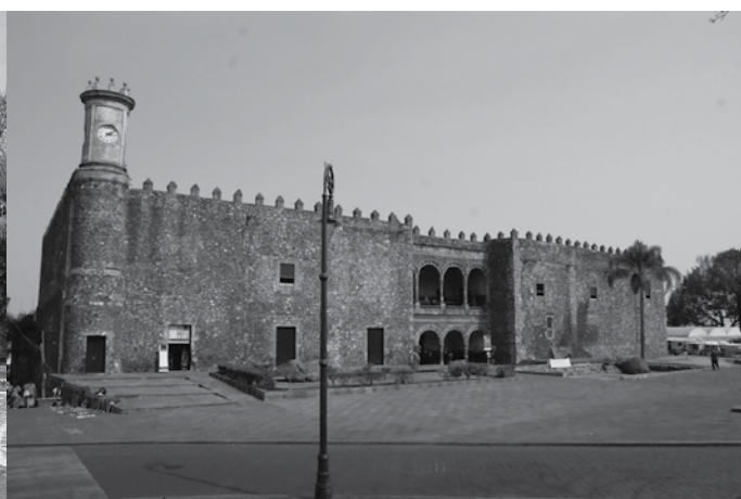
Museo Regional Cuauhnáhuac - Palacio de Cortés