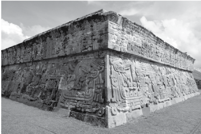
Zona Arqueológica de Xochicalco