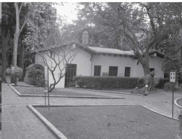
Museo de Medicina Tradinional y Herbolaria