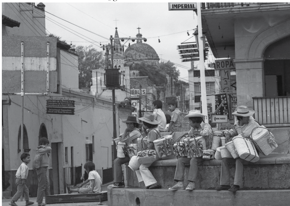
Vendedores de canastas en calle Hidalgo / Serie fotográfica: Cuernavaca ca. 1975 / Año: ca. 1975