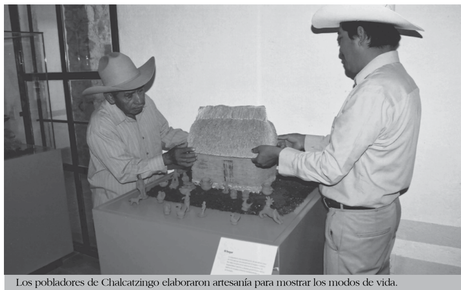
Los pobladores de Chalcatzingo elaboraron artesanía para mostrar los modos de vida.