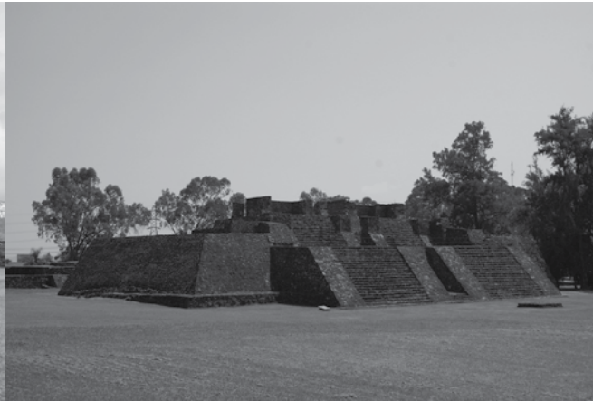
Zona Arqueológica de Teopanzolco