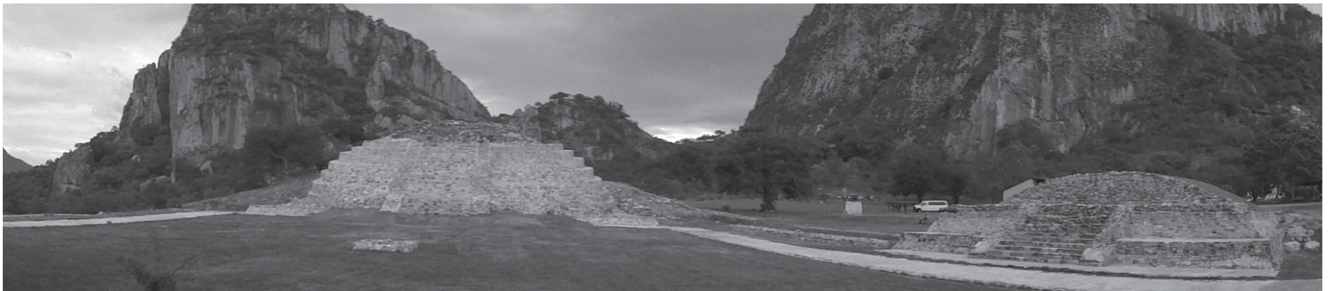
Zona Arqueológica de Chalcatzingo