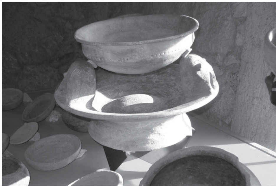
Una estufa, ejemplo de los utensilios en la vida cotidiana de Chalcatzingo.

Nalda, E. (2004). Patrimonio arqueológico. Problemas antiguos, soluciones nuevas. En L. Arizpe (Ed.), Los retos culturales en México (págs. 307-317). México: Porrúa/H. Cámara de Diputados LIX Legislatura/UNAM.