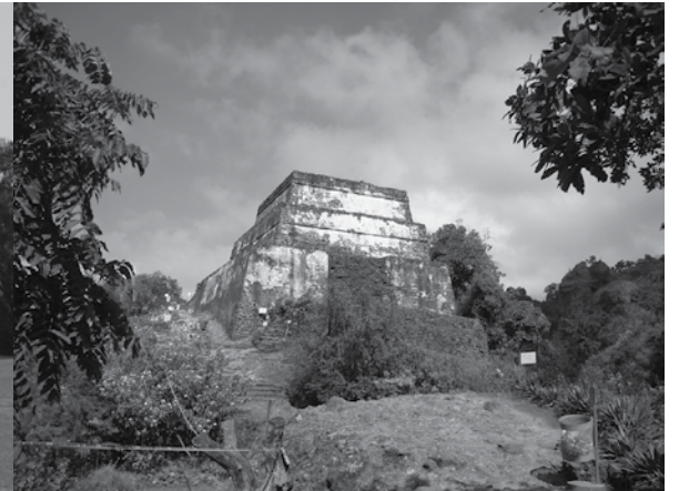
Zona Arqueológica del Tepozteco