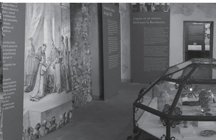
Museo Histórico del Oriente

Para conocer más acerca estos sitios y obtener información como costos y horarios lo invitamos a visitar la página de internet : www.morelos.inah.gob.mx