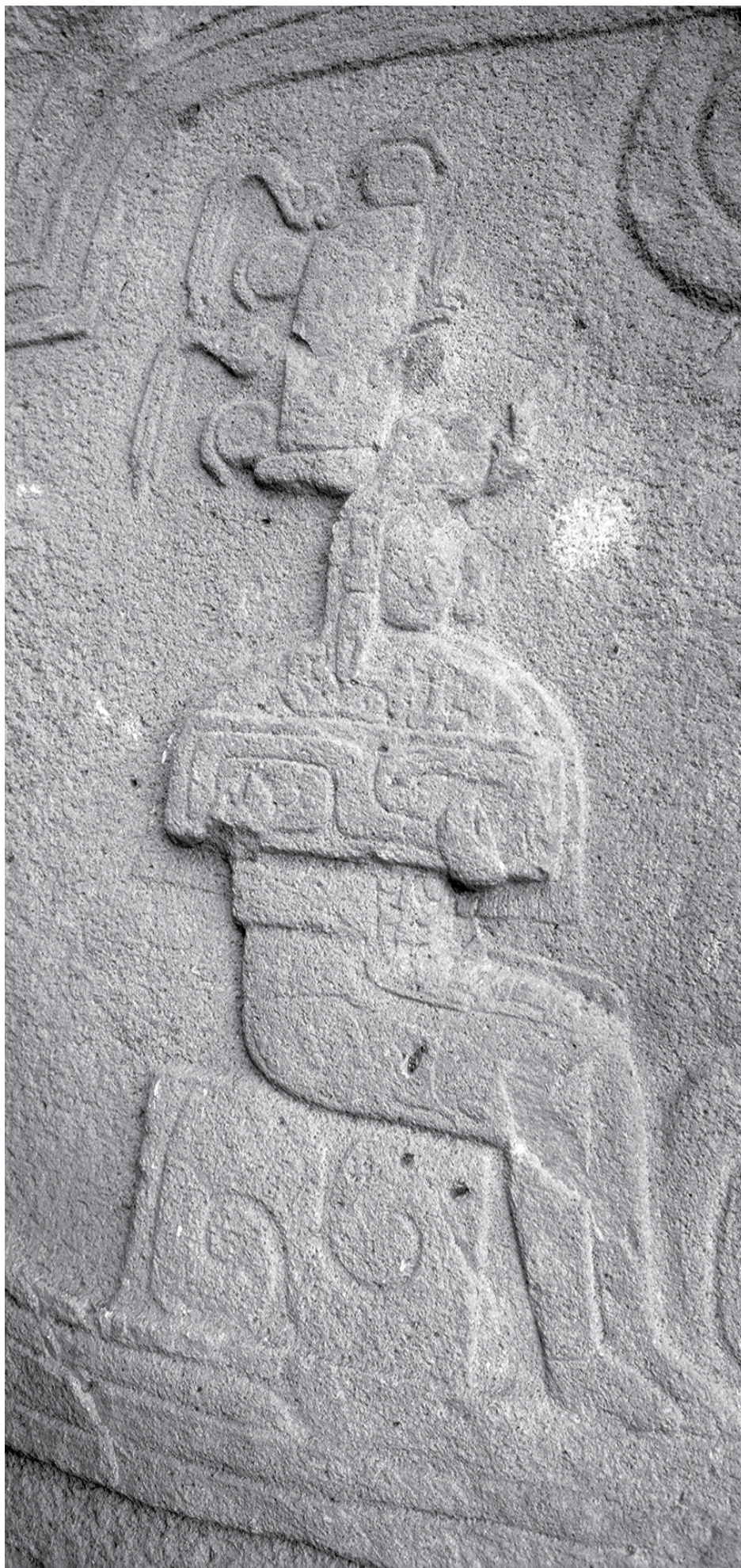
Relieve de Chalcatzingo, exquisito trabajo de desgaste

Los arqueólogos, al estudiar estos artefactos interpretan los modos de vida de las sociedades del México Antiguo, ya que es importante conocer los procesos de manufactura, los formas que eran utilizadas estas instrumentos y objetos en su vida útil. Finalmente como dice el dicho todo por servir se acaba, así que muchos de estos objetos terminará siendo desechado en algún momento. Conocer estos materiales dan un amplio panorama de que alcances y limitaciones tecnológicas tenían estos pueblos, y la manera en que se les presentaban problemas técnicos y como lograban solventarlos.