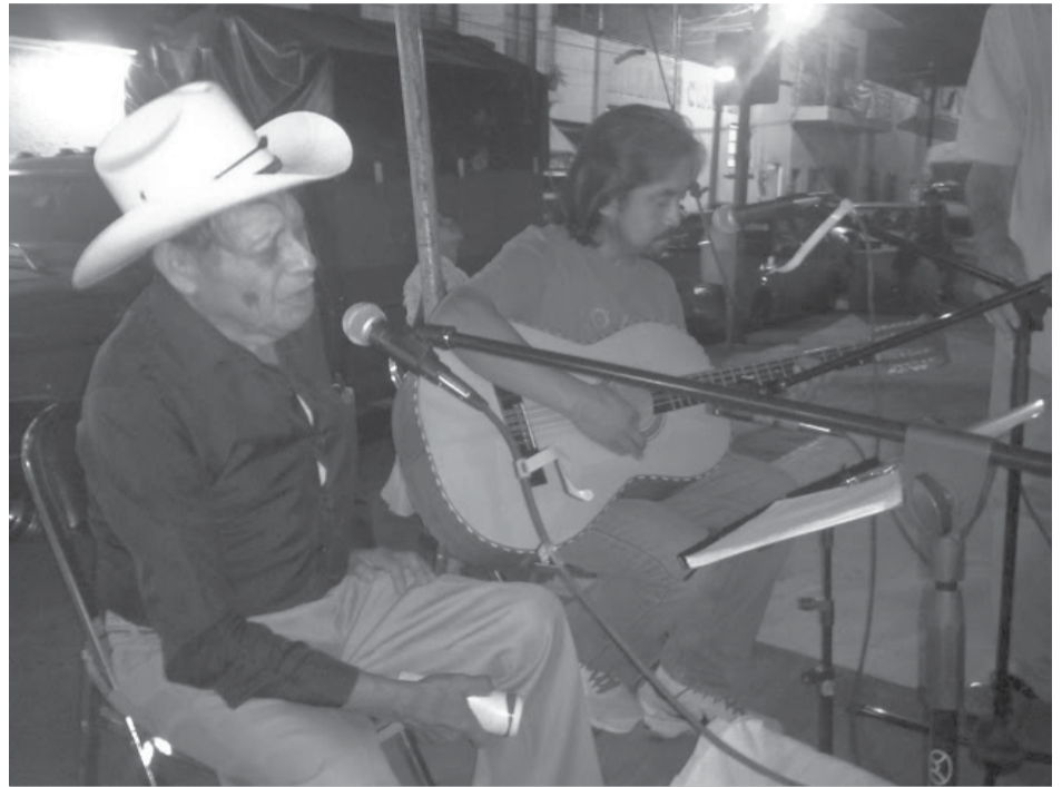
Corridistas de Cuautla

A lo largo de esta región se desarrollaban diversos ciclos de ferias, siendo las de Cuaresma las más importantes por la trascendencia que lograron al paso del tiempo. Estas ferias fueron el escenario natural del corrido suriano y de los corridistas que mostraban su destreza en la ejecución del bajo quinto, la interpretación de los corridos, ya sea llevando la primera voz o siendo segundero, que es como se le nombra a quien hace la segunda voz. Ser corridista implica saber respetar y aprender a de los maestros. Es asumir un fuerte sentimiento de compañerismo y solidaridad.