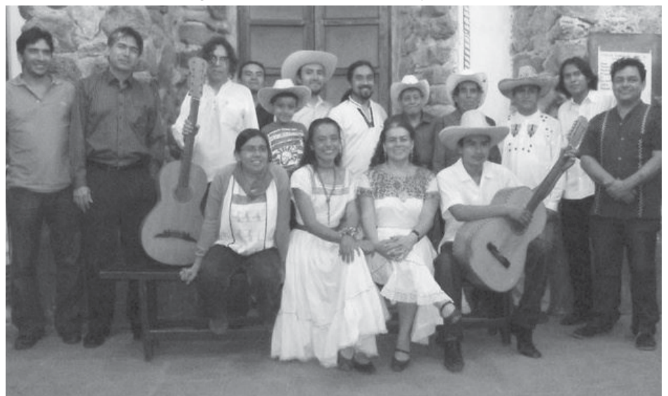
Reunión de Jiutepec