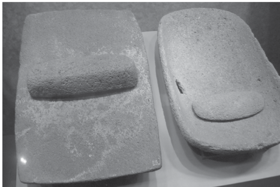
Metates, un ejemplo de la lítica en la vida cotidiana

del entorno, los antecesores del hombre se dieron cuenta que había rocas que se trabajaban con mayor facilidad, como por ejemplo el pedernal.