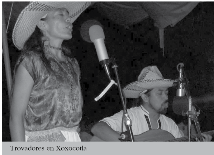
Trovadores en Xoxocotla