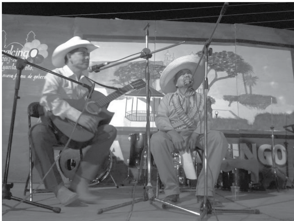
Corridistas de Tepalcingo

Pero cabe mencionar que estas relaciones no se circunscribieron a los límites de lo que hoy conocemos como el estado de Morelos, porque la lógica era distinta. Habían otros parámetros y referencias que fueron dándole sentido a lo que aún se conoce por las generaciones grandes como los pueblos surianos que se encontraban aproximadamente desde las faldas del Nevado de Toluca, siguiendo el Chichinautzin hasta los volcanes Iztaccihuatl y Popocatepetl. Por lo que podemos decir que abarcaba pueblos del estado de México, el sur del Distrito Federal, Morelos, parte de Puebla y Guerrero.