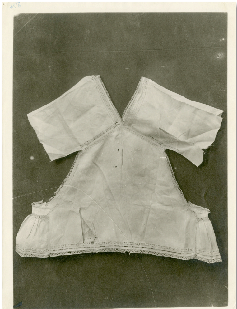
Sobrepelliz que perteneció a Mariano Matamoros y tiene sus iniciales bordadas en hilo blanco. Temporalidad de la reprografía 1930. Colección Culhuacán. Inventario 423523.