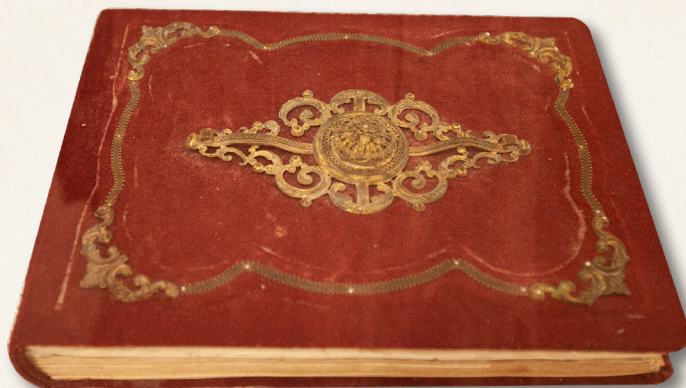
En el Museo "Mariano Matamoros" se encuentra el conocido libro rojo con anotaciones de "visitantes distinguidos" Anexamos solo algunos. Jantetelco Morelos, México. Diciembre de 2020.

«Cuernavaca, febrero 11 de 1974.» F. Leyva Gobernador de Morelos y miembro honorario de la «Sociedad Matamoros»