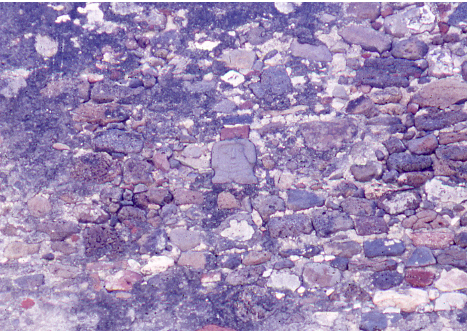
Templo y exconvento "La Asunción de María". Yauhtepec, Morelos. Junio de 1984. Fondo Rafael Gutierrez Yáñez. Fototeca "Juan Dubernard" Centro INAH Morelos.

C on la intromisión española en América, se dio un proceso hasta cierto punto violento de convertir a los habitantes originarios "paganos" al cristianismo, para ello construyeron templos sobre los principales centros ceremoniales, creando así una doble vivencia y convivencia con los elementos exógenos que se imponían, imaginemos que las prácticas ceremoniales y de rituales que tenían en la memoria colectiva prehispánica, trataban de ser suplantadas por las nuevas creencias religiosas, de este modo, se manifestó un sincretismo en la religión de los pueblos originarios.