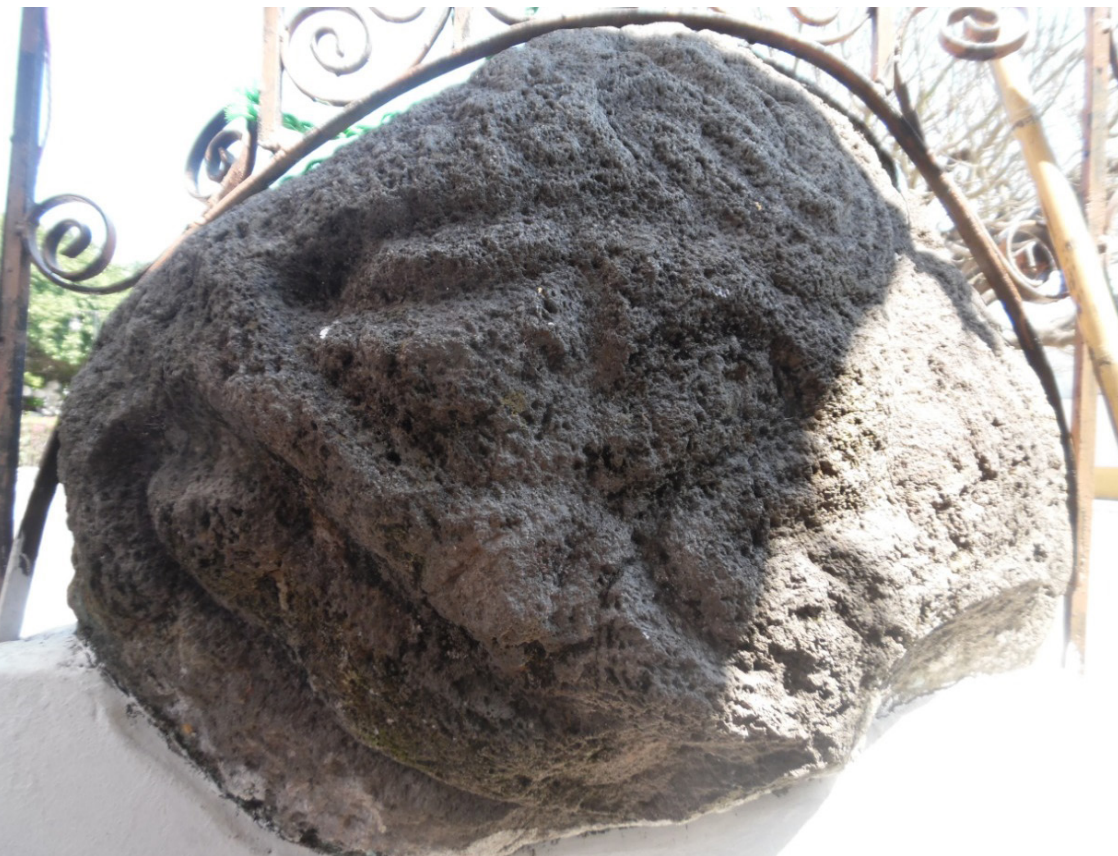
▲ Entrada principal de la parroquia, se puede apreciar las dos piedras en su parte posterior. Crédito: Pavel Leiva García.