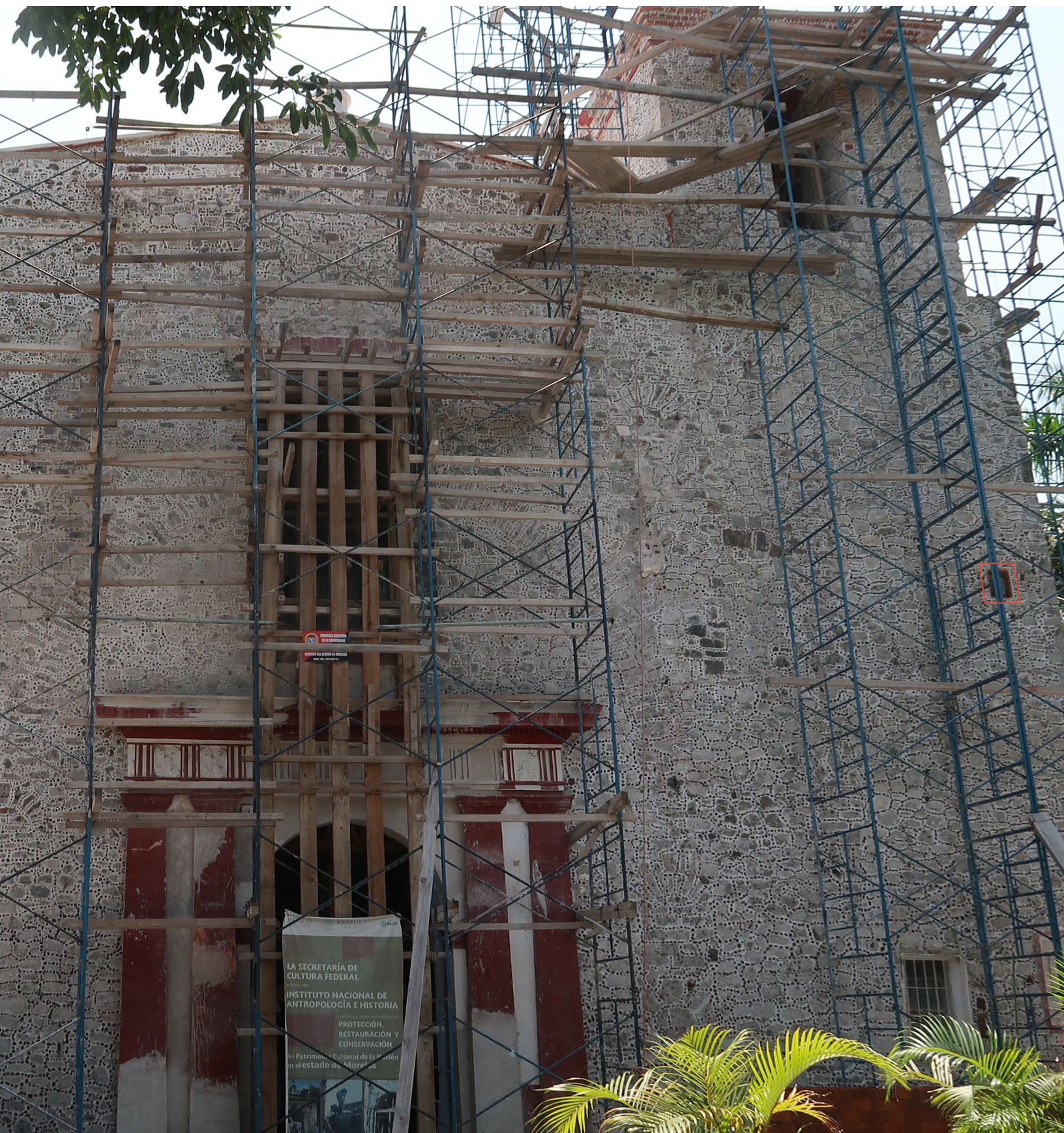
Obras de restauración del templo, después del sismo del 2017, cerca de la esquina suroeste del campanario se localizó la cabeza de la escultura. Programa de acciones emergentes.