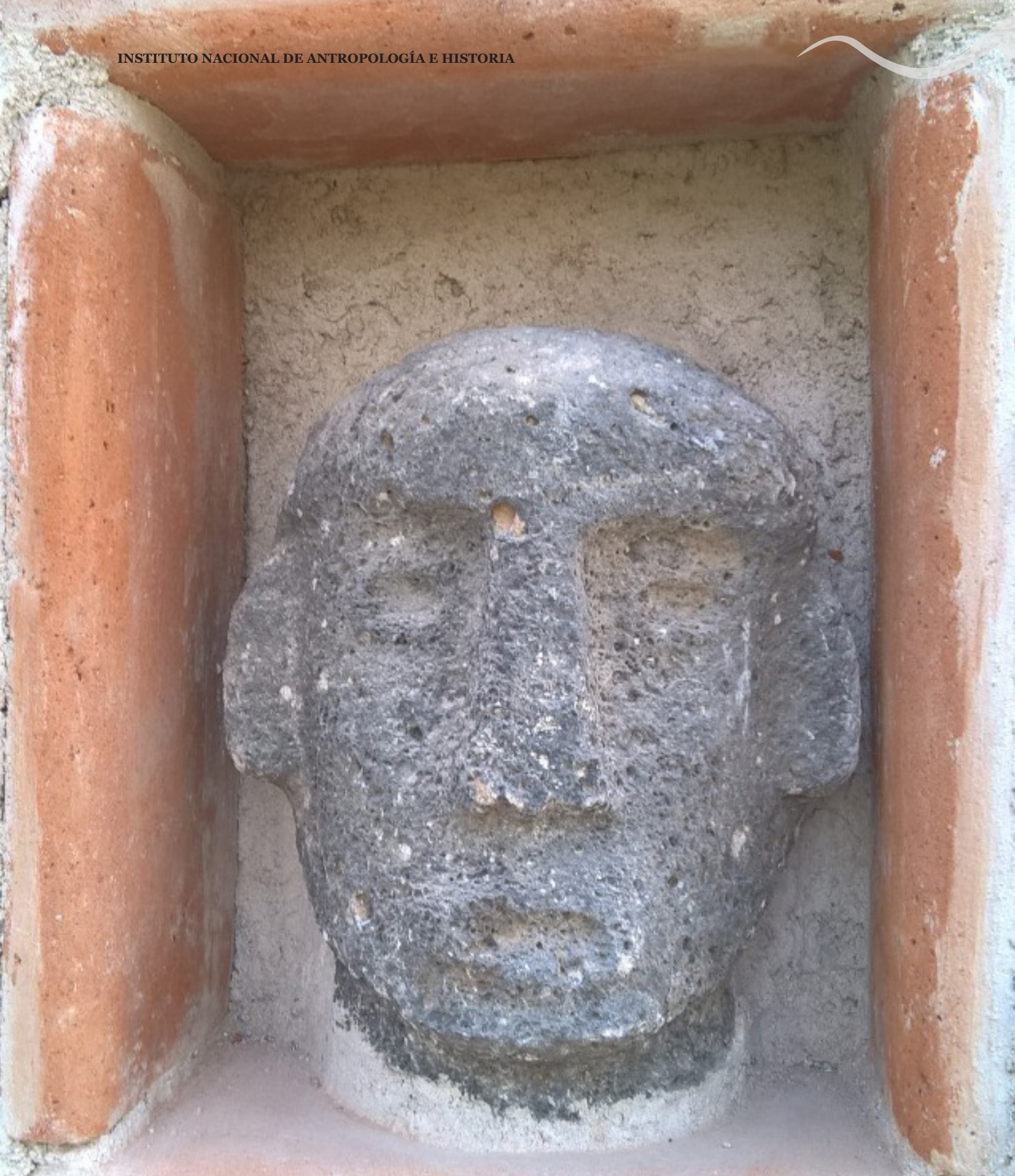
Detalle de la cabeza antropomorfa, en las obras de restauración le colocaron un marco de tabique rojo.