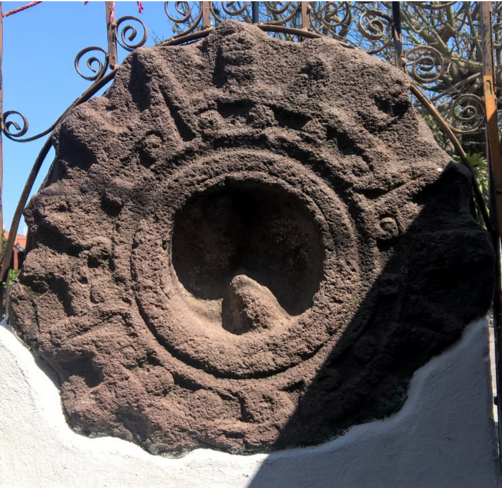
Piedra solar en Axochiapan.