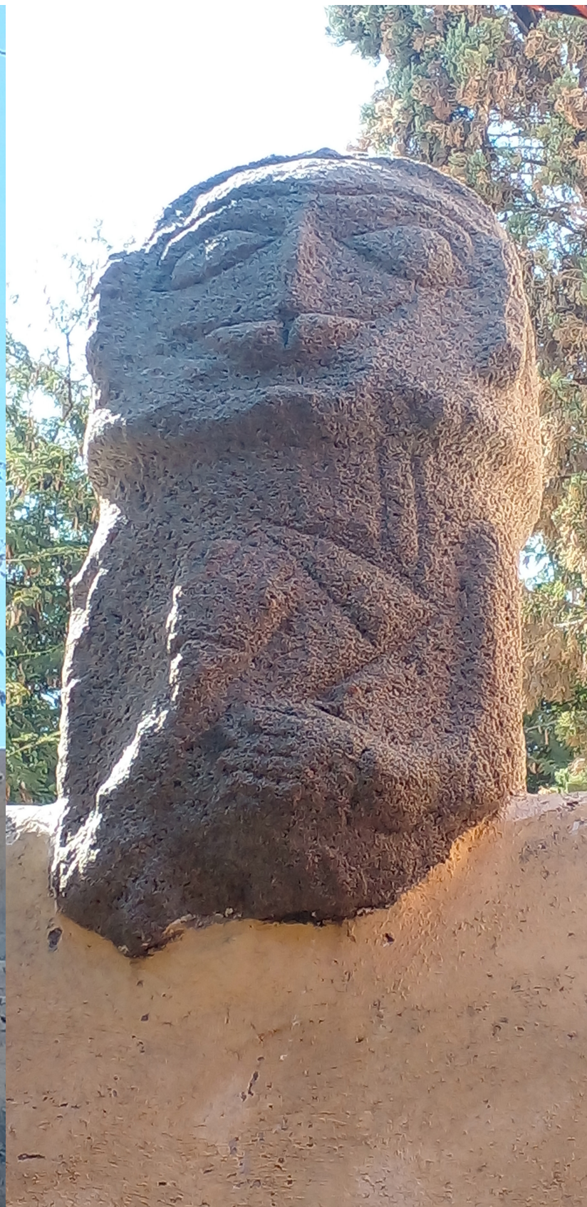
Escultura probablemente masculina, localizada en la barda perimetral del atrio, lado este. ▶