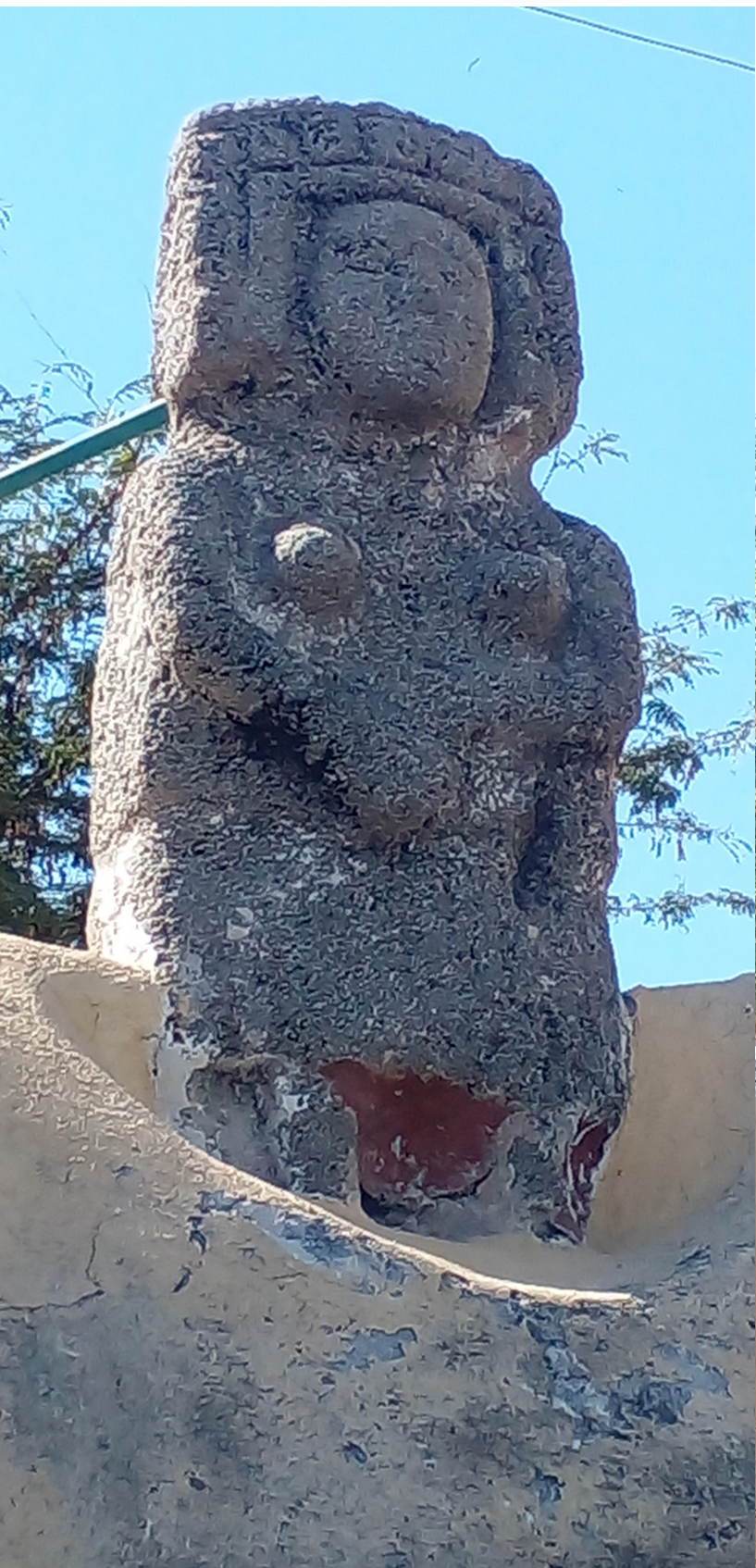
◀ Escultura antropomorfa femenina, localizada en la barda perimetral del atrio, puerta Este.