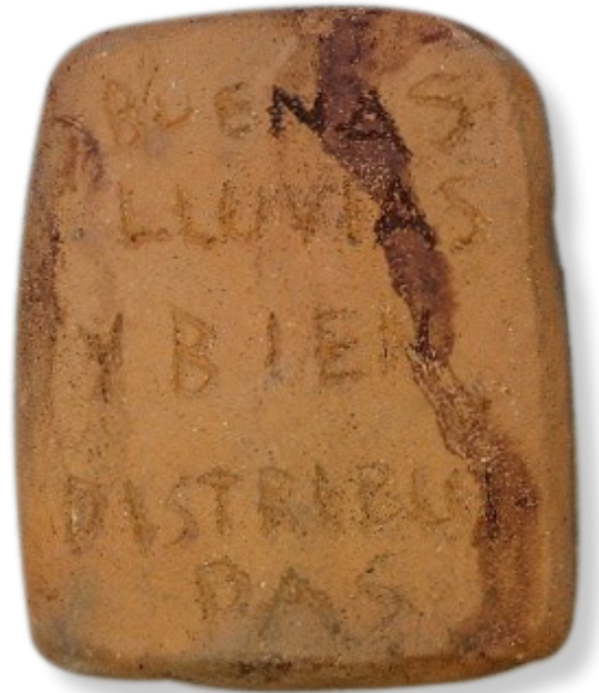
▲ Figurilla moderna con representación de Tláloc, en su parte posterior tiene un grabado que dice "Buenas lluvias y bien distribuidas", como parte de una ofrenda.