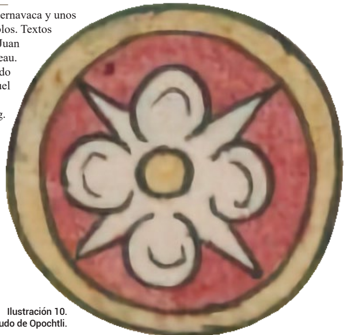
Ilustración 10. Detalle del escudo de Opochtli.