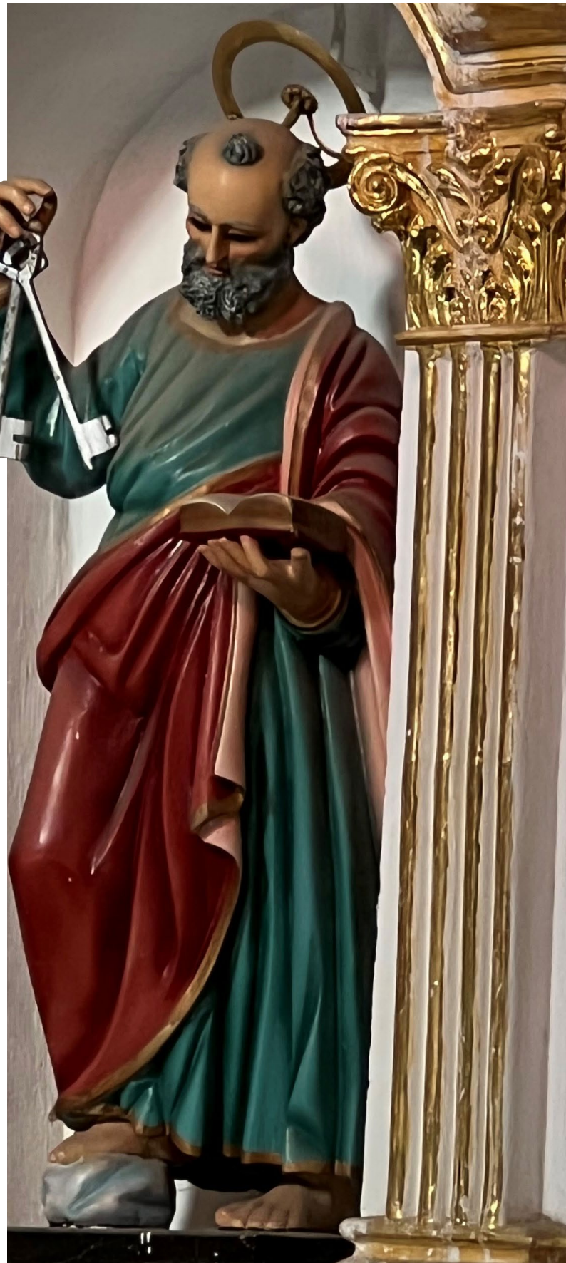
Ilustración 6. Imagen de San Pedro de Tehuixtla.