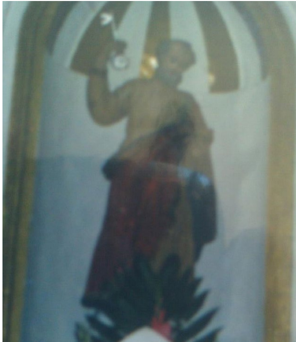
Ilustración 7. Imagen de San Pedro antes de la restauración.

La imagen se mandó repintar bajo el argumento de "estar ya muy viejo", los ancianos y algunas personas se opusieron a su restauración y suplicaron que la intervención fuera supervisada por el INAH, lo cual no fue así. En ese año se compró una imagen de San Pedro de fibra de vidrio para peregrinarla, dejando desde entonces al patrono en su nicho; incluso después del sismo de 2017 la escultura del patrono permaneció ahí, mientras el templo se cerró para su restauración. Por el sismo se cayeron algunas imágenes resultando mutiladas, la del patrono no se movió un milímetro.