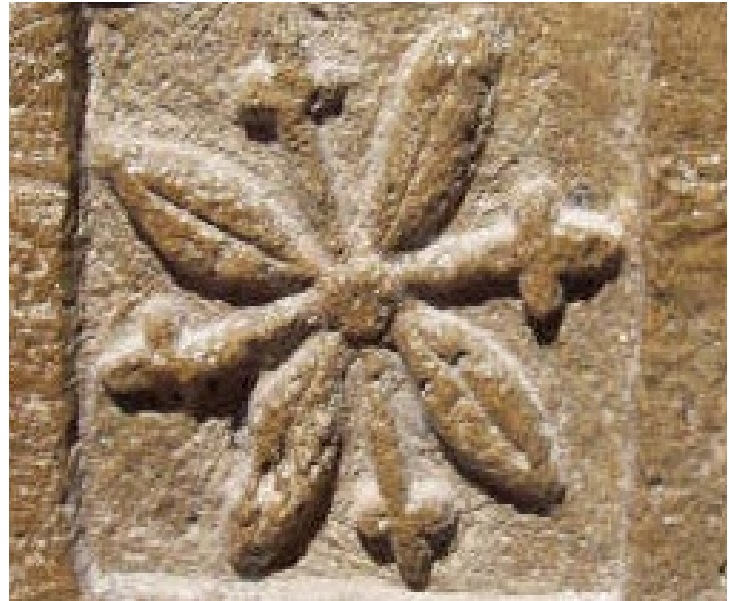
Ilustración 9. Flor tallada en el pedestal de las jambas del arco de la puerta mayor.

En la versión castellana de la Relación de Cuernavaca del año 1743 cita: