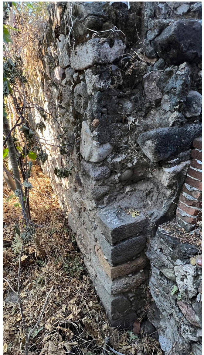
Ilustración 2. Restos de la jamba de la Capilla del Calvario, se notan los sillares prehispánicos utilizados en su construcción.