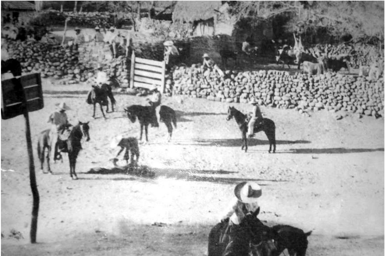
Ilustración 1. Foto de principios del siglo XX, posterior a 1910, de la Capilla del Calvario, el atrio fue utilizado como corral de toros.

Los documentos coloniales de los que venimos hablando se encuentran en el AGN 5 y son una escritura donde el marqués del Valle Don Pedro Cortés 6 otorgó posesión de las tierras de Tehuixtla al maestro Fray Juan Diez, guerrero del hábito de Calatrava, por medio de Diego Gómez Ortiz, el 7 de diciembre de 1616.