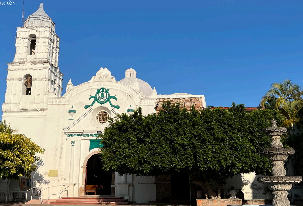
Ilustración 4. La Capilla de San Pedro Tehuixtla en la actualidad.

16. AGN/ Instituciones Coloniales/ Indiferente Virreinal/ Cajas 2000-2999/ Caja 2329/ Título: Expediente 005 (Bienes Nacionales Caja 2329) Fecha(s): 1789 Volumen y soporte: 6 Fojas Productores: Juez Provisor y Vicario General del Arzobispado de México.