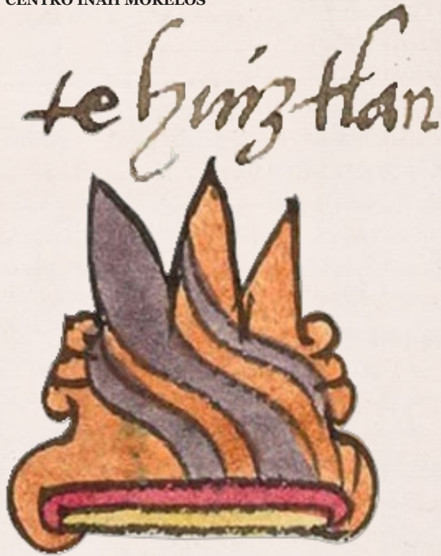
Ilustración 5. Posible topónimo de Tehuixtla.

En el libro de Gonzalo Aguirre Beltrán, Zongolica: encuentro de Dioses y Santos Patronos , se advierte que a un pueblo principal se le da el nombre de un santo principal.