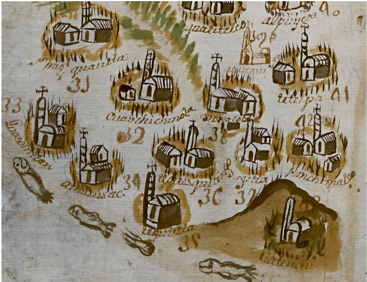
Ilustración 11. Detalle del Mapa de Cuernavaca de 1743.

La ilustración 11 es un detalle del Mapa de Cuernavaca 29 del año 1743 donde apreciamos la iglesia de Tehuixtla, el río y los peces a los que hace referencia el citado texto. Según los documentos que hemos localizado, la pesca en esta localidad fue una actividad común y característica desde siglo XVI al XVIII y podemos afirmar que hasta mediado de 1970 bastantes familias se abastecían, no sólo de bagre, si no de algunas almejas, cangrejos y otros productos del río, pero fueron evitando poco a poco su consumo por la contaminación de sus aguas. Hasta el día de hoy hay quienes consumen bagre, mojarra y langostinos, pero estos productos escasean ya que hay una gran plaga de pez diablo o limpiavidrios.