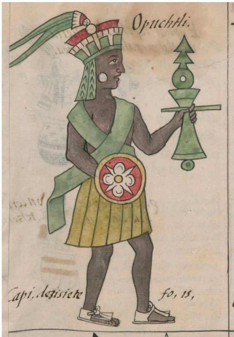
Ilustración 8. Opochtli, representación del Códice Florentino.

Los indígenas de Tehuixtla fueron obligados a cumplir con el servicio de minas en Taxco, así como a realizar servicios, forzados por sus autoridades locales, para complacer a otras de mayor jerarquía, por ejemplo, a darle pescado al alcalde mayor de Cuernavaca o atender las solicitudes del de Tlaquiltenango.