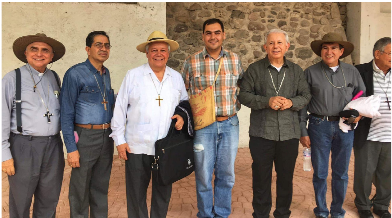
Ilustración 3. Teocalli del señorío tlahuica de Tehuixtla. Aparece el autor con un grupo de sacerdotes.