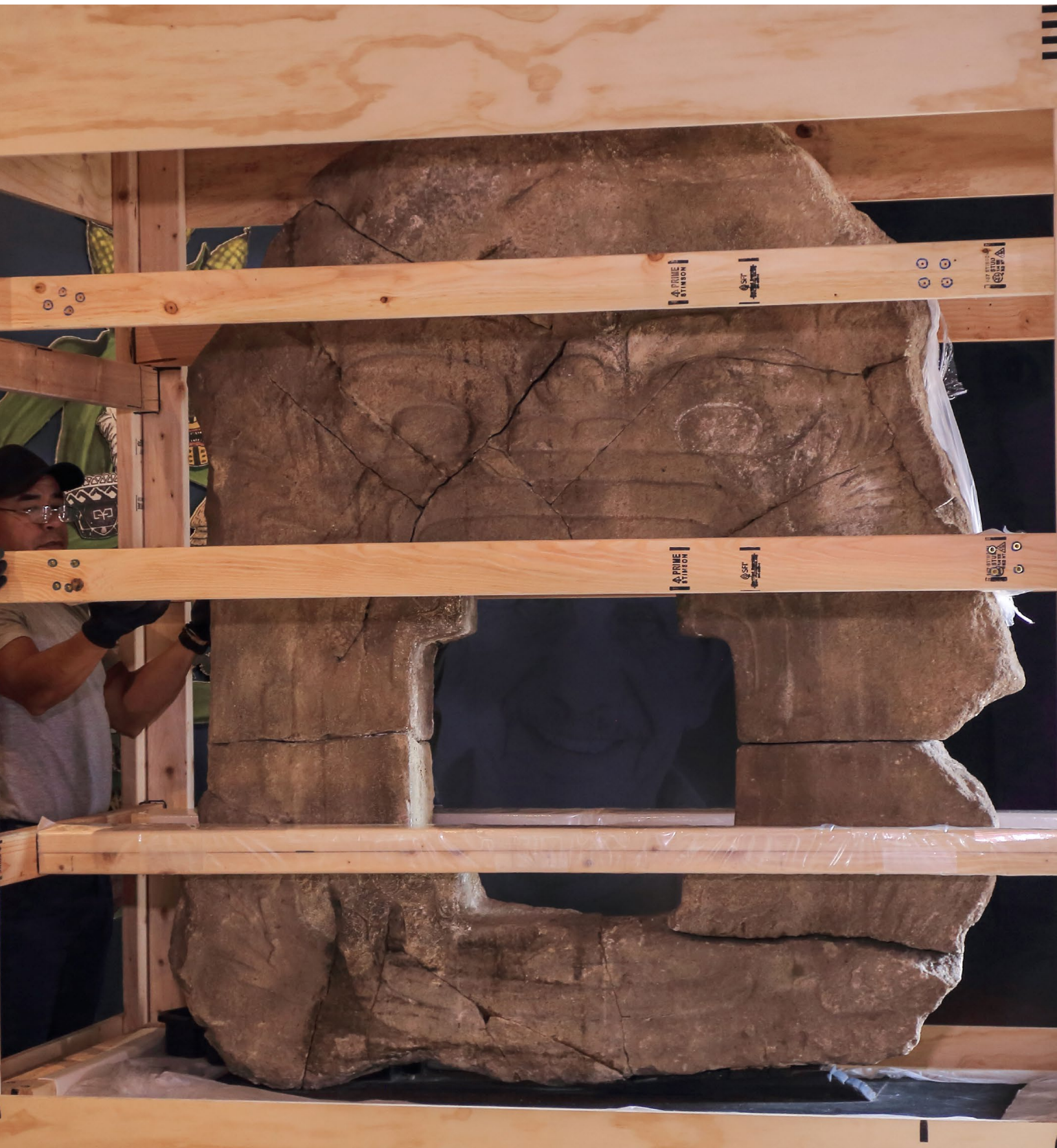
Monumento 9 de Chalcatzingo, embalado para su exposición en el Museo Regional de los Pueblos de Morelos, Palacio de Cortés, mayo 2023.