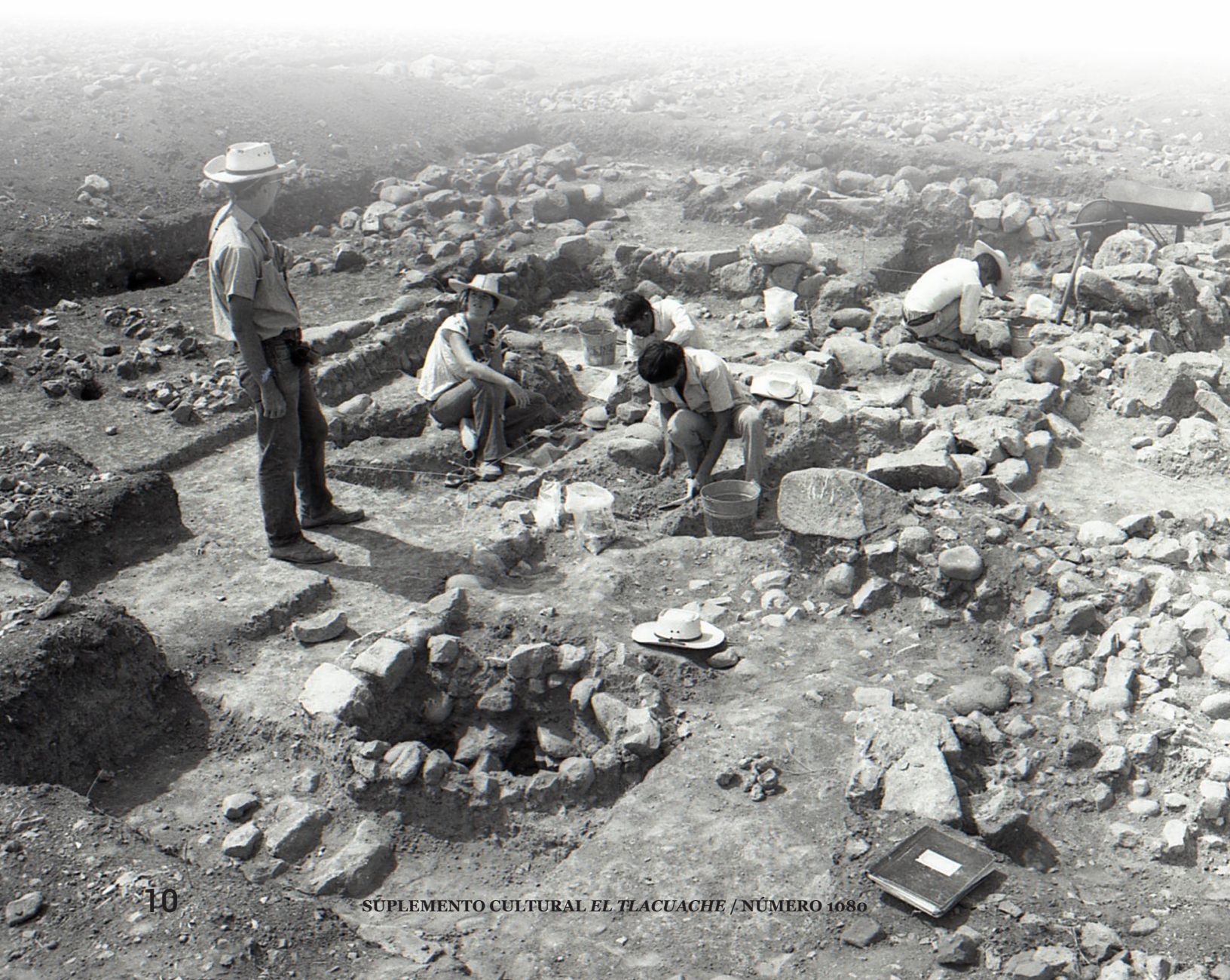
David Grove en el sitio arqueológico de Chalcatzingo. Chalcatzingo, Jantetelco, Morelos, 1972.

En los albores de este proyecto el arqueólogo Córdova, se percató de ese faltante en la narrativa del discurso contenido por las piedras, y comienza la indagación, tanto con los viejos investigadores como con las autoridades correspondientes para dar con el paradero del Portal al inframundo y lograr su recuperación para que vuelva al lugar de su creación, donde es parte fundamental.