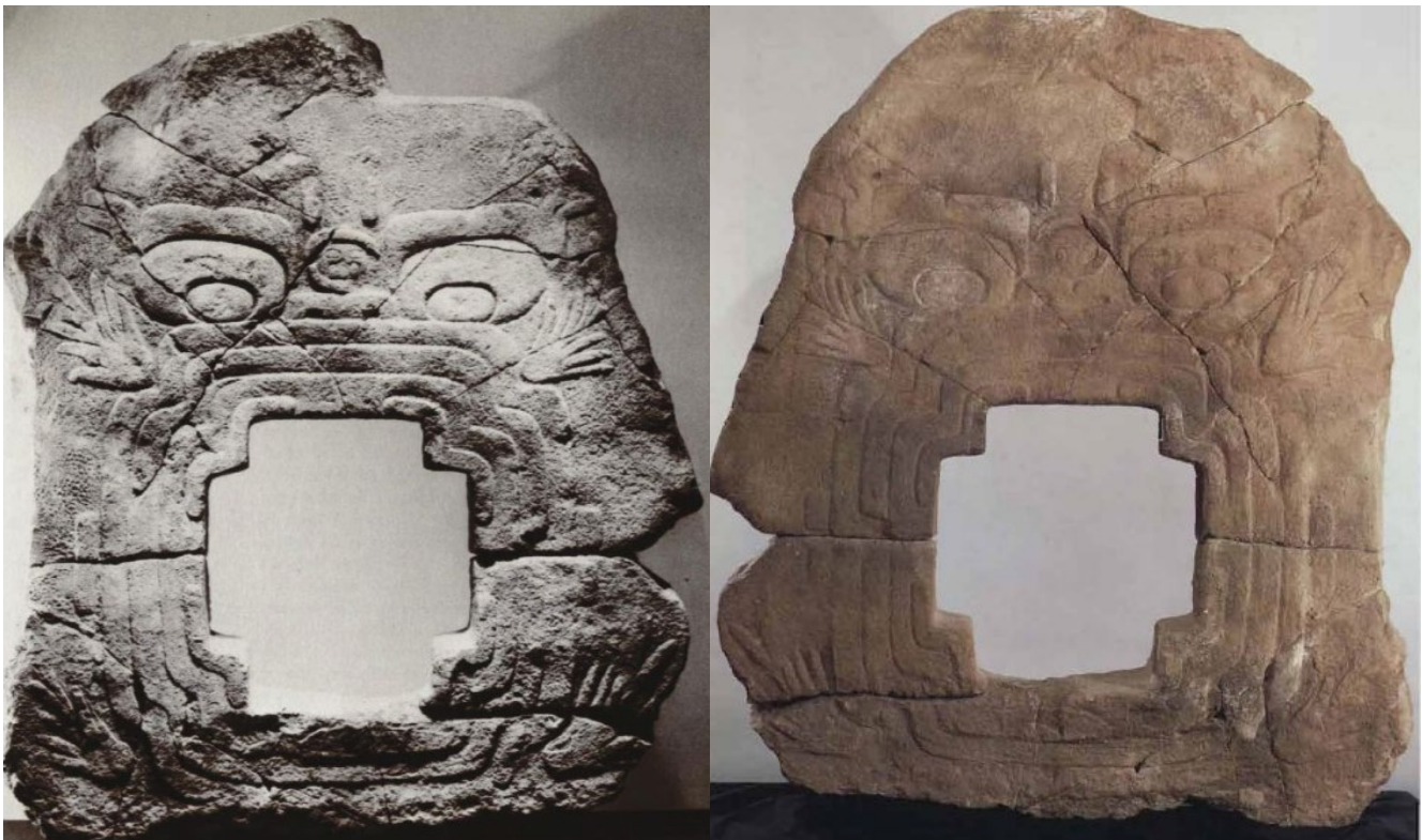
A la izquierda, fotografía del Monumento 9 en la exposición Before Cortés , A Centennial exhibition at the Metropolitan Museum of Art (30 septiembre 1970-3 enero 1971) (tomado de Before Cortés Sculpture of Middle America , 1970:79); la escultura fue prestada por el Munson-Williams-Proctor Institute , Utica, New York, donde estaba exhibida según se puede apreciar en la fotografía de la derecha (tomado de México en el Mundo de las Colecciones de Arte , 1994:36).

Es el arqueólogo David Grove quien, a raíz de sus estudios en Chalcatzingo, menciona por primera vez la existencia del Portal al inframundo, que aparece publicado en la revista American Antiquity en 1968. En ese momento el monumento se encontraba en exposición en la exhibición de historia del Munson – Williams Proctor Museum en Ithaca NY, posteriormente en 1972 fue visto en una exhibición nombrada Before Cortés en el Museo Metropolitano de Arte de Nueva York y después de recorrer diversas exposiciones (de las cuales no tenemos datos) regresó en 1992 a la exhibición z del Munson – Williams Proctor Museum en Ithaca NY, de ahí dejó de estar en exhibiciones y no se sabía su paradero.