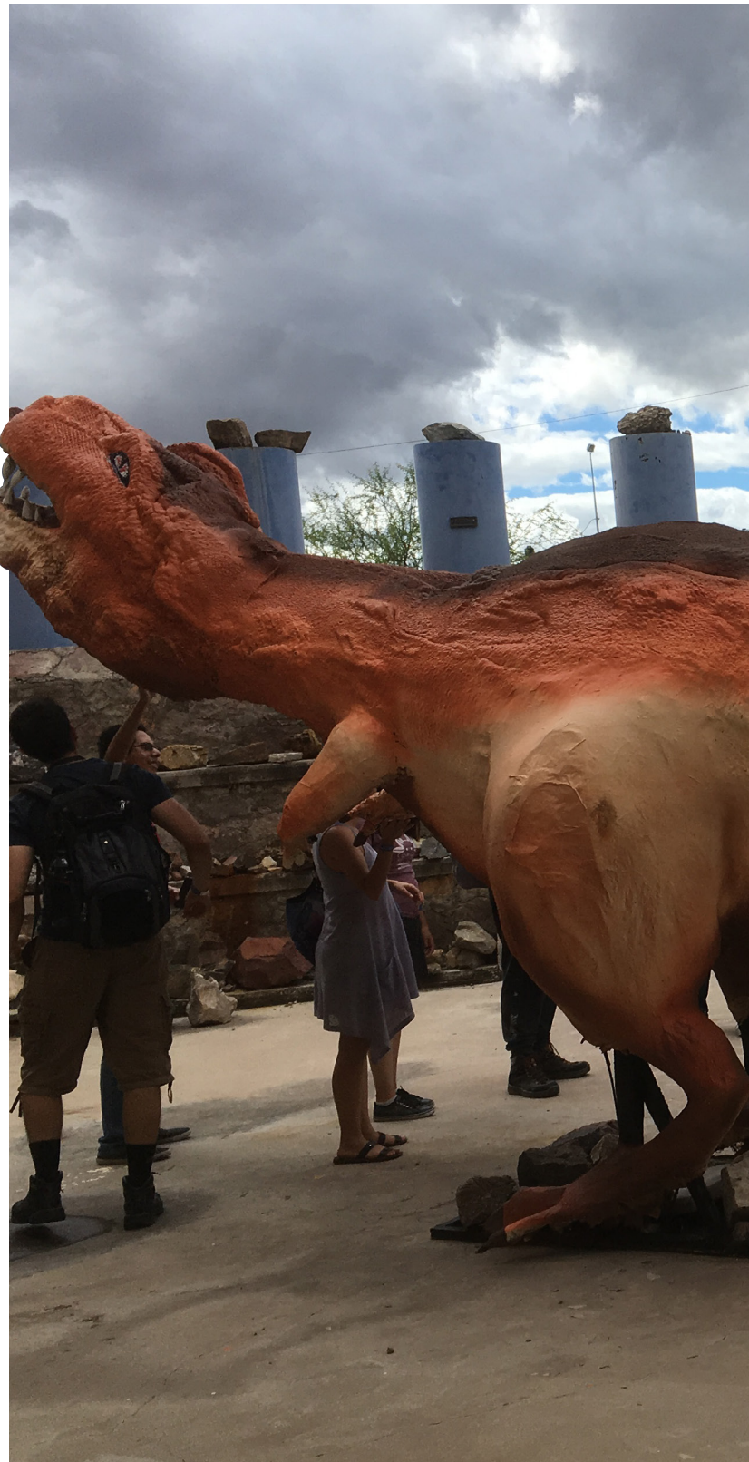
Explorando el dino. Estudiantes con reproducción de dinosaurio, Universidad Autónoma de Chihuahua.