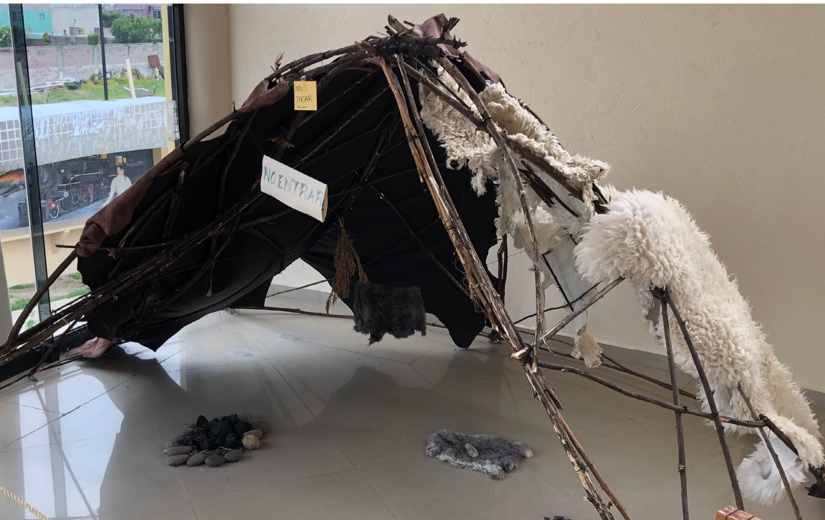
Aspecto sala infantil Museo del Mamut, Tultepec, Estado de México.

Estas entrevistas, también permitieron la generación de categorías de análisis, en cuanto a las diferencias de edades entre los sectores poblacionales, logrando con ello tener un acercamiento a las realidades de las juventudes, y la población de adultos jóvenes y adultos mayores de más de 65 años.