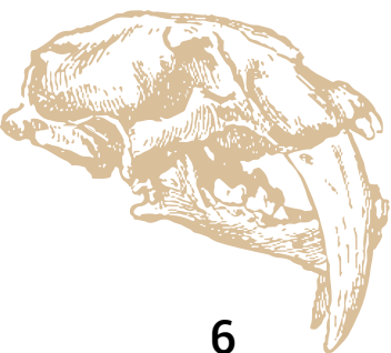
Páginas 6 y 7. Ejemplar de tigre dientes de sable. Exposición en el Museo Nacional de las Culturas del Mundo.