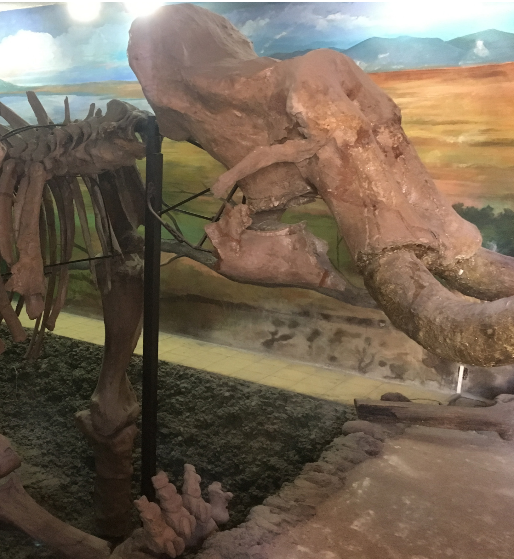
Páginas 10 y 11. Ejemplar en el Museo Paleontológico Comunitario, Magdalena Huizachitla, Coacalco, Estado de México.