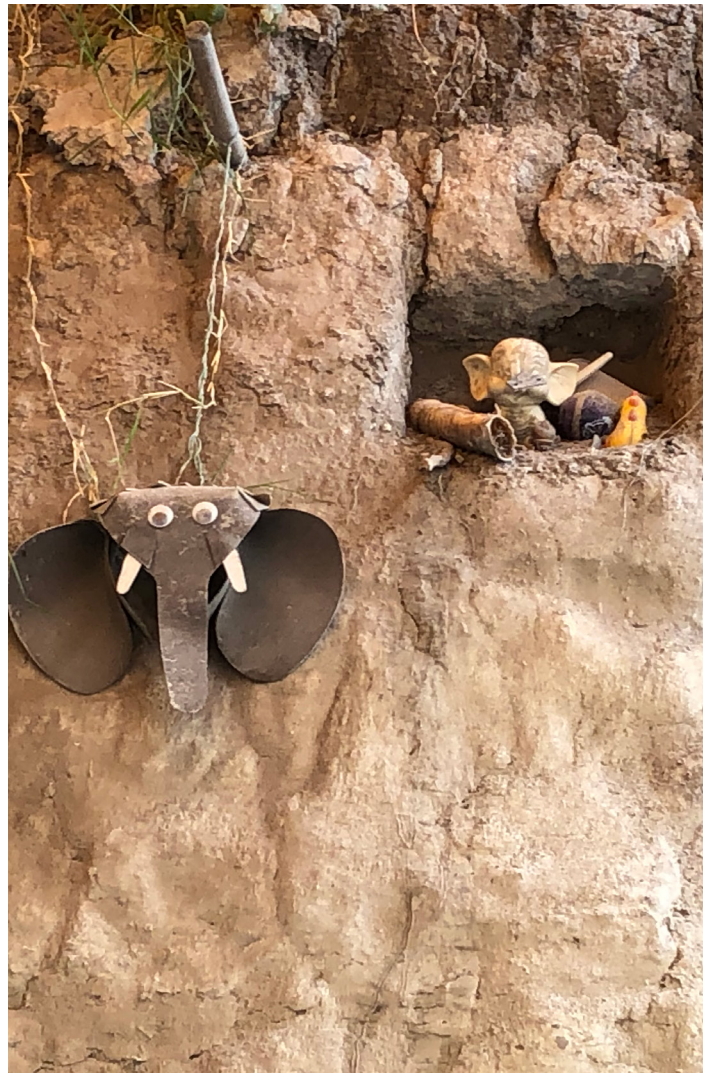
Ofrendas de trabajadores en la excavación de Tultepec, Estado de México.

A reserva de que se haga una revisión más detallada del tema, en términos legales los museos locales, pero sobre todo las asociaciones que los sustentan se consideran órganos coadyuvantes para la protección del patrimonio, mismos que deben ser registrados ante el INAH. Sin embargo, no todos los museos locales están reconocidos ante el INAH y a la fecha no hay un registro de cuantos museos locales existen. Sin embargo, las experiencias que se han registrado nos hacen constatar la importancia de la divulgación de los proyectos de investigación paleontológica dentro de las comunidades (ver Tlacuaches 859 ; 1006 ; 1054 ).