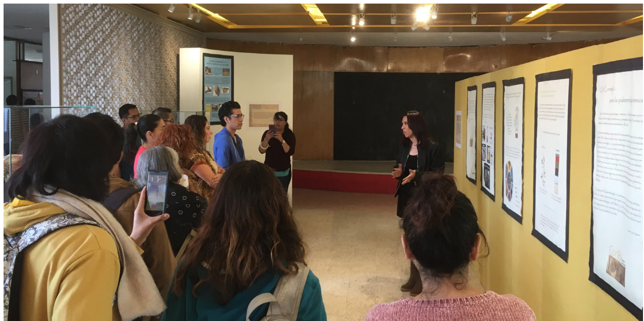
Aspecto de la Exposición El INAH y la Paleontología Mexicana en la ENAH.

E sta asignación sugiere una percepción de cerca sobre los fósiles y su descubrimiento desde una mirada local, por tal motivo uno de los coadyuvantes que se identifican dentro de las comunidades son las estrategias que se generan para preservarlos, como pueden ser los museos públicos y los museos locales (ver Recuadro 1).