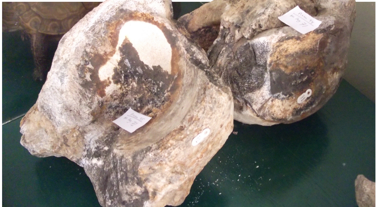
Ejemplares en el Museo Comunitario Indígena "Tlappan", Tlapa, Guerrero.

Como proceso identitario de la comunidad