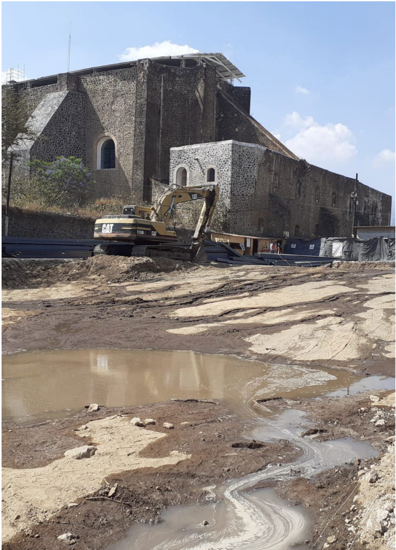
Aspecto del predio con la biblioteca demolida, momentos antes de la intervención del rescate arqueológico, se observa en perspectiva, la sección trasera del templo del convento de san Juan Bautista, Tlayacapan.