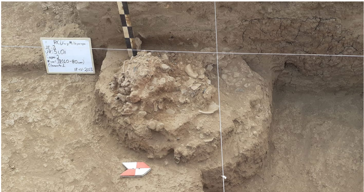
Arriba. Aspecto general del entierro y su ofrenda en el predio donde se construyó el Centro de Desarrollo Comunitario de Tlayacapan.