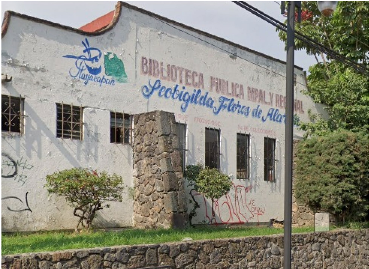
Aspecto de la fachada sur sobre la calle Benito Juárez, de la Biblioteca Pública Municipal y Regional Leobigilda Flores de Alarcón (Fondo PICZAT 2012), la cual fue demolida para la construcción del Centro de Desarrollo Comunitario de Tlayacapan.