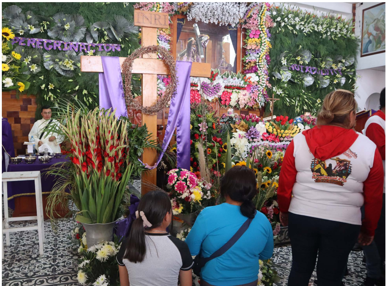
Entregamos nuestras plegarias. Tepalcingo, Morelos, 2024

Así, al momento mismo de partir del pueblo es parte de la ofrenda, muchos tienen dificultad para caminar, y es ahí en el esfuerzo, en el agotamiento incluso en las heridas en los pies causadas por caminar sin parar durante horas, en donde se haya el inicio del camino ritual hacia lo sagrado.