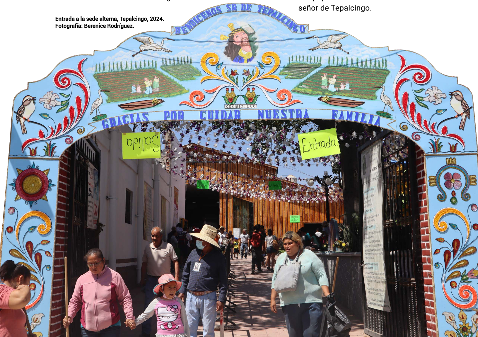
Entrada a la sede alterna, Tepalcingo, 2024.

Así, en esa mañana del 28 de febrero de 2024, previo al tercer viernes de cuaresma, las promesas y agradecimientos de dos peregrinaciones de dos pueblos distintos, se hacen presente en un santuario que reúne cada año alrededor de 2 millones de personas, y que colectivamente construyen y renuevan la religiosidad popular vivida en esta parte de México, el escenario religioso se fusiona con uno de intercambio comercial y sociocultural que está afuera del santuario y que lo convierte en un espacio icónico de múltiples encuentros. En este sentido, en este trabajo planteamos reconstruir a través de una posición etnográfica, la experiencia de dos peregrinaciones como un fenómeno que nos permite entender los elementos de una religiosidad tan profunda y de tradición popular como lo es la fiesta del señor de Tepalcingo.