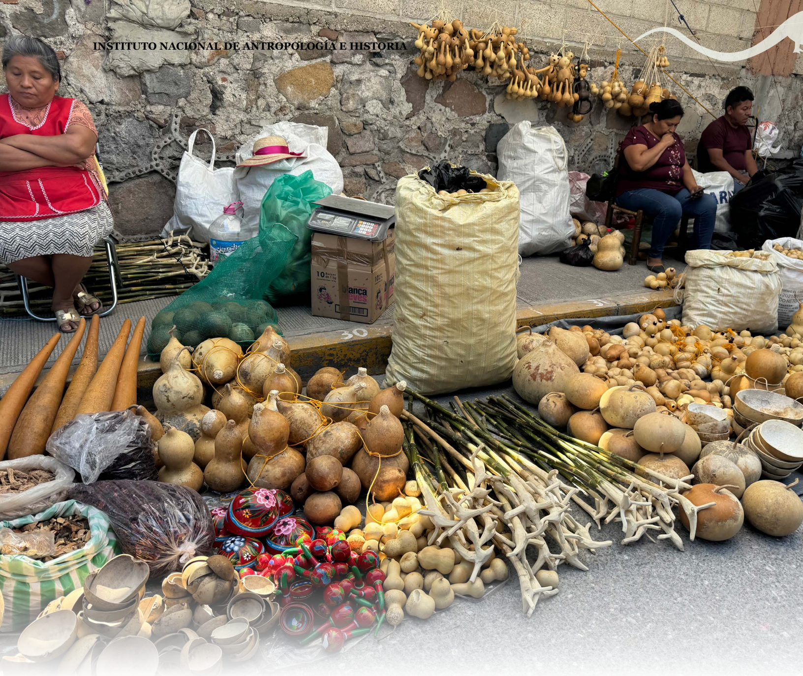
La calle de los bules, feria de Tepalcingo, Morelos, 2024.

La historia de la aparición en Tepalcingo es parte del modelo de apariciones que ocurrieron en el siglo XVI en la Nueva España y que tuvieron como eje veneracional a Cristo, apariciones que se multiplicaron por todo el territorio y que hoy son importantes centros de veneración que guardan el relato fundacional del lugar, como el caso del Señor de Chalma, y el Señor del Sacromonte (Amecameca) ambos en el estado de México, el Señor del Calvario en Mazatepec y el Señor de Tepalcingo, en Morelos, que juntos conforman una red de santuarios de cristos aparecidos en la época colonial y que hoy siguen conectados a través de las celebraciones de las fiestas de cuaresma (Bonfil, 2011).