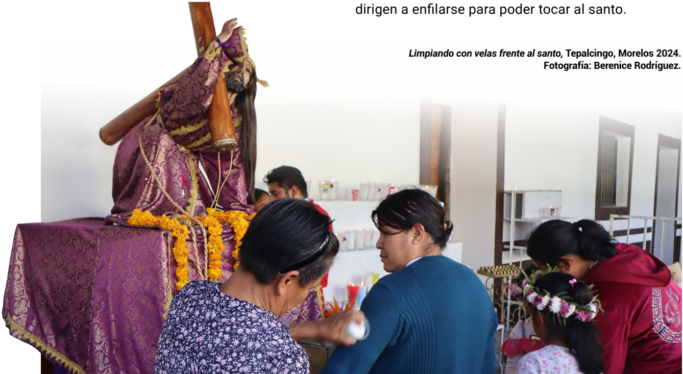
Limpiando con velas frente al santo, Tepalcingo, Morelos 2024.

Al igual que la familia de Marina, Teresa coincide al señalar que el Señor de Tepalcingo “es el más milagroso”, en años anteriores también hizo un milagro a su familia y debido a eso este año regresa a pedirle uno para ella. Cuando se para frente al santo patrón, la vela que lleva en su mano se la da a su hermana y ella la pasa por todo el cuerpo de Teresa, como limpiándola, mientras eso sucede Teresa cierra sus ojos y en unos instantes se humedecen. Las niñas que las acompañan y que también llevan sus velas, ven el acto con asombro, al terminar con Teresa, su hermana continúa el ritual con ellas, con las niñas que también son limpiadas con la vela. Después de unos minutos de dirigir unas palabras al santo que apenas parecen murmullos, las mujeres y niñas colocan sus velas en la mesa de ofrendas y se dirigen a enfilarse para poder tocar al santo.