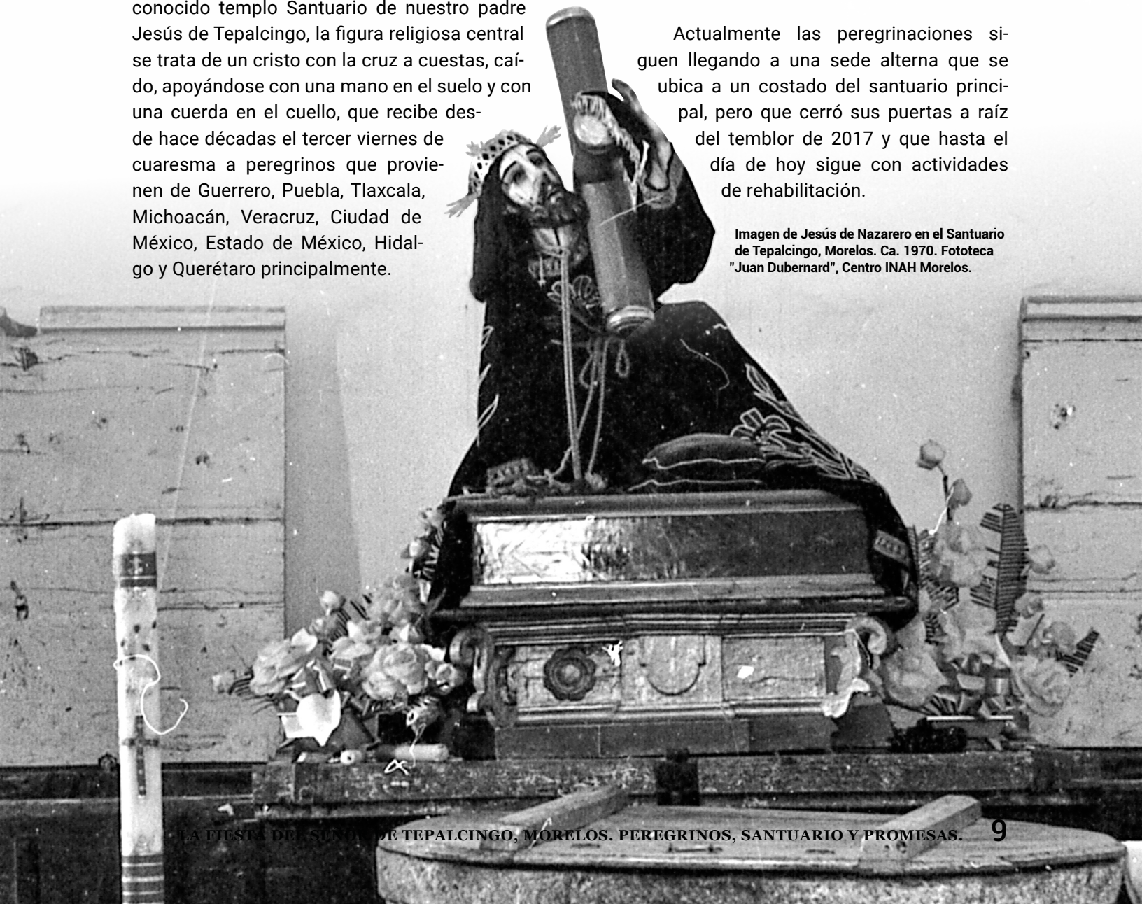
Imagen de Jesús de Nazarero en el Santuario de Tepalcingo, Morelos. Ca. 1970.

Actualmente las peregrinaciones siguen llegando a una sede alterna que se ubica a un costado del santuario principal, pero que cerró sus puertas a raíz del temblor de 2017 y que hasta el día de hoy sigue con actividades de rehabilitación.