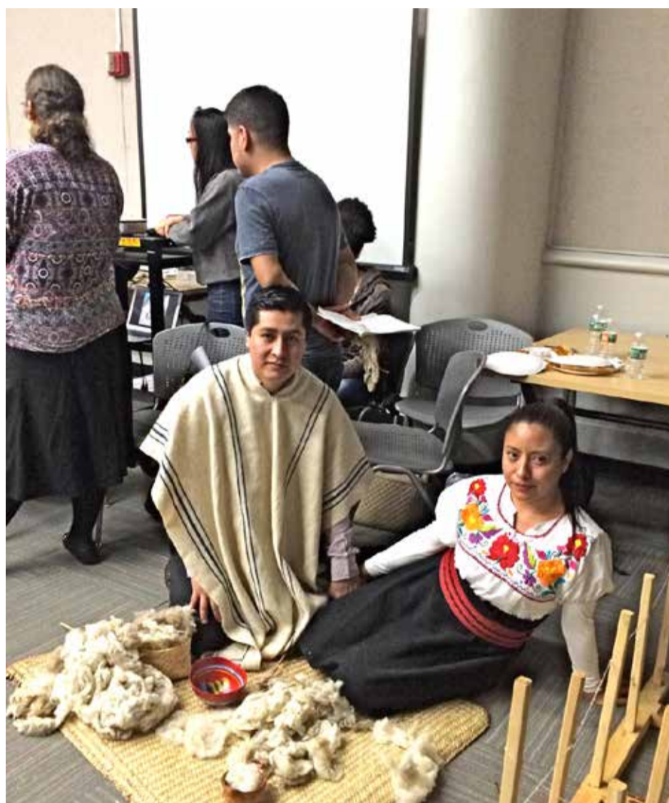
Demostración de telar, Hunter College, Nueva York. mayo 2016. Autor. Mario Flores.