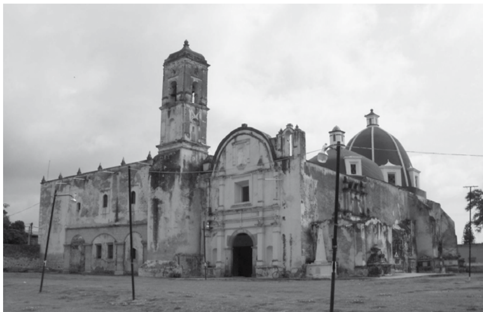
Fachadas poniente y sur del exconvento de San Agustín en Jonacatepec.

Por otra parte se realizó el retiro de algunos sedimentos depositados principalmente a lo largo de los muros perimetrales en la parte interior del atrio, seguramente producto de años de no brindar un mantenimiento mínimo del lugar. Conforme se retiró la capa de sedimentos mencionada fueron recuperándose los pasillos procesionales, tanto en el lado norte y sur del atrio como en el lado poniente del mismo. Respecto al estado de conservación, se puede resaltar el del pasillo norte puesto que casi no fue alterado mediante la deposición de tumbas en la época en que el