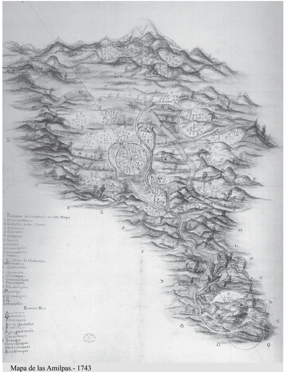
Mapa de las Amilpas.- 1743

Paralelamente también en el oriente del estado de Morelos penetraron tres órdenes religiosos. Al principio llegaron los franciscanos y finalmente ter-