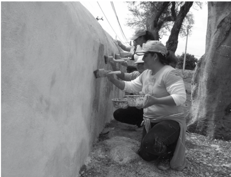
Aplicación de pintura a la cal sobre el interior del muro perimetral oriente.

la Revolución Mexicana sufrió algún tipo de afectación, la cual quedó marcada a manera de horadaciones probablemente producto de impactos de proyectiles en las fachadas sur y poniente del templo así como parte del campanario.