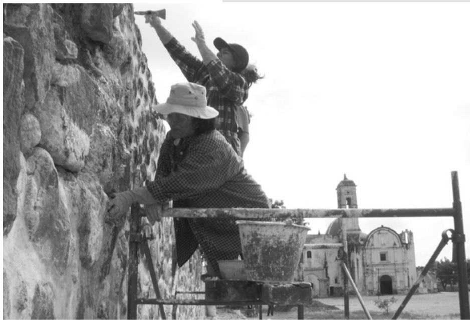
Mujeres del PET en Jonacatepec realizando la reintegración de faltantes al interior del muro atrial norte.

Es importante mencionar que a pesar de que el trabajo de todos y cada uno de los integrantes del PET es importante e indispensable, las mujeres integrantes del PET en Jonacatepec han demostrado una mejor habilidad y disciplina para reintegrar faltantes y