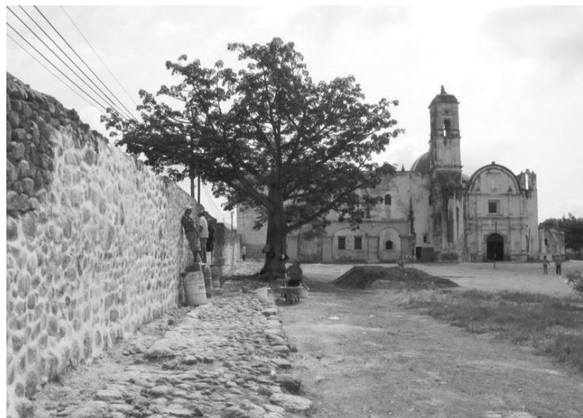
Muro atrial norte a la fecha.

Finalmente se debe mencionar a manera de conclusión que los proyectos como el PET aplicados correctamente a los inmuebles históricos garantizan un mantenimiento y rehabilitación urgentes y necesarios que, sumados a la capacitación de los pobladores locales, se traducen en la Protección, Difusión y Conservación del Patrimonio Cultural de los morelenses.