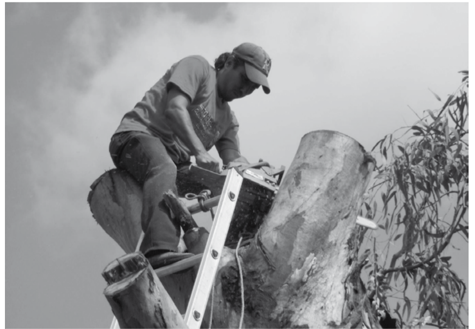
Proceso de poda preventiva de especies vegetales al interior del atrio.

El monumento histórico materia de éste artículo fue edificado durante el siglo XVI, ocupado durante un periodo prolongado de tiempo y posteriormente durante