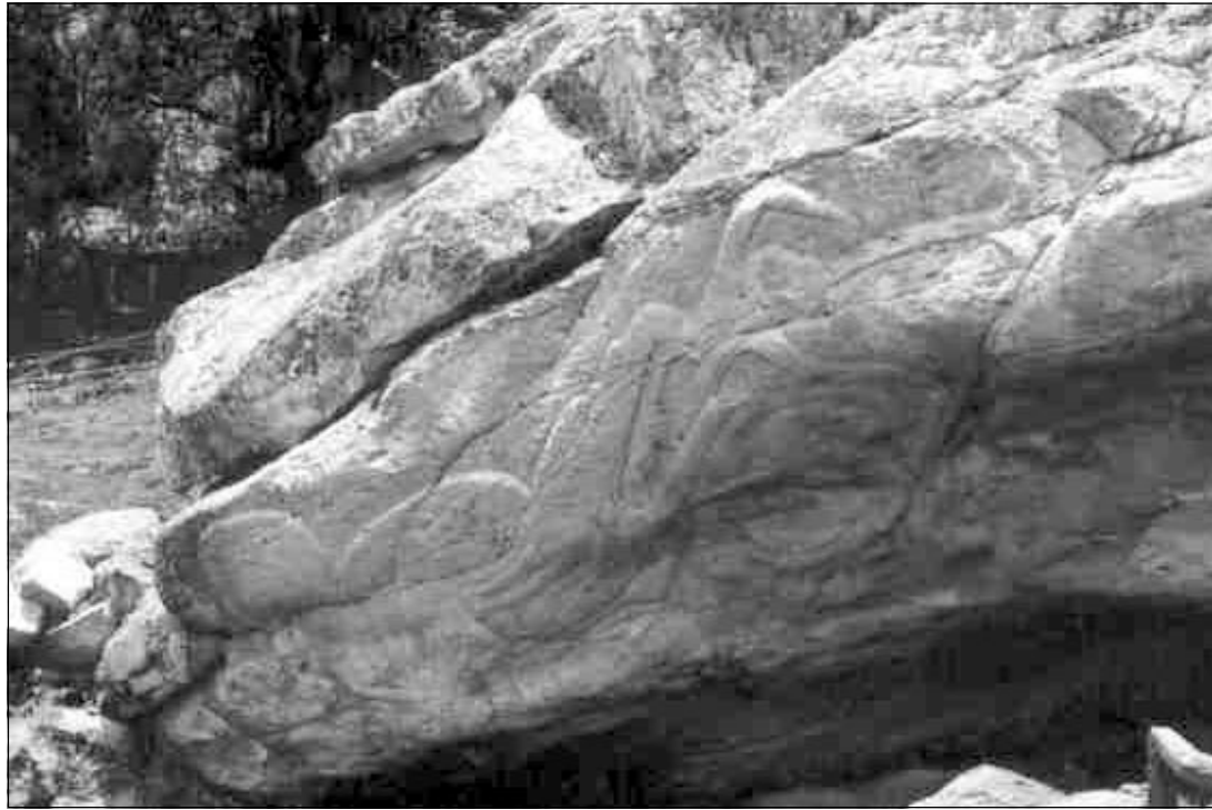
Monumento 5. "El mito de la creación del hombre". Chalcatzingo