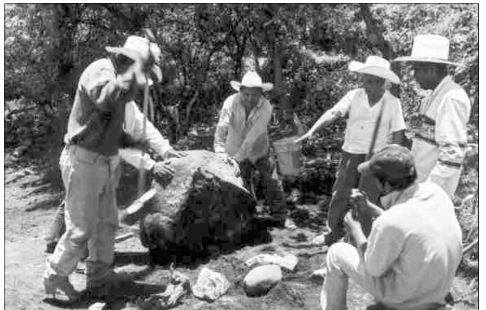
Trabajos en el Monumento 5. Chalcatzingo

formativo temprano cuando era una pequeña aldea, que en el formativo medio cuando debió ser un gran centro de peregrinación donde los dioses a los que hemos llamado "olmecas" hicieron allí su icpalli y fueron representados en las paredes del cerro así como el nacimiento del hombre y los rituales de fertilidad. Como en el clásico en el cual levantaron varios templos, extendieron varias terrazas y construyeron un juego de pelota. Que fue un sitio de descanso y seguramen-