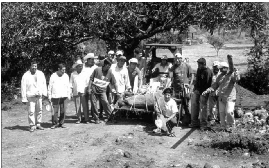
Traslado del monumento 31 al museo de sitio

ellos. Debo bajar la velocidad o me toparé de frente con la recua de burros que suele pastar en esta parte. Si, allí están. Como siempre, son escoltados por un anciano de postura mar-