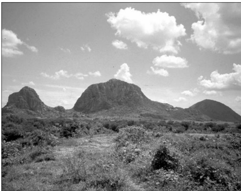
Los cerros sagrados de Chalcatzingo

Pasando el cruce de Amayuca avanzo unos cuantos cientos de metros para tomar el antiguo camino real de Jantetelco a Chalcatzingo. Al dar la vuelta el paisaje cambia, se observan