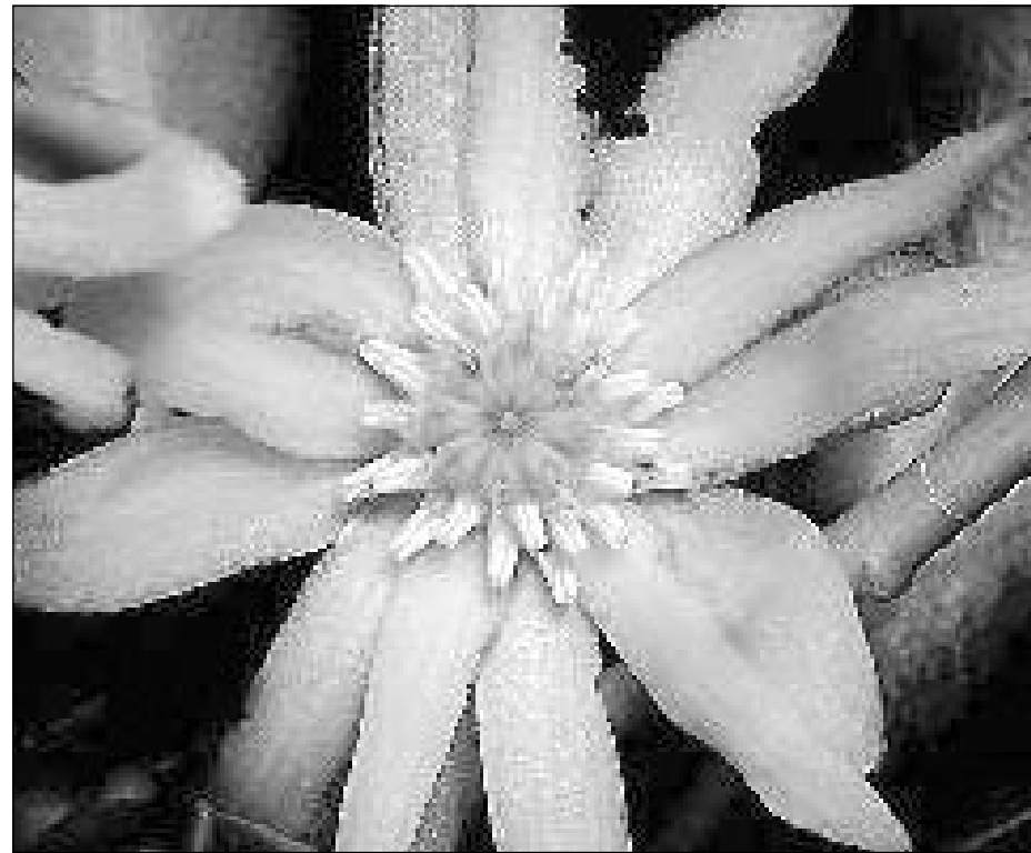
Flor de Illicium verum . http://www-ang.kfunigraz.ac.at/%7Ekatzer/engl/generic_frame.html?Illici_ver.html

illicium verum , y Illicium anisatum comparten características muy similares y que en dado momento, es factible confundirlas.