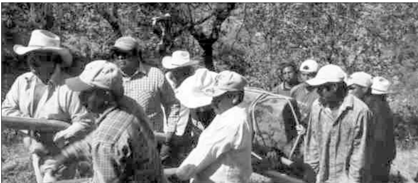
Trabajadores sacando al Monumento 31 de la terraza en que se encontró. Chalcatzingo

te de estudio para todos aquellos que pasaron del altiplano central a los diferentes puntos que son accesibles desde aquí. Que durante el posclásico fue un altar y adoratorio y que en la actualidad cada 12 de diciembre sigue siendo un punto de reunión para la devoción de los hombres. Me encuentro en fin, trabajando en Chalcatzingo.