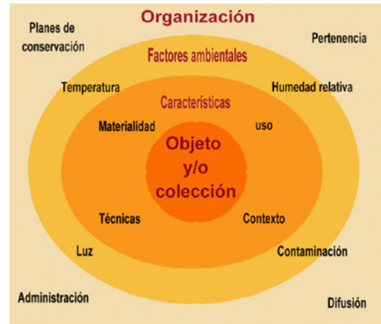
Figura 3. Esquema basado en el Código de Manejo de Colecciones Culturales del Reino Unido, PAS 197:2009 .

Los factores ambientales que influyen no solo en el objeto o la colección, también en el personal que labora, así como en los usuarios, son considerados en una tercera fase; dichos factores están estrechamente relacionados entre sí y con la fase anterior. Por ejemplo, los efectos de la temperatura en los materiales y en las condiciones de consulta y almacenaje; la humedad relativa como un elemento que influye en los materiales constitutivos, en la mecánica de las encuadernaciones e incluso en el mobiliario; los tipos de luz y los efectos que tienen en la materia y en las personas; el polvo, los gases, desperdicios y demás tipos de contaminación como factores de riesgo, así como sus relaciones nocivas en el ambiente. Por último, es necesario tener presente la organización general, algunos aspectos importantes para la elaboración de políticas o estrategias de preservación, conservación y/o restauración, y la forma adecuada para llevarlas a cabo; se revisan los medios legales, administrativos, tecnológicos y logísticos para proteger y dar a conocer la pertenencia de los objetos; el conjunto de actividades que tienen por finalidad garantizar el uso adecuado de los recursos materiales y humanos; la comunicación responsable, interna y externa, de la normatividad, las actividades y los objetivos de la institución, de acuerdo con la misión para la que fue creada.