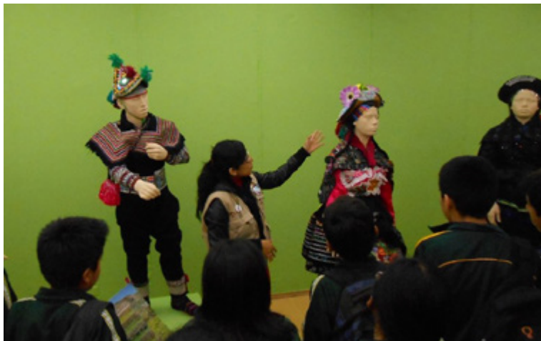
Figura 3. Estrategia didáctica “Aprender haciendo”.

Respecto al proceso de construcción, planteamiento y desarrollo de este proyecto educativo, debemos mencionar que ha estado acompañado por el contacto directo con los niños, niñas y jóvenes que estudian en instituciones educativas públicas y privadas ubicadas tanto en zonas urbanas como rurales. Esta interrelación nos ha permitido recoger directamente las inquietudes, necesidades, curiosidades y aspiraciones vinculadas con el patrimonio cultural; al mismo tiempo, nos ha permitido validar, reformular y afinar los materiales y las estrategias didácticas planteadas inicialmente (véase figura 3).