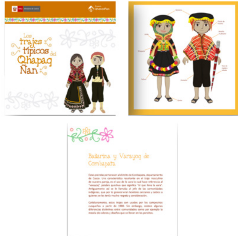
Figura 7. Catálogo vestimenta típica símbolo de identidad.