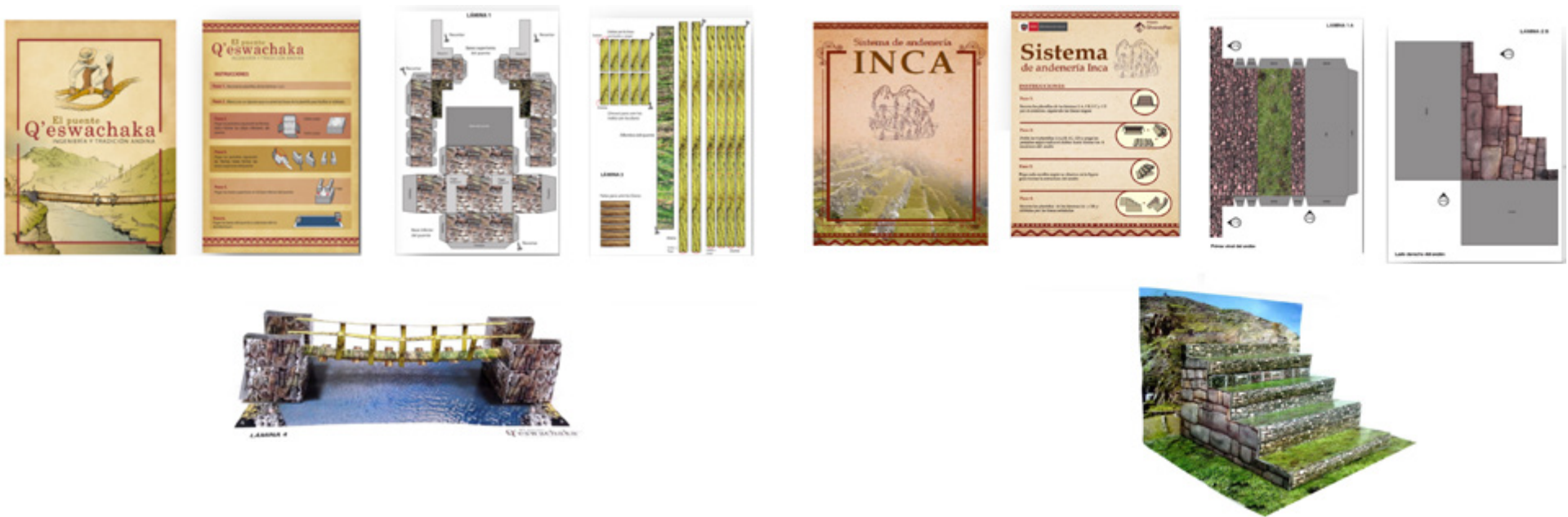
Figura 4. Armable del puente Q'eshwachaka.