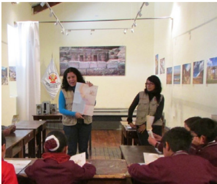
Figura 10. Talleres educativos vivenciales. Archivo Qhapaq Ñan, 2014.