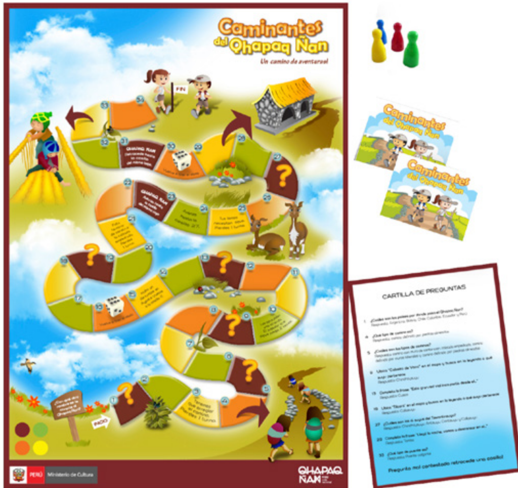
Figura 9. Juego: El Qhapaq Ñan, un camino lleno de aventuras.

Estos cuadernos de actividades han sido trabajados con los motivos iconográficos que se encuentran en la decoración de la cerámica inca de Cuzco y las pinturas de José Sabogal con rostros y escenas de la cultura inca.