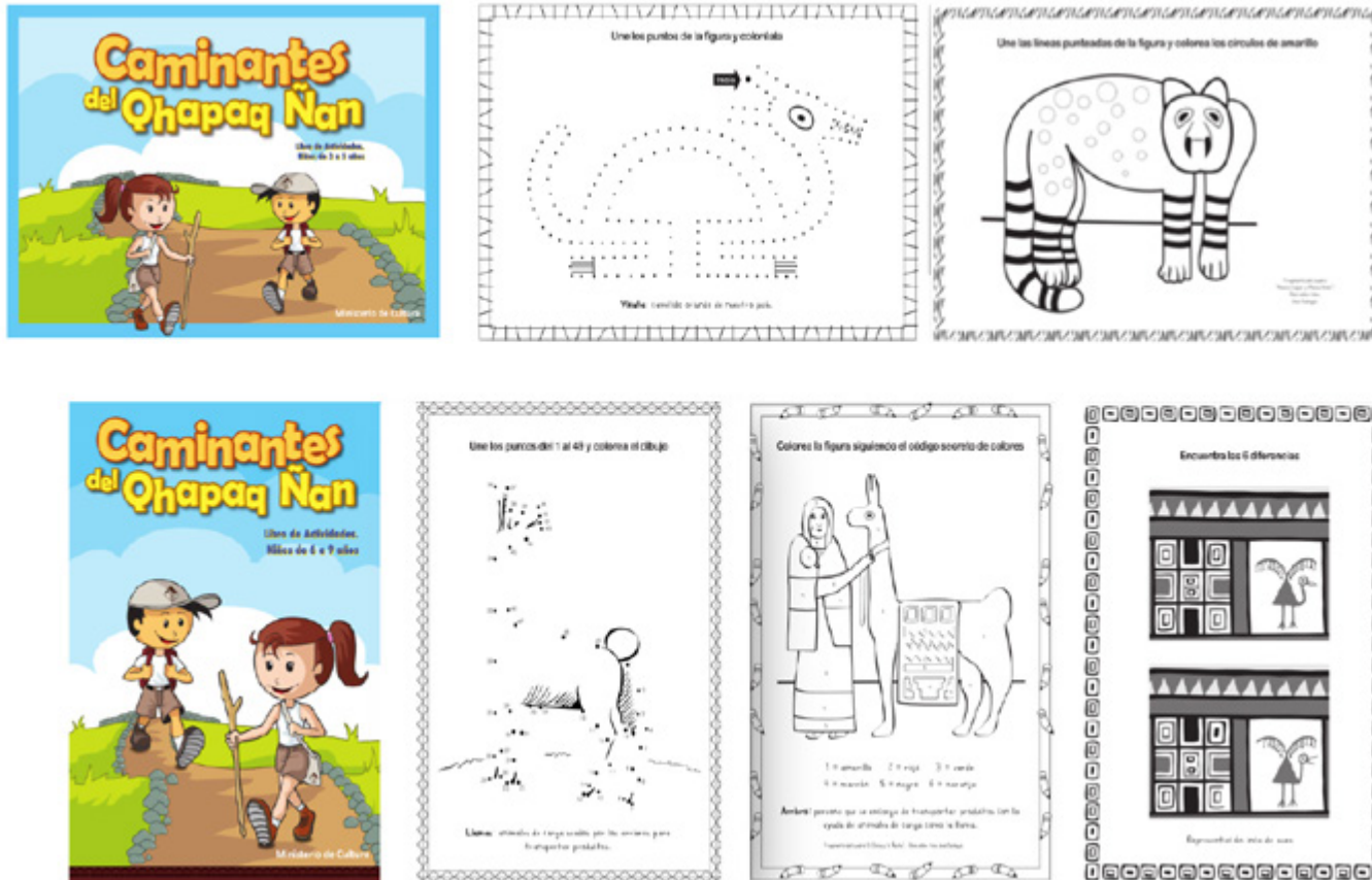
Figura 8. Cuadernos de Actividades. Archivo Qhapaq Ñan, 2015.