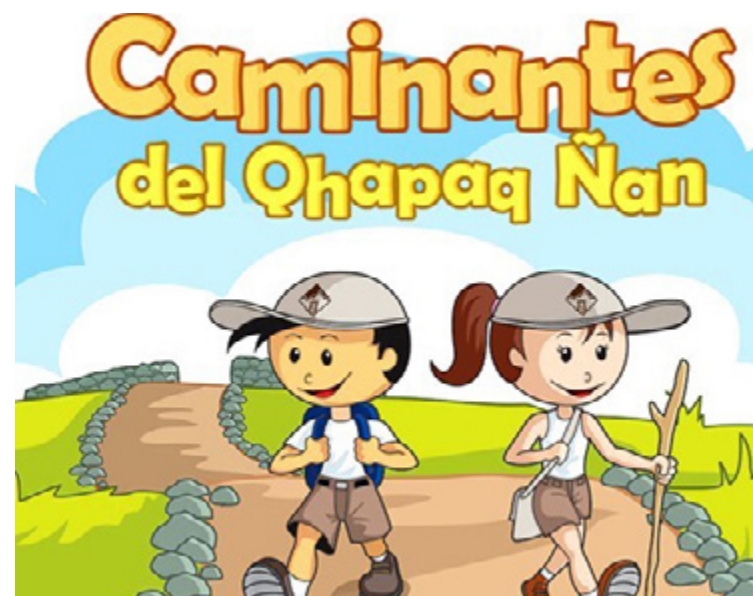
Figura 2. Proyecto educativo Caminantes del Qhapaq Ñan.

Es así como surgió el proyecto educativo Caminantes del Qhapaq Ñan orientado a fomentar la creación y/o desarrollo de diversos vínculos entre la población y el patrimonio cultural material e inmaterial, asociado al Qhapaq Ñan, de manera tal que niños, niñas y jóvenes, puedan reconocer que su patrimonio cultural no solo es una herencia, sino que forma parte del presente en tanto es parte de su entorno y constituye un elemento fundamental de su idiosincrasia, y solo formará parte del futuro en la medida que podamos preservarlo (véase figura 2).