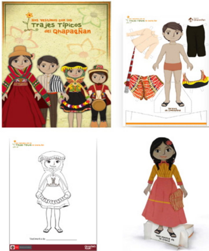
Figura 6. Armable vestimenta típica símbolo de identidad.

taller, el cual es entregado a los profesores para que sea utilizado como material de apoyo durante el refuerzo que se hace luego del taller (véanse figuras 6 y 7).