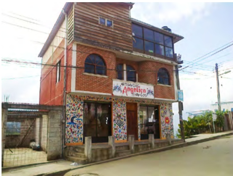
Figura 9. Artesanías Angélica, establecimiento comercial en la cabecera municipal de Tenango de Doria.

En Tenango de Doria existen tres formas de producir y comercializar tenangos. Por un lado, aquellos bordadores que antes de dedicarse a esta actividad participaban en servicios, comercio y habían migrado, y gracias a su experiencia laboral establecieron de manera formal, tiendas y talleres en la cabecera municipal. Para ellos, esta actividad es un negocio donde obtienen ganancias, reinvierten y ahorran. Elaboran tenangos por mayoreo con ayuda de otros bordadores que contratan y distribuyen permanentemente en mercados nacionales e internacionales, en boutiques , tiendas de artesanías, hoteles, restaurantes y participan en ferias (figura 9).