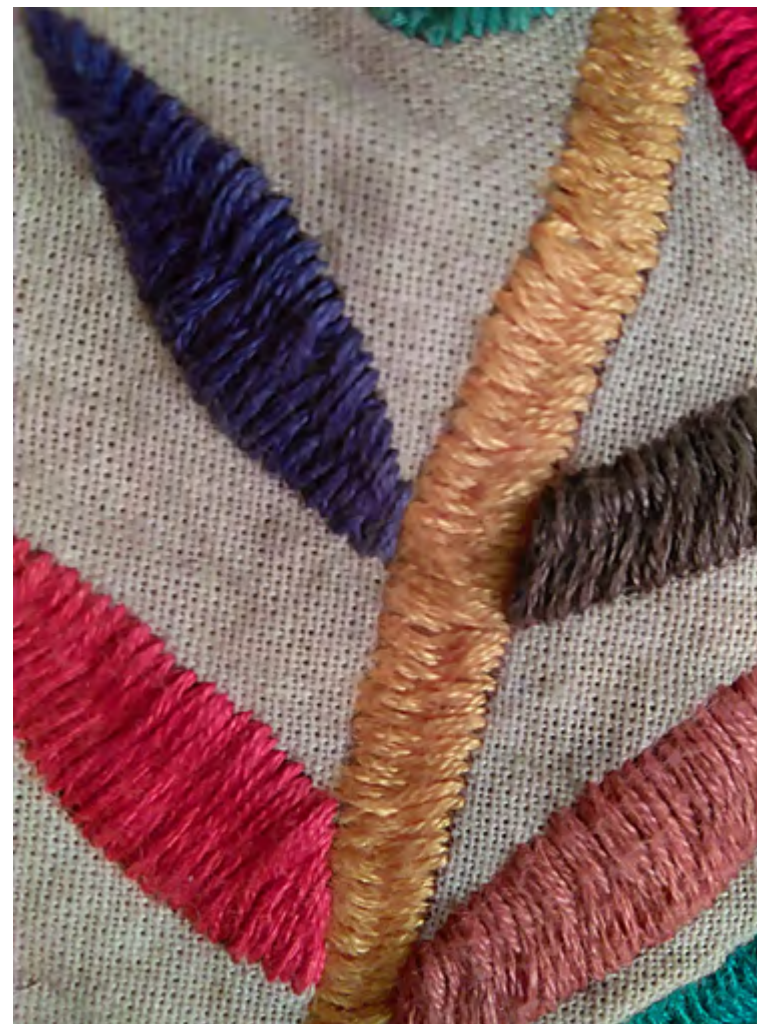
Figura 2. Técnica de bordado al pasado cruzado. (Fotografía: Diana Macho Morales, 2015).