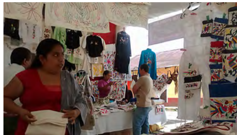
Figura 6. Objetos hechos con tenangos. Exhibidor en la fiesta de San Agustín, cabecera municipal de Tenango de Doria. (Fotografía: Diana Macho Morales, 2015).

do ciertas categorías para definir sus textiles como auténticos y que de ese modo sean reconocidos 6 (figura 7).