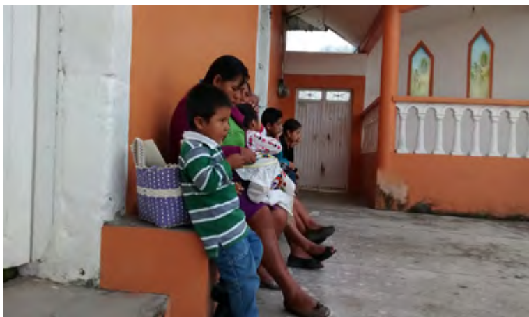
Figura 10. Mujer bordando en el atrio de la iglesia de San Agustín en Tenango de Doria.