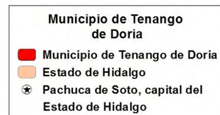
Figura 3. Ubicación del municipio de Tenango de Doria. Mapa elaborado con base en Esri, 2016, NOAA, 2016 y USGS. (Ilustración: Elisa Macho Morales, 2016).