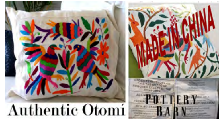
Figura 11. Publicidad de la denuncia hacia Pottery Barn en la página web Change.org < https://www.change.org/p/williams-sonoma-pottery-barn-please-stop-selling-fake-otomi-embroidery-items-made-in-china?source_location=minibar >.