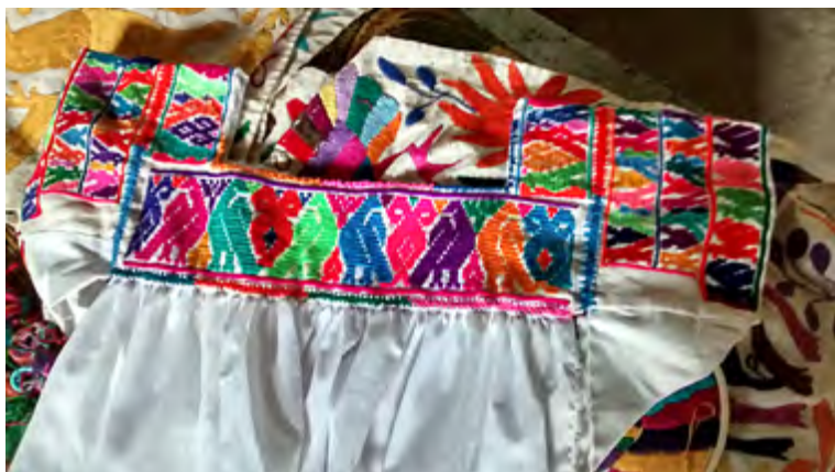
Figura 4. Blusa tradicional de la región Otomí-Tepehua.