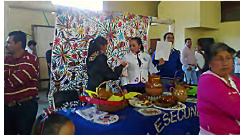
Figura 12. Encuentro intercultural de telesecundarias de Tenango de Doria, en enero del 2015. Profesores y alumnos portaban ropa bordada; cada escuela presentó comida tradicional de su localidad y bordados tenangos.

Para los bordadores, si bien la actividad textil y los bordados son parte fundamental de su definición como un grupo social y cultural específico, les importa en especial, el reconocimiento de su labor tanto en la región como en todos