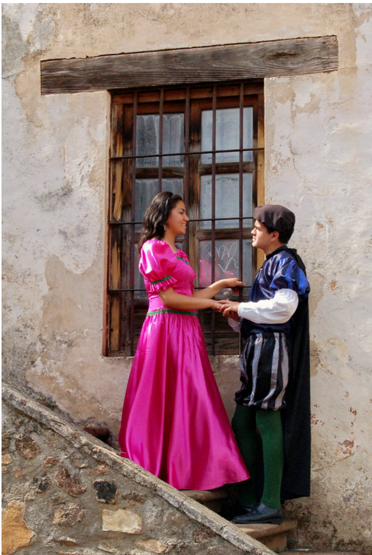
Figura 10. Personajes con atuendos coloniales en Pátzcuaro, Michoacán.

En la últimas tres décadas, el desarrollo del turismo en los destinos patrimoniales ha estado estrechamente relacionado con la utilización de sus hitos monumentales, con sus tradiciones culturales inmateriales y con la utilización del paisaje histórico urbano como referencia emblemática para crear imágenes y escenarios que resultan de gran atractivo; en algunos casos se trata de valores auténticos, como ocurre con las ciudades Patrimonio de la Humanidad. Sin embargo, en otros casos se producen ambientes implantados y apegados a las prácticas de consumo de un modelo definido como disneyzation (Bryman, 2005) o disneyficación , 6 dirigido a una sociedad del entretenimiento que desarrolla sus actividades dentro de la oferta de recursos culturales ligado a actividades recreativas, donde los contextos preconcebidos que otorga el patrimonio urbano arquitectónico configuran o recrean un ambiente “mágico”, que en un proceso de marketing y consumo híbrido han sido moldeados para ofertar una experiencia sensorial, visual y de “ambiente pintoresco” enfocados a la seducción de un mercado turístico compuesto por destinatarios que compran un producto de ocio “divertido y fantástico”, mas no realizan actividades de turismo cultural propiamente dichas (conocimiento cultural, interpretación auténtica y una experiencia de calidad cultural).