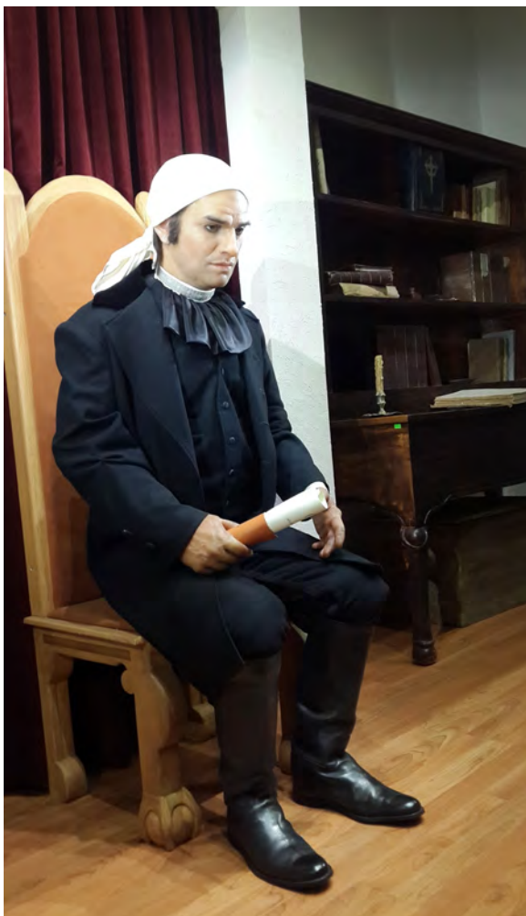
Figura 9. Animatronic (maniquí animado) del héroe de la Independencia de México José María Morelos, que se expone en la casa natal de Morelos.

La evolución del turismo, partiendo de las teorías de la modernidad, ha sido abordada por varios autores, cuyas aportaciones nos brindan algunas pautas para analizar el fenómeno. Urry (1990) caracteriza al turismo como una