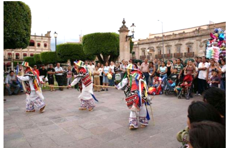
Figura 8. La Danza de los Viejitos en la Plaza de Armas de Morelia. Fotografía de Carlos Hiriart, 2012