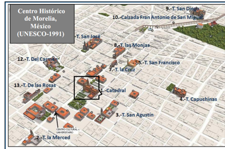
Figura 2. Centro Histórico de Morelia como destino turístico. Elaboración propia a partir de la imagen tomada de un folleto promocional publicado por la secretaria de turismo del Estado de Michoacán, 2012.

Desde la década de 1930 el impulso a la actividad turística en Morelia ha estado estrechamente ligado a la explotación del patrimonio cultural. La historia reciente del turismo en Morelia se inicia 1998, año en que se puso en marcha una intensa promoción del segmento del turismo cultural con una visión de planificación estratégica institucional, lo que impulsó diversas acciones de promoción y de rehabilitación del patrimonio monumental por parte de las diferentes administraciones municipales, con respaldo de los gobiernos federal y estatal. Lo anterior se tradujo en un crecimiento sostenido de la actividad turística local hasta el año 2008.