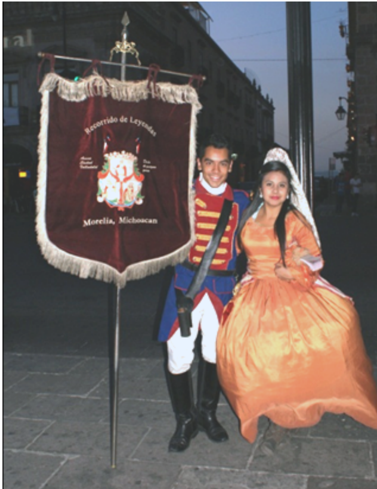
Figura 6. Personajes con atuendo de la época colonial en el Centro Histórico de Morelia. Fotografía de Carlos Hiriart, 2014.