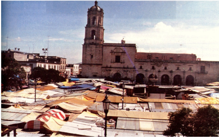
Figura 3. Plaza Valladolid de Morelia, invadida por el comercio informal en el año 2000. Fotografía de Rogelio Morales García, 2000.

del Centro Histórico. A partir de esa fecha se desarrolló una exitosa política de promoción del turismo cultural que benefició no solamente a Morelia, sino trascendió como detonante para el crecimiento del turismo en Michoacán.