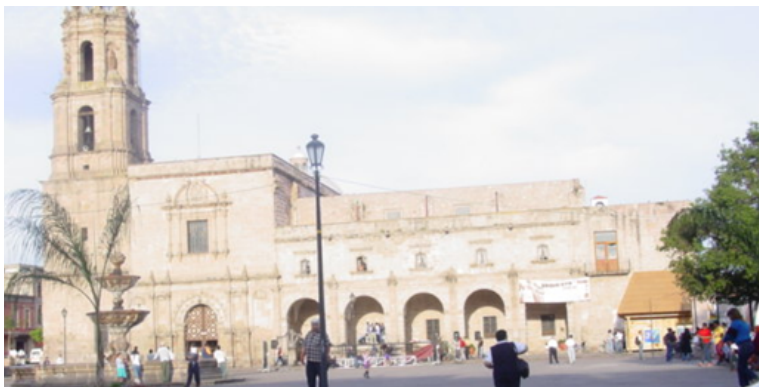
Figura 4. Plaza Valladolid de Morelia, después de la reubicación del comercio informal en junio del 2001.

A lo largo de ese proceso, Morelia consolidó una imagen propia a través de diversos recursos culturales. Ello le permitió posicionarse por arriba de destinos con características similares, y por ello competidores directos (Guanajuato, Oaxaca, Querétaro, Zacatecas, etc.) hasta el año 2007. 4 Sin embargo, las cifras actuales de afluencia turística revelan un drástico declive en la llegada de viajeros a Morelia, mostrando de manera contundente la forma negativa en que el incremento de la inseguridad y violencia, en la ciudad y el estado, ha afectado al sector turístico local.