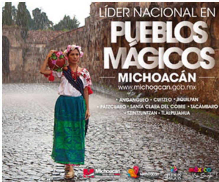
Figura 11. Cartel promocional de Pátzcuaro Pueblo Mágico.

Como ejemplo de este mercado, en el caso de México tenemos las diversas poblaciones que han sido incluidas en el controvertido programa de Pueblos Mágicos.