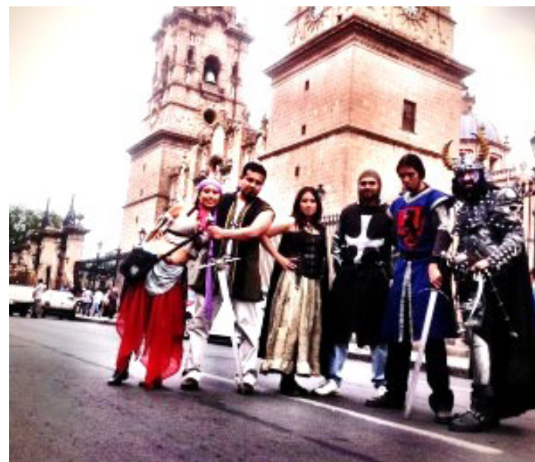
Figura 15. Personajes que participan en la Feria Medieval de Morelia. Imagen tomada de La Jornada Michoacán , edición del 2 de agosto del 2013. Documento electrónico disponible en: http://www.lajornadamichoacan.com.mx/2013/08/02/morelia-sera-invadida-por-personajes-de-la-epoca-medieval/ de, consultado en marzo del 2014. Fotografía de Carlos Hiriart, 2013.