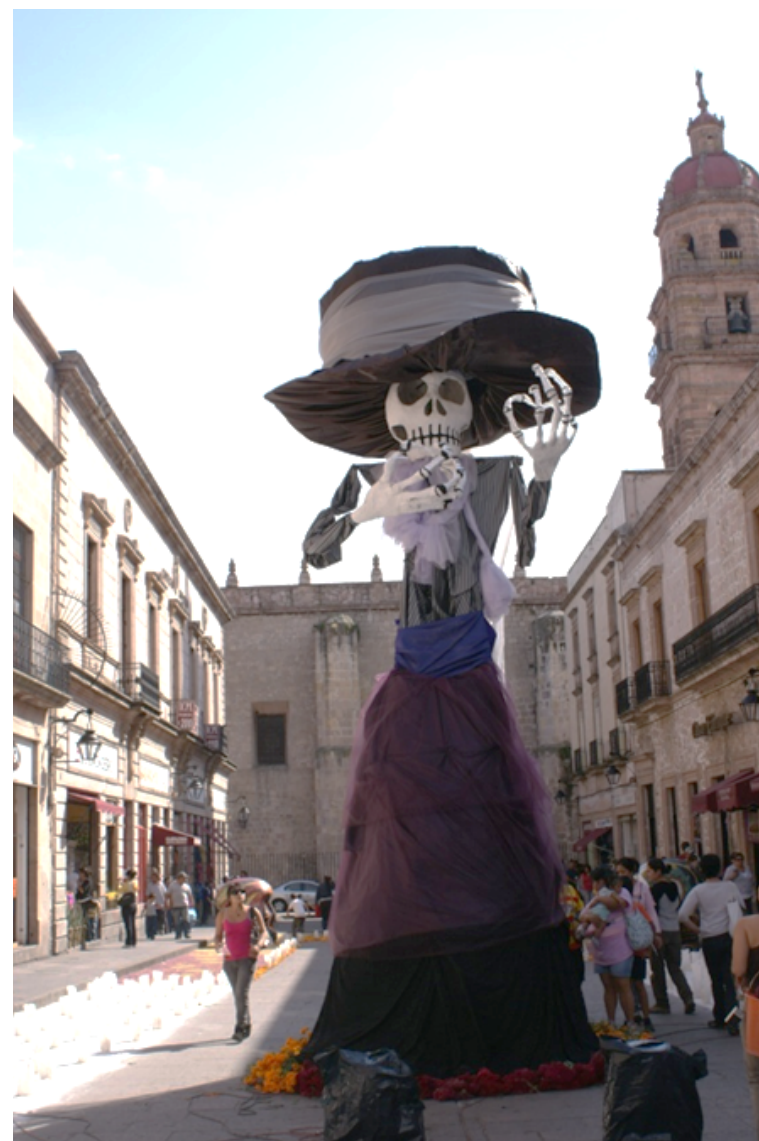
Figura 1. “La Catrina” en el Centro Histórico de Morelia.