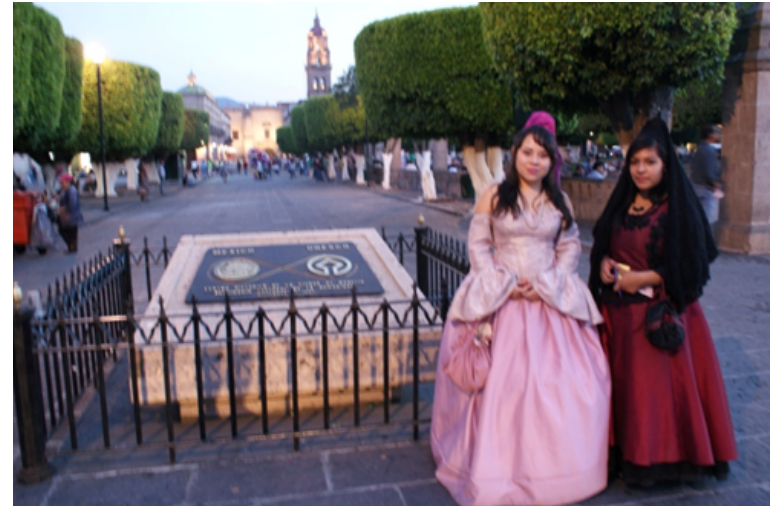
Figura 7. Personajes con atuendos de la época colonial en la placa conmemorativa por la designación del Centro Histórico de Morelia Patrimonio Mundial.