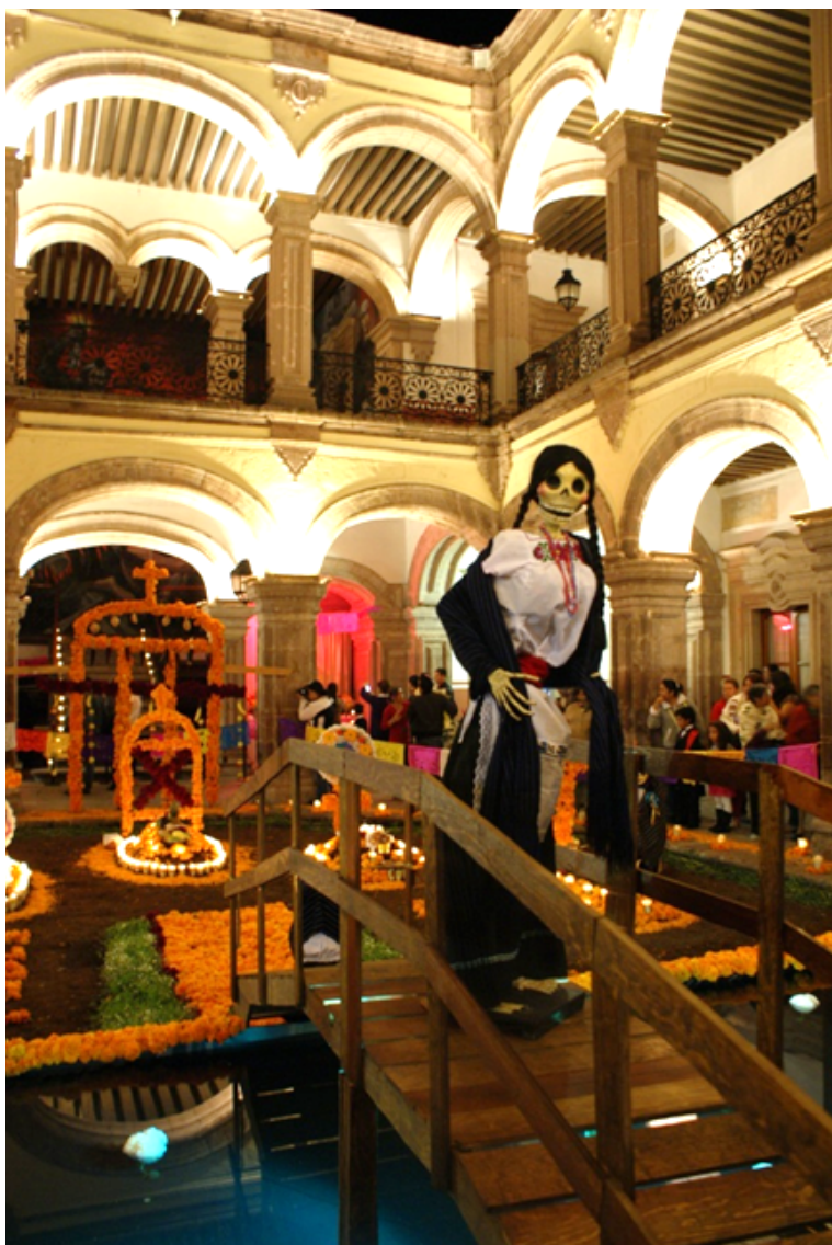
Figura 14. “Altar de Muertos” en el patio del Palacio Legislativo de Morelia. Fotografía de Carlos Hiriart, 2013.

complementar su oferta auténtica (40 monumentos y plazas; 20 espacios patrimoniales y casi 30 ferias y festivales al año [Alvarado, 2012: 279]) con una serie de atractivos teatralizados que se venden a los visitantes y a los consumidores locales de fin de semana.