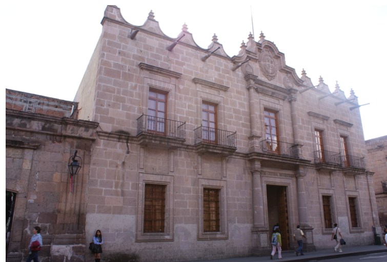
Figura 13. Centro Cultural Universitario (UMSNH), construido a finales de 1992. Fotografía de Carlos Hiriart, 2013.

del siglo XX, para acuñar una realidad estética simulada mediante el eslogan de ciudad de las canteras rosas. En fechas recientes la ciudad ha sumado, como “oferta de ocio cultural”, una gran cantidad de personajes ataviados con un falso estilo virreinal, o disfrazados de héroes de la Independencia que vivieron en la ciudad (Hidalgo, Morelos); además de diversos espectáculos en el espacio público personificados por juglares, danzas folclóricas y representaciones de altares de muertos que identificamos con mayor autenticidad o legitimidad con ciudades españolas como Salamanca, con las callejoneadas de Guanajuato, o con las tradiciones prehispánicas y mestizas de la cuenca del lago de Pátzcuaro, respectivamente.