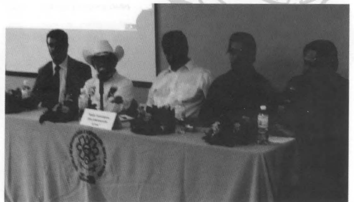
Presidium inauguración del Primer Congreso Internacional Carl Lumholtz.