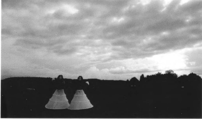
Presentación de performance "Maíz-crisálida" en el Primer Congreso Internacional Carl Lumholtz.