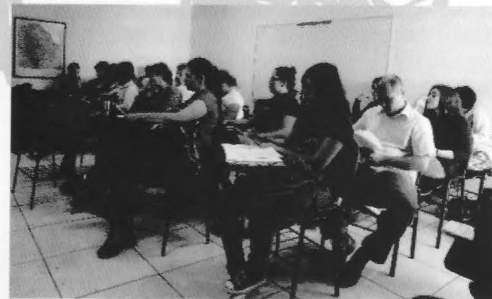
Asistentes a la plática "Ley de los derechos de los pueblos indígenas del estado de Chihuahua".