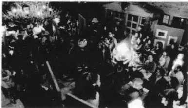
Exposición fotográfica: "Los oficios en el Norte de México".

Exposición fotográfica: "Los oficios en el Norte de México" compuesta de 41 fotografías que resultaron ganadoras en el concurso del mismo nombre, convocado por la EAHNM y cuyo objetivo fue: conocer, reconocer, promover y difundir las expresiones de los diversos oficios en el Norte de México.