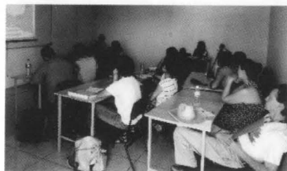
Plática: "La Polarización Maya-Mexicana en Chichén Itzá".