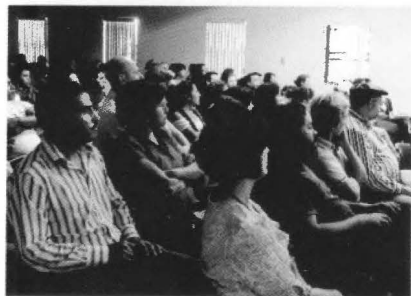
Asistentes al 1er Congreso Internacional Carl Lumholtz.

1er Congreso Internacional Carl Lumholtz "Los Nortes de México: culturas, geografías y temporalidades" , en donde se presentaron 6 conferencias magistrales, 254 expositores distribuidos en 49 mesas de trabajo, 3 presentaciones de libros y más de 450 asistentes nacionales y extranjeros.