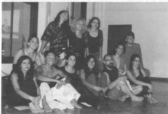
Participantes del "Performance Arts Seminario"