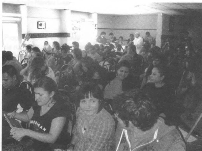
Asistentes a la conferencia "El sueño de la razón produce monstruos. Anomalía y Evolución del Siglo XIX.