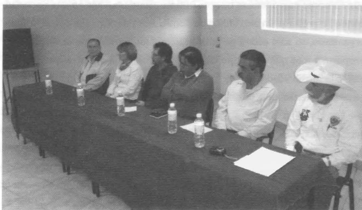
Presidium inauguración foro "Antropología de los Recursos Naturales: Agua y Bosque en la Sierra Tarahumara".

Foro en el que participaron diversas instituciones como la CONAFOR, el Instituto de Ecología A.C. (INECOL), la fundación Tarahumara "José A. Llaguno", la Secretaría de Desarrollo Forestal, la Junta Municipal de Agua y Saneamiento (JAMS), la Comisión Nacional para el Derecho de los Pueblos Indígenas, Comisión Nacional de Áreas Naturales Protegidas (CONANP) y el Centro de Desarrollo Alternativo Indígena, A.C. (CEDAIN). El objetivo del foro fue analizar las diferentes problemáticas ambientales a nivel sociocultural por las que atraviesa actualmente la Sierra Tarahumara y proponer nuevas alternativas a dichas problemáticas. La organización de este evento corrió a cargo de la Subdirección de Difusión, Vinculación y Extensión de la EAHNM en colaboración con la EAHNM en Creel.