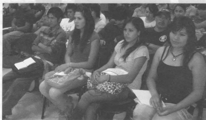
Asistentes foro "Antropología de los Recursos Naturales: Agua y Bosque en la Sierra Tarahumara".