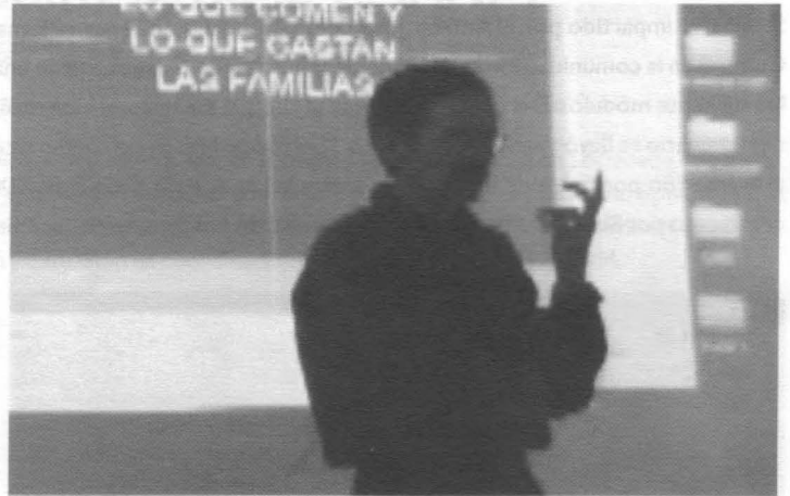
Curso de Fotografía Antropológica.