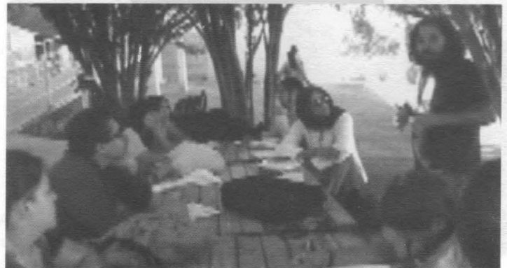
Curso Antropología Marxista.