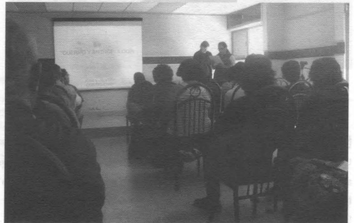
Conferencia "Los Paradigmas del Cuerpo en la Antropología Física".