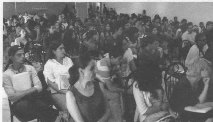
Conferencia Investigación Social en el Norte de México.