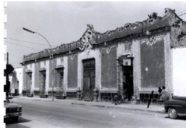
Figura 2. Vista general desde el poniente. Coordinación Nacional de Monumentos-INAH

Otro de los factores en contra de la entonces capital era el deficiente sistema de comunicaciones: para llegar a la ciudad había que hacer un enorme recorrido bordeando el lago de Texcoco, y pese a que había algunos canales que hacían más rápido el recorrido, constantemente se prohibía el tránsito por ellos o se clausuraban debido a que rompían los albarradones y propiciaban las inundaciones de la Ciudad de México. Esto ocasionó que se construyera un canal para trasladarse a aquélla, el cual pasaría por Chalco, Xochimilco e Iztapalapa. Además, aunque se inició la instalación de una fábrica de tabaco aprovechando, principalmente, el monopolio que tenía el Estado y que le permitía mayores ingresos, entre 1824 y 1829 dejó de percibirlos, lo que perjudicó a la naciente capital. Los debates realizados en la “Casa del Constituyente” respecto de estos inconvenientes, no menores, reflejan las razones por las que Texcoco no fue más la cabecera del estado de México.