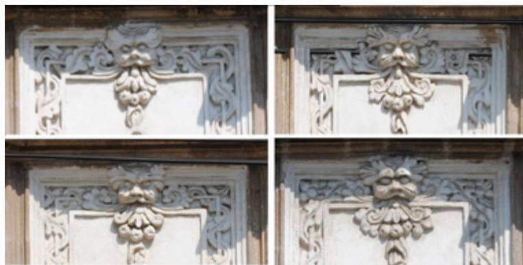
Figura 7. Estaciones del año.

Las estaciones del año: Cuatro balcones son, en la representación calendárica, las cuatro estaciones del año, que aquí están simbolizadas por la imagen fitoantropomorfa de la que brotan dos cornamentas en forma de ramas y hojas; todas tienen diferentes tipos de hoja: la primera de ellas, abundantes y apretadas (primavera); en la segunda están más abiertas y cuelgan a los costados (verano); en la tercera están hacia arriba, y las ramas son más visibles (otoño), y en la cuarta éstas son prominentes, y las hojas están totalmente apretadas y vistas de costado (invierno). Del labio inferior se desprenden cuatro vírgulas floreadas y, en el centro, con tres hojas, se aprecia la forma de la letra eme, que sostiene sendos frutos, en referencia a María y el fruto y la semilla sagrados, representados por la Trinidad; finalmente, en la parte inferior se encuentra colgando una manta, señal de dignidad superior.