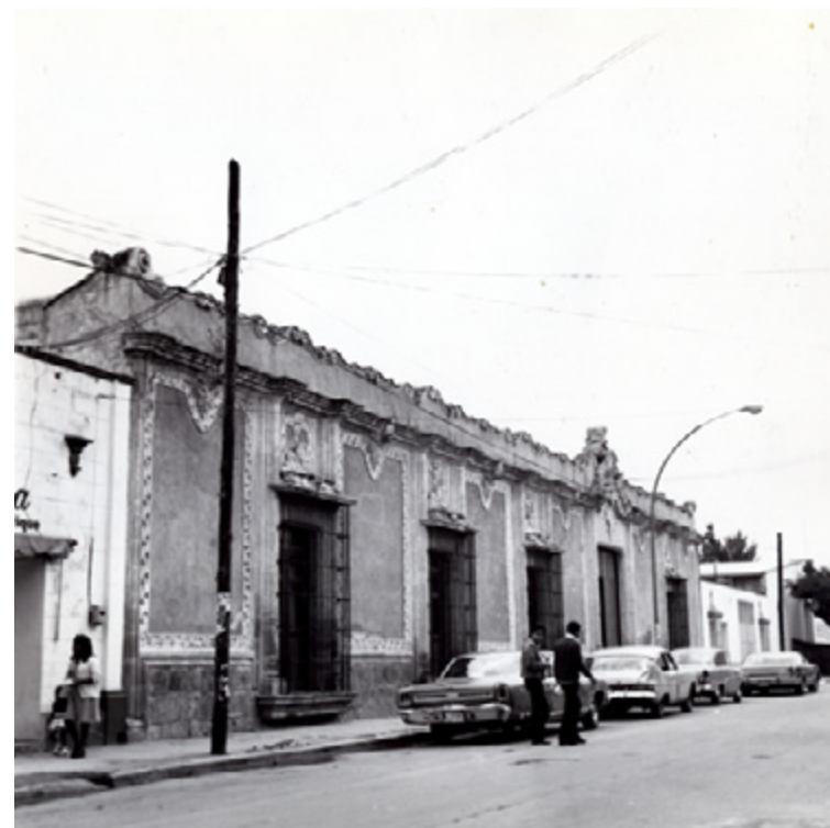
Figura 3. Vista general desde el oriente.

Quizá la etapa más triste de este inmueble fue cuando fungió como morgue, resultado de las diversas intervenciones de grupos de zapatistas y bandidos, como una de las ocurridas en Texcoco —debido a que era un punto que se encontraba de paso hacia la Ciudad de México—, en noviembre de 1913: