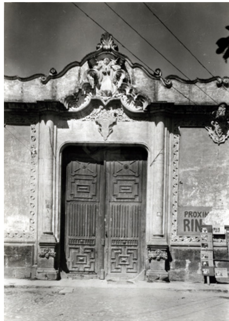
Figura 1. Puerta de acceso.

de Texcoco (entre las que se encontraban los nacientes diocesanos), ya que estaban en pésimas condiciones y desatendidos; la casa llegó a ser, así, parte del hospital de Nuestra Señora de los Desamparados.