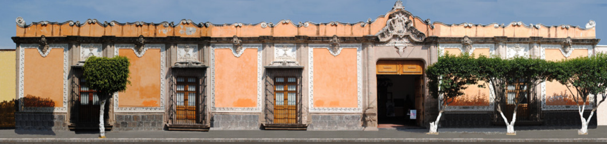
Figura 4. Fachada principal.

ese tiempo: Venus, Marte, Júpiter, Mercurio, Saturno y Neptuno.