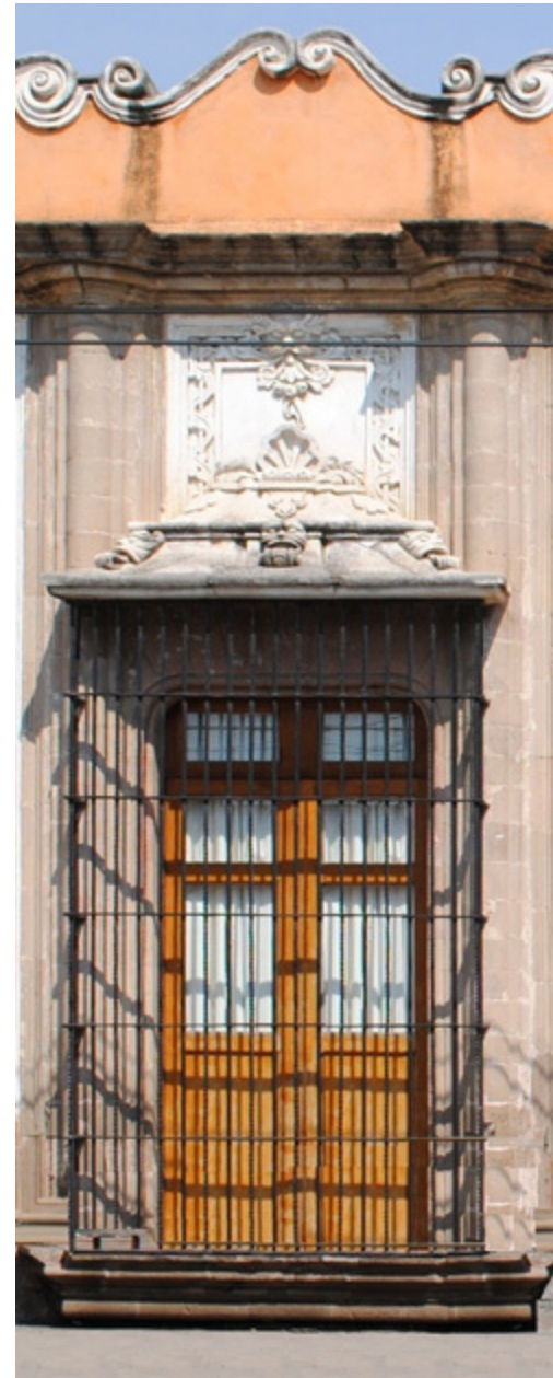
Figura 6. Balcón.

Indudablemente, el simbolismo del agua estará relacionado con la generación de la vida y la fecundidad, así como con la purificación y la sabiduría, la cual obtenemos mediante la limpieza del espíritu y el cuerpo. El agua está relacionada, tanto en el Antiguo