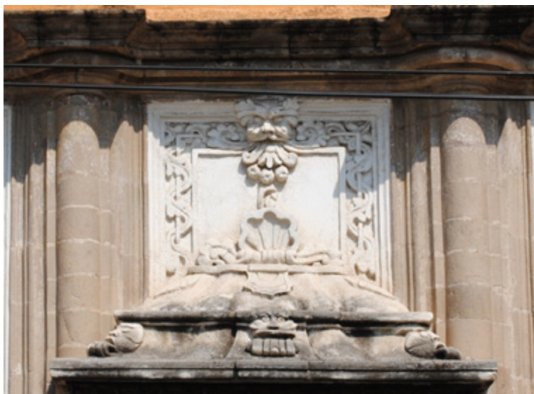
Figura 13. Primavera.

del pretil, en el que los roleos representan las olas del mar—: las que se encuentran en la parte superior de los balcones, los dos caracoles cortados por la mitad en la hornacina de la puerta de acceso, la concha que remata la fachada en la parte superior (antefija o acrotera), también de estos elementos, y la concha que se encuentra al centro de la guardamalleta, del mismo elemento. Todas estas representaciones hacen referencia principalmente a la Virgen. Tomando en cuenta que parte del simbolismo e iconografía de Venus se utilizó para el de María, encontramos una relación directa con el agua —la concha marina y el caracol, presentes en cada uno de los elementos de la portada—, así como con los personajes y su relación con la Luna.