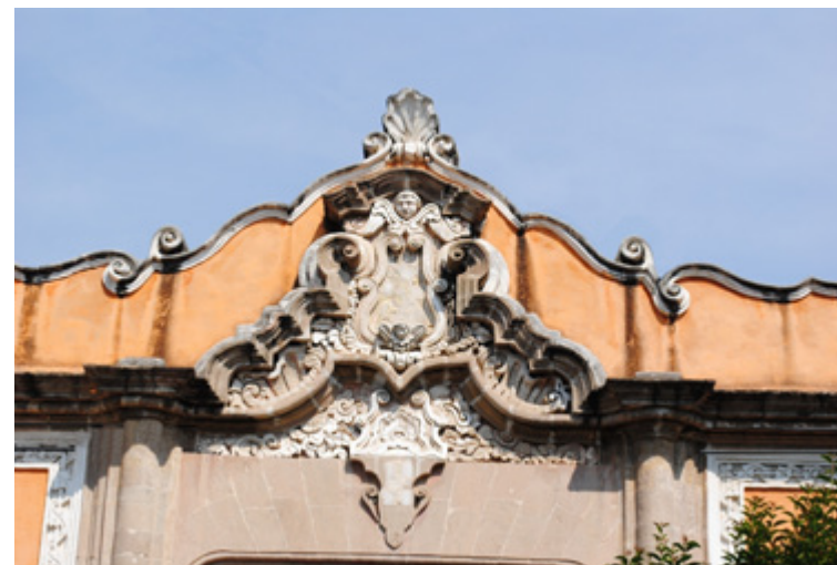
Figura 8. Hornacina.

El abril: Un portón ubicado entre el cuarto y el quinto macizos, es decir, entre abril —mes en el que se abre el abril (abrileno), es decir, la época en que los campos se cubren de