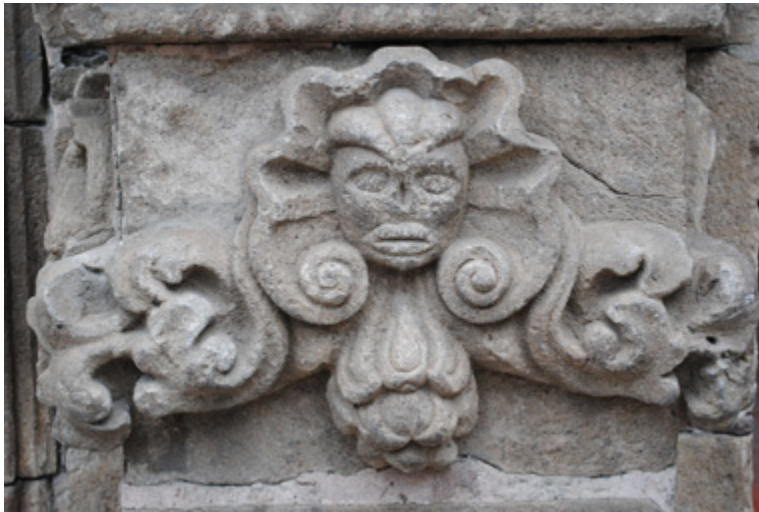
Figura 17. Alegoría de María.

La unión española-indígena: En la hornacina de la fachada se aprecian dos elementos importantes que marcan al siglo XVIII (época de la construcción de la portada): del lado derecho, la imagen de un español, de cuya boca se desprende la vírgula del habla y, del izquierdo, la imagen de un indígena con los mismos elementos.