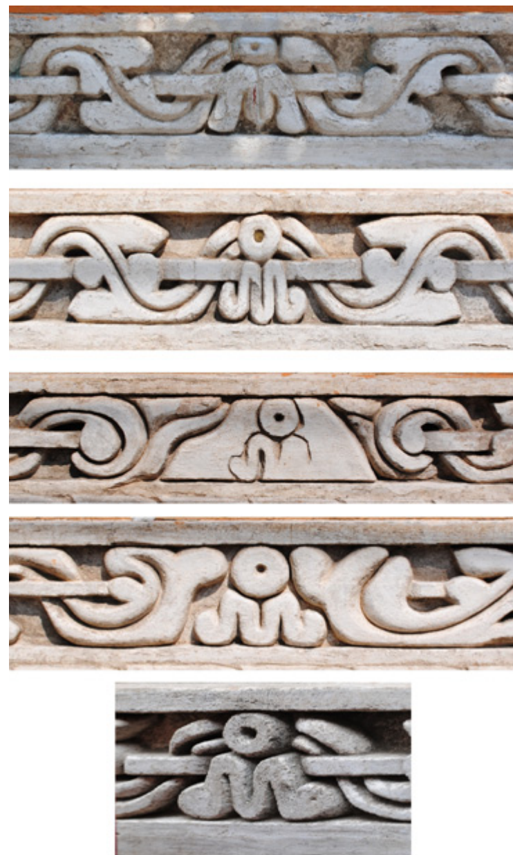
Figura 9. Monograma.

Por otro lado, vale resaltar que en la parte superior de los balcones destacan tres elementos: por un lado, la concha, so-