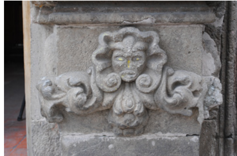
Figura 18. Alegoría de Jesús.