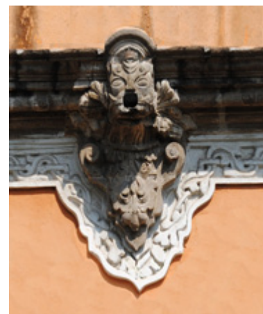
Figura 5. Gárgola.

decoración vegetal se relaciona con la fertilidad, mas la aparición de tres granadas tiernas de pequeñas dimensiones, que se asocian con la estructura interna de las semillas, así como con el adecuado ajuste de lo múltiple y diverso en el seno de la unidad aparente: la concordia, la humildad y el pontificado, eventualmente corresponderían con otra lectura simbólica: en la Biblia aparecen como símbolo de la unidad del universo en la unión de la Iglesia, representación, asimismo, de la fertilidad, símbolo utilizado por las Órdenes hospitalarias.