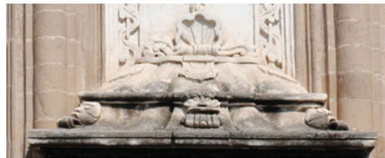
Figura 12. Hornacina.

La relación de la Virgen con las fases lunares es importante; en una de las esquinas del inmueble se encuentra una flor de azahar, la cual representa la virginidad, la pureza, la castidad, la fecundidad, el conocimiento y la redención, emblemas de la Virgen María. El lugar que ocupa esta flor es el día 7, es decir, cuarto menguante o cuarto creciente.