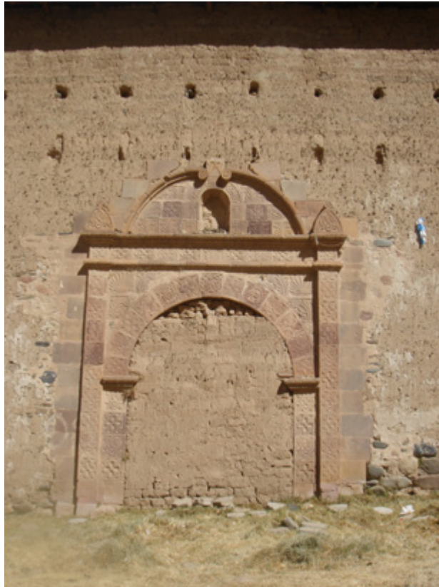
Figura 7. Vista de la portada lateral