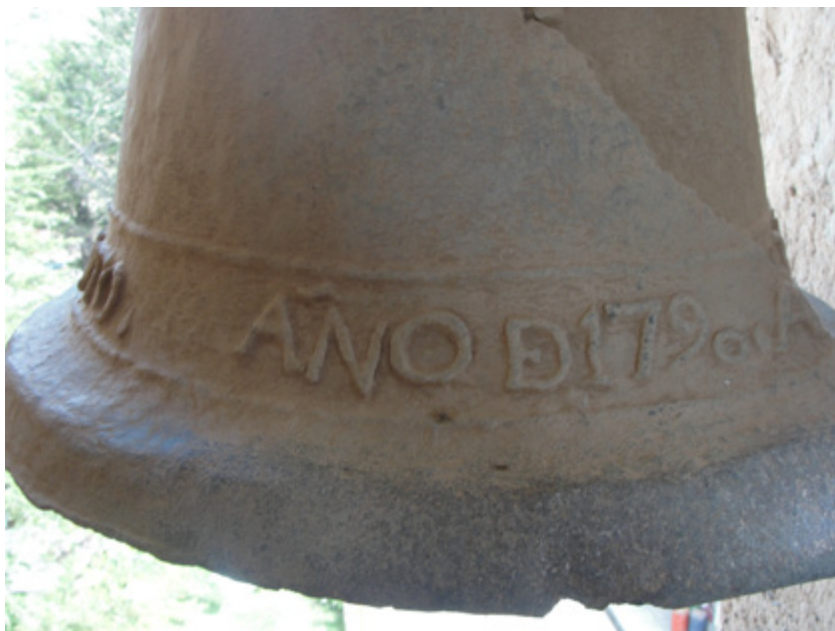
9. Vista de la inscripción de la campana

En relación con los elementos ornamentales y decorativos al interior del templo, se pueden identificar y describir los siguientes: el retablo mayor, si bien no es el original, presenta elementos arquitectónicos y artísticos que deben conservarse: allí se puede identificar el uso de elementos y formas de la arquitectura neogótica. Otro elemento importante, por la manufactura, el material y los elementos iconográficos, es el púlpito tallado en madera, que se encuentra adosado a la estructura de piedra del arco triunfal.