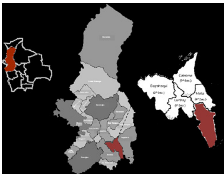
Figura 1. Localización geográfica

La región se caracteriza por su relieve montañoso, típico de cabecera de valle. Su clima es templado, con una temperatura promedio anual de 17 °C. La presencia de distintos pisos ecológicos permite una diversificación de la producción —lo que constituye una ventaja para el desarrollo del municipio—, donde la agricultura, la ganadería y la minería son las actividades más importantes. La población es de origen aimara, y este idioma, después del castellano, el más hablado. Su organización política y social corresponde a sindicatos agrarios, centrales y subcentrales (Quiroga 2000:119).