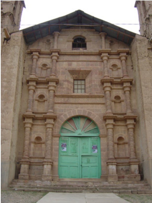
Figura 6. Vista de la portada principal