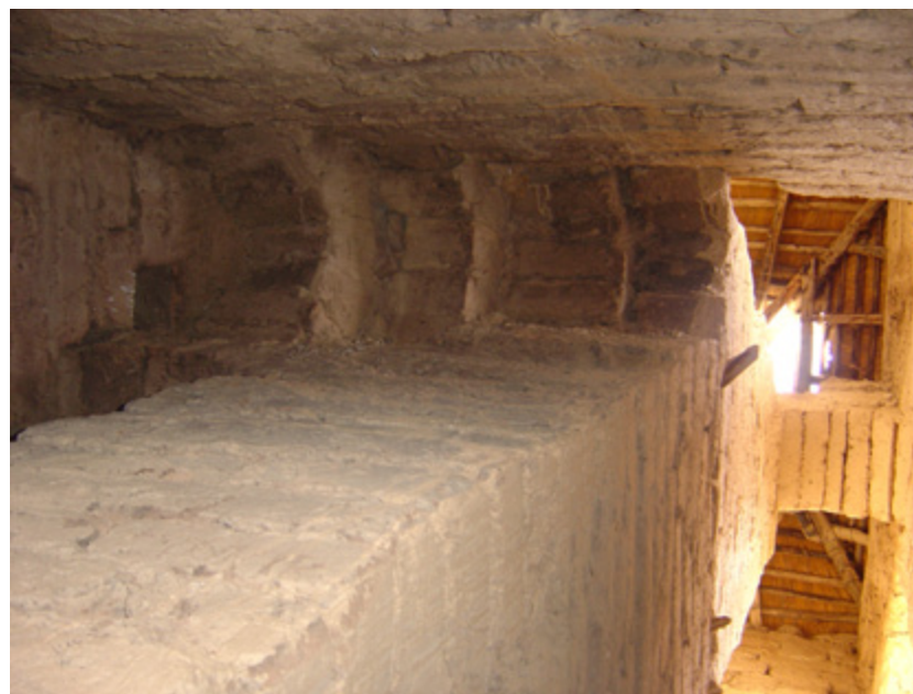
10. Vista del sistema constructivo de las torres

Respecto de la iconografía, se puede determinar el uso de un mismo lenguaje gráfico: en la portada principal, los retablos laterales y el púlpito se identifican los mismos iconos. Dentro de estos elementos podemos mencionar: racimos de uva, follaje, flores cuádrupétalas, jarrones con flores y ramas, ángeles, figuras antropomorfas; sin embargo, el dato más interesante está en re-