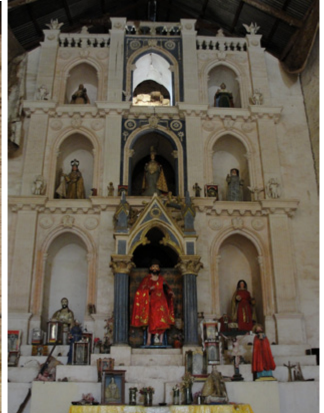
Figura 8. Vista del retablo mayor