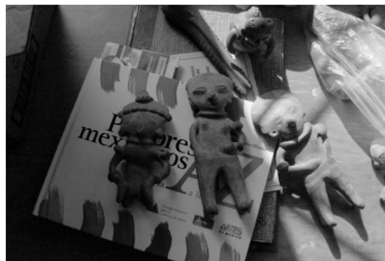
Figura 3. Parte de las piezas sustraídas del museo comunitario de Sentispac.

El presidente de la JV se observa apesadumbrado, las piezas que sustrajeron eran las que había donado un profesor, y ese acto filantrópico del maestro era interpretado por Alfonso en un doble sentido: por un lado, en cuanto a la calidad estética del material y su óptimo estado de conservación y, por el otro, porque contribuiría a que un verdadero coleccionista local se fuera convenciendo de la relevancia de donar su colección arqueológica al museo, toda vez que la idea de éste era la venta del acervo. Al parecer, la reventa de material arqueológico no es un hecho aislado, sino más bien sistémico. Uno de los arqueólogos del Centro INAH-Nayarit advierte que en el último lustro se ha incrementado el saqueo arqueológico tributario del “auge del turismo extranjero en la Riviera Nayarit y es que ahora, los ejidatarios venden las piezas directamente al turista entre 500 y 5 000 pesos”. 34