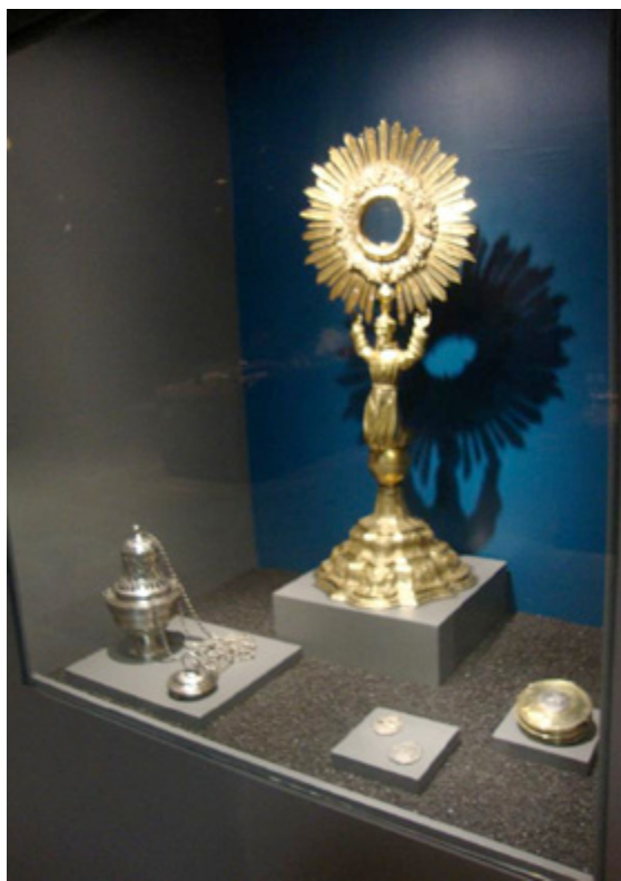
Figura 3. Nicho con solución museográfica y de conservación: carbón activado extendido

Los resultados en esta sede fueron realmente satisfactorios: la sulfuración fue mínima o nula y se evitó una nueva limpieza de las obras, además de lograr (que se logró) una integridad en el diseño museográfico, generando espacios de exhibición con el mínimo de impacto sobre las colecciones, con una ambientación que resaltaba las características estéticas de las piezas gracias al contraste del brillo y lisura de las obras de la plata contra el color negro y la textura rugosa del carbón activado. Es decir, en conjunto obtuvimos la exhibición mejor lograda de todas las sedes.