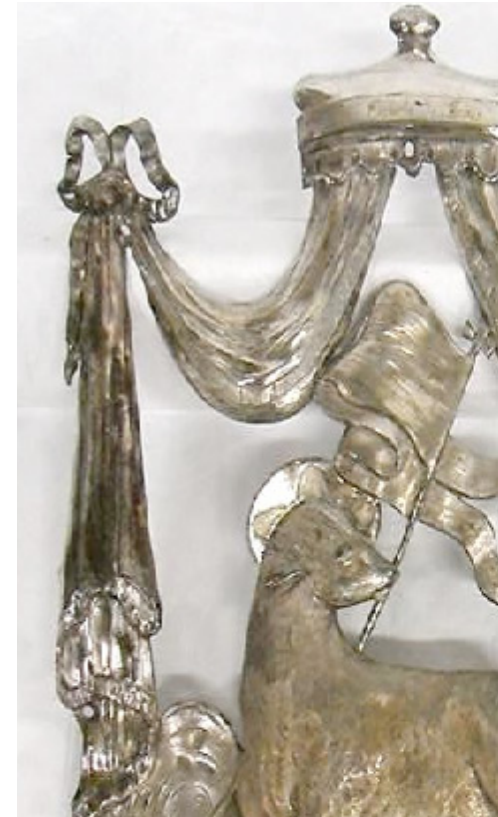
Fig. 2 Acercamiento a sulfuración en dos niveles, MNV