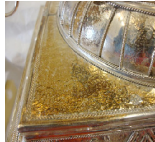
Figura 1. Avance de sulfuros en color amarillo-café, MAHG

Los primeros sulfuros de plata forman una película, casi invisible, de color amarillo-marrón que, al aumentar su espesor entre 10 nm y 100 nm, adquiere un color que va del café al violeta iridiscente, y cuando alcanza 1 \mu\text{m} , se vuelve gris-negro.