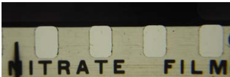
Figura 2. Película con soporte de nitrato.

Acetato de celulosa. Los acetatos de celulosa fueron materiales que sustituyeron a las películas con soporte de nitrato. Se fabricaban haciendo una mezcla de celulosa en ácido acético y sulfúrico. Su identificación respecto de otros soportes se da porque lleva la leyenda “Safety film” en las orillas, por su tipo de deterioro químico y por una prueba de flotación.