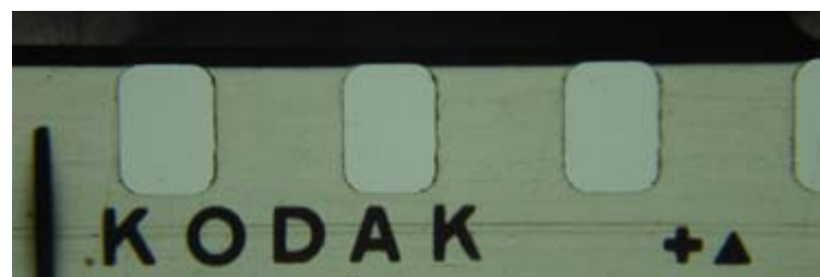
Figura 3. Marca marginal en película Kodak.

Identificación de marcas marginales. Es un código formado por una serie de letras, números y, en algunos casos, símbolos, impreso en la película, que nos ayudará a conocer el tipo de stock usado y a datarla, en caso de no conocer la fecha de realización del filme. (Fig. 3)