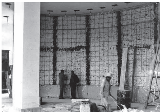
Material de registro de la Fototeca del MNH

del PRI, lo que nos habla de la inclinación política del pintor (Luna Arroyo, 1973: 232).