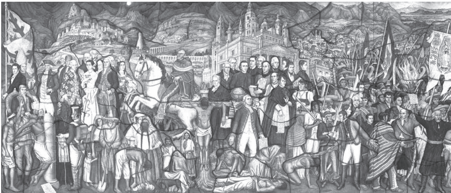
Registro de las distintas tareas

O’Gorman utilizó la técnica al fresco, la cual consiste en una pintura hecha sobre una capa húmeda, de tal manera que los pigmentos son fijados por la carbonatación de la cal (hidróxido de calcio) contenida en la capa de preparación. 2