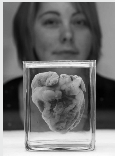
Jennifer Sutton Fotografía © Wellcome Library London