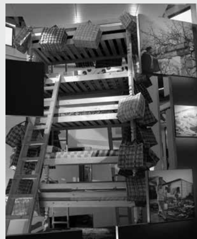
Aspecto de la Cité Nationale