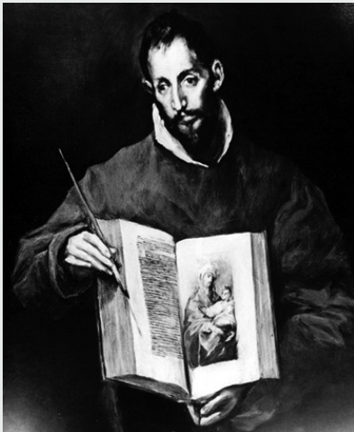
San Lucas, del Greco