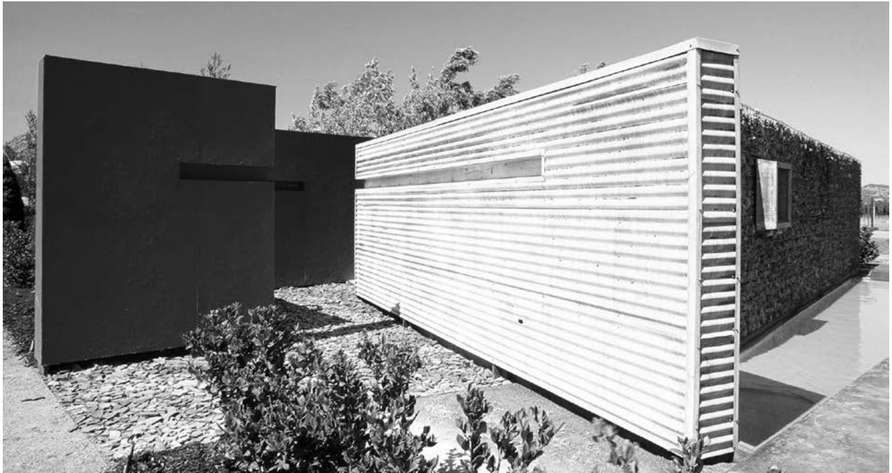
gdu Cornerstone Gardens