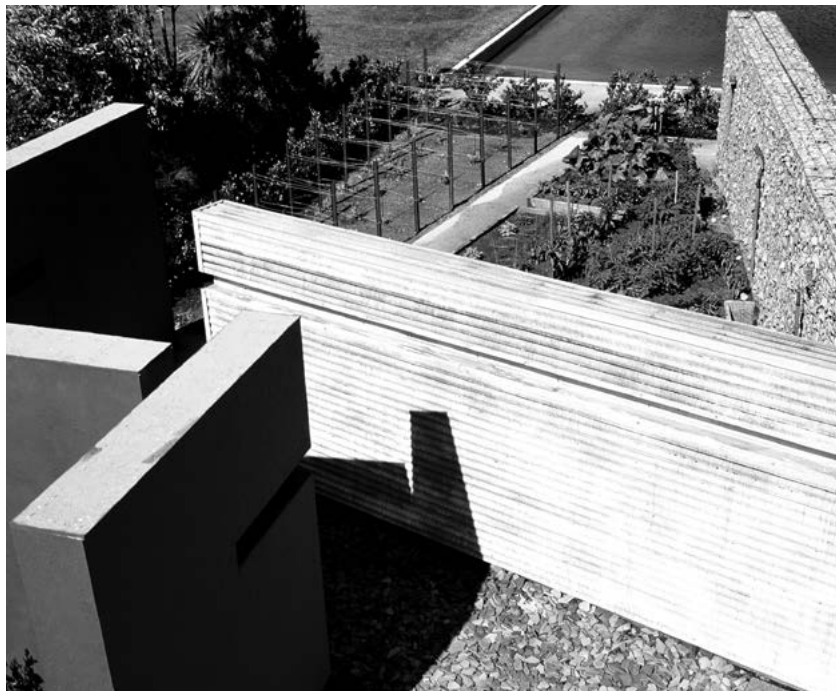
60U Cornerstone Gardens

Lacouture, Felipe, El Centro de Investigación, Documentación e Información Museológica de la Coordinación Nacional de Museos y Exposiciones , folleto, México, CNME-INAH, 1995