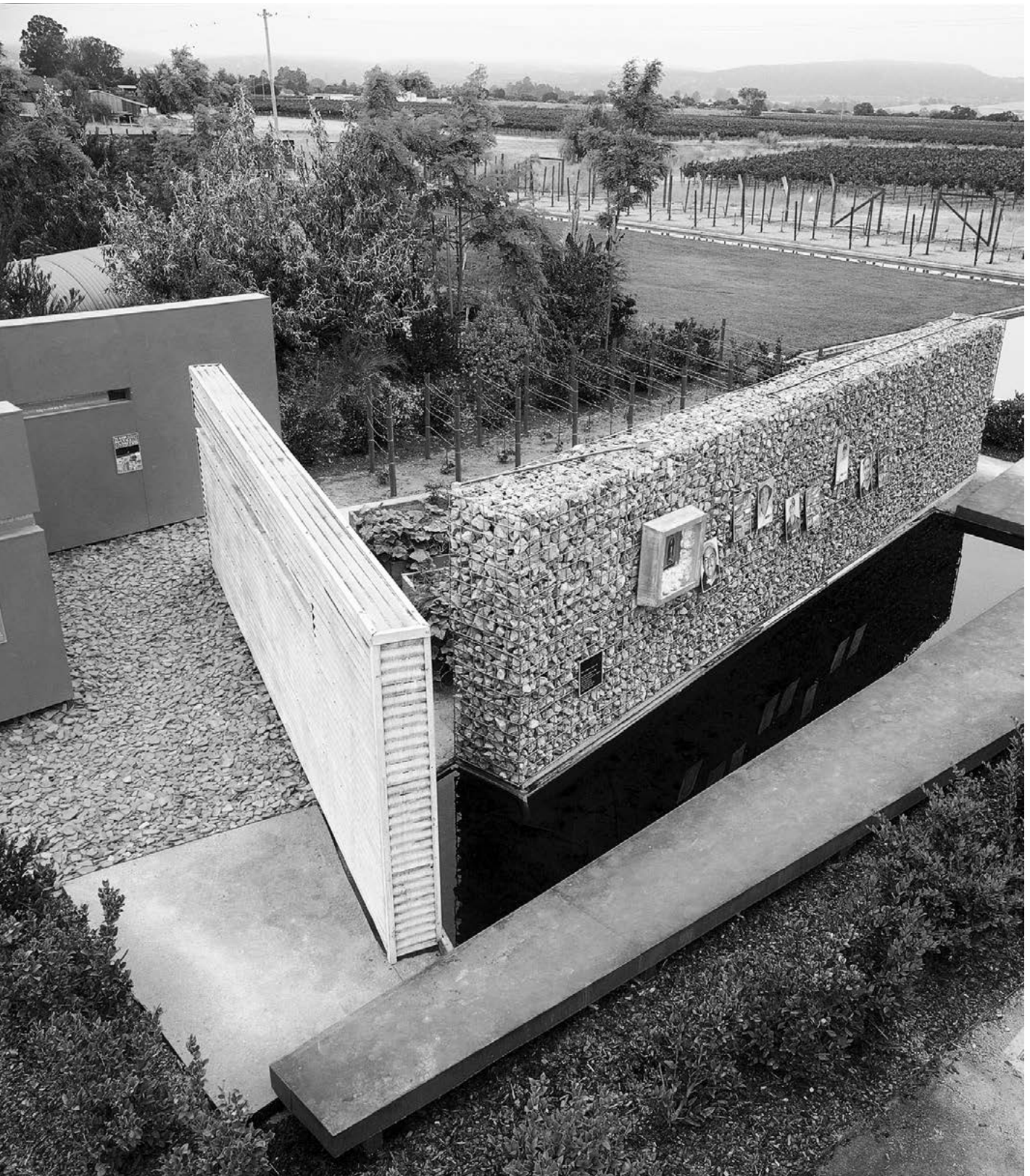
60 Cornerstone Gardens