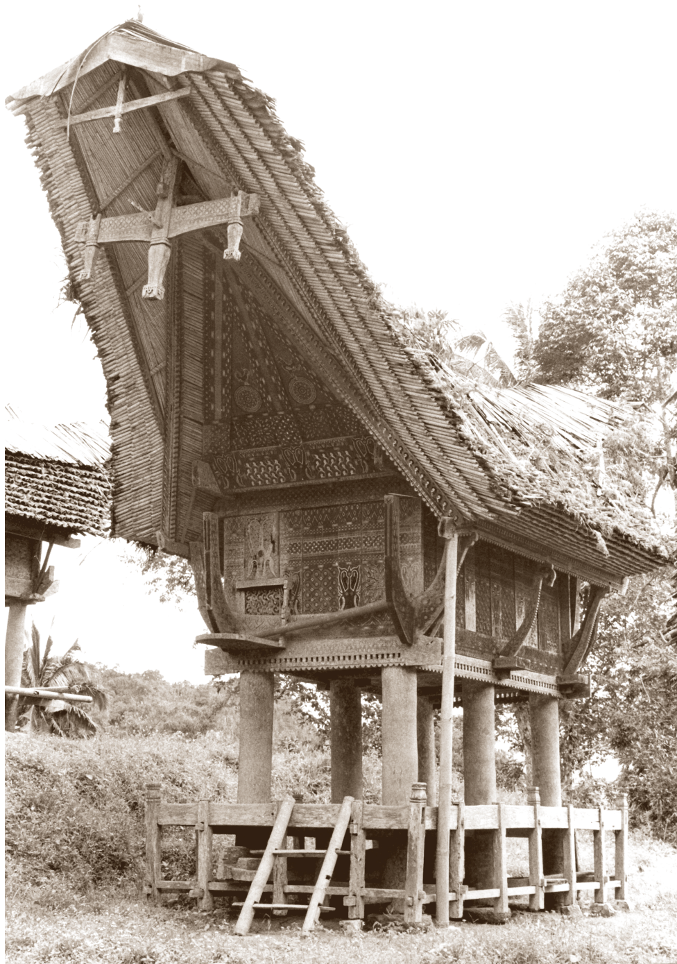
Granero de arroz Sa'dan-Toraja, pueblo Sallabayo, Sulawesi, Indonesia, siglo xx