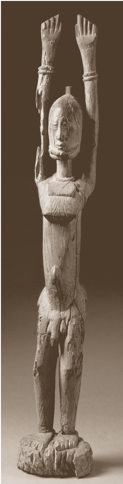
Figura masculina, región de Dogon-Tintam, Mali, África

to artístico es una costumbre occidental, por lo que, en contraste con los museos de arte, el MRJ proporcionará información de contexto. En este núcleo el acervo se expondrá en exhibiciones temporales.