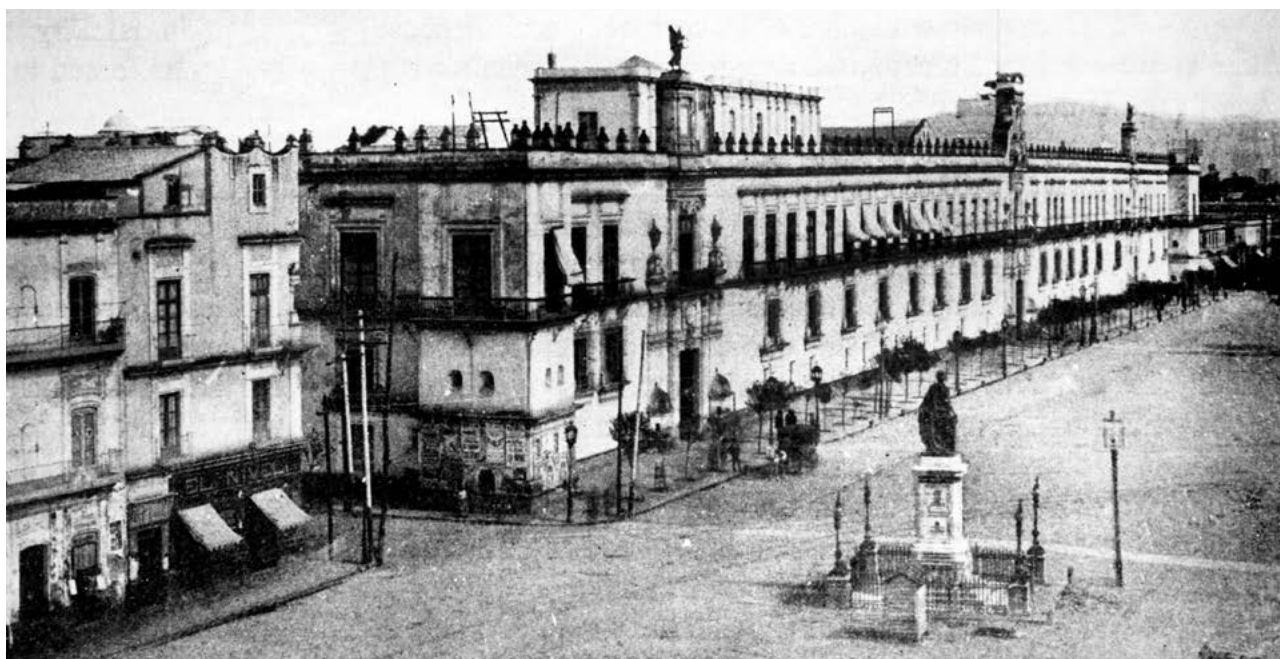
Calle de Moneda, Museo Nacional Fotografía © Fototeca Constantino Reyes-Valerio de la CNMH-CONACULTA-INAH-MEX:0019-85