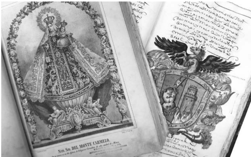
Libro de tributos del marquesado del valle de Oaxaca, Sermonario en lengua náhuatl y Evangelario en lengua zoque

dió más tarde en los siguientes fondos: Franciscano, Hospital Real de Naturales, Colegio de San Gregorio y Escuela Nacional de Agricultura. En la actualidad, el AHBNAH cuenta con 68 colecciones documentales que comprenden desde el siglo xv hasta el xx.