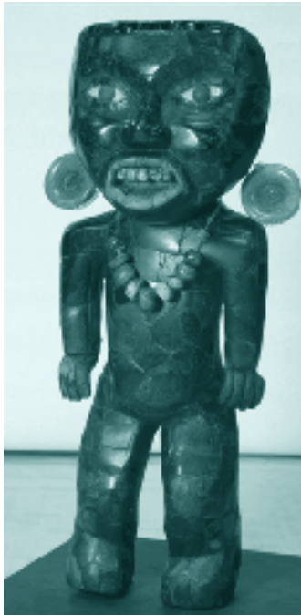
Figurilla en piedra verde