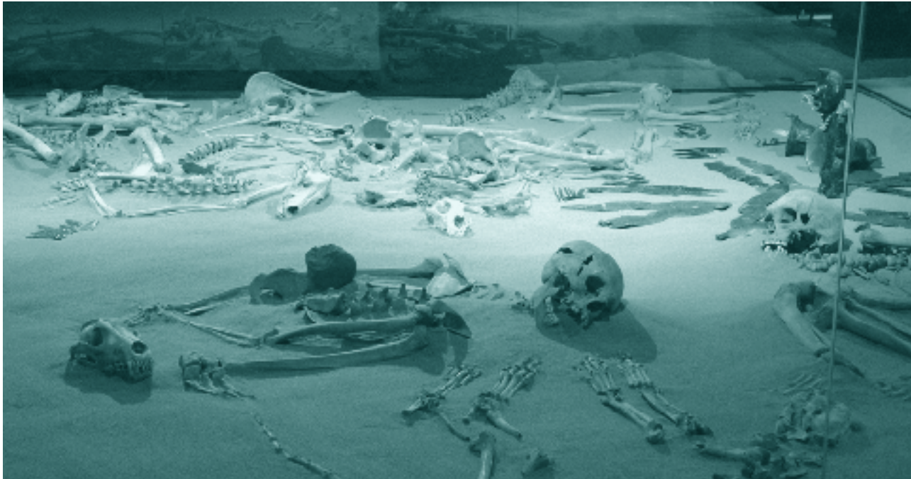
Reconstrucción de entierro