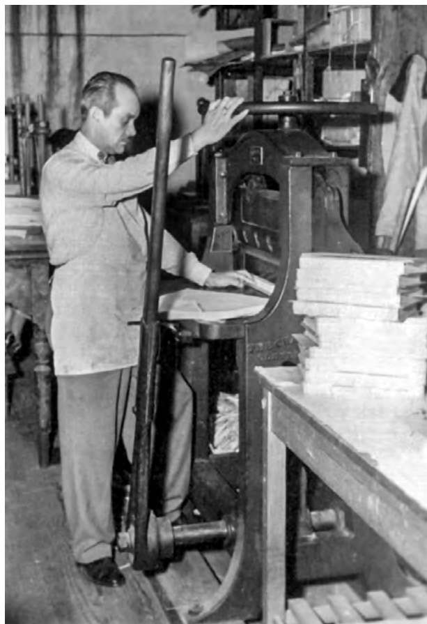
Taller de encuadernación, ca. 1965 Fotografía © Fototeca Constantino Reyes-Valerio, CNMH-INAH-Conaculta, MEX.PERSONAJES:0539-063

“Noticia histórica sobre la Imprenta del Museo Nacional de Arqueología, Historia y Etnografía. En su cincuentenario”, en Archivo Histórico Institucional (AHI), México, INAH, sec. 8, vol. 12, exp. 216, 1937.