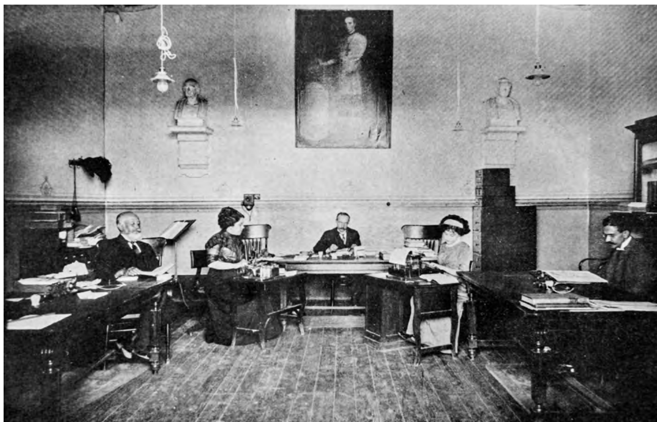
Departamento de Publicaciones, Boletín del Museo Nacional de Arqueología, Historia y Etnología , t. I, enero de 1912

La manera de difundir el conocimiento generado –ya fuera en los recorridos por las salas, en las clases, conferencias y en la transmisión impresa– se combinó con un verdadero gusto por los libros. Esto resulta evidente al conocer la trayectoria de sus empleados, como Juan Bautista Iguíniz, quien llegó a ser uno de los más importantes bibliófilos del país y se desempeñó como ayudante de la imprenta y de la clase de historia ( Boletín del Museo Nacional , 1913: 218). Como parte del vigésimo quinto aniversario del taller de Imprenta, Iguíniz sacó a la luz Las publicaciones del Museo Nacional de Arqueología, Historia y Etnología. Apuntes histórico-bibliográficos ( ibidem , 1911). 6 Ese año fue muy particular y de auténtica bonanza para la imprenta, pues además de publicar un total de 208 obras, editó los libros de la Secretaría de Instrucción Pública y Bellas Artes, así como de otras instituciones, y el segundo tomo de la obra inédita Diario histórico de México , de Carlos María Bustamante, realizado