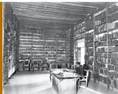
Fotografía © Fototeca Constantino Reyes-Valerio, CNMH-INAH: sn_folio 79