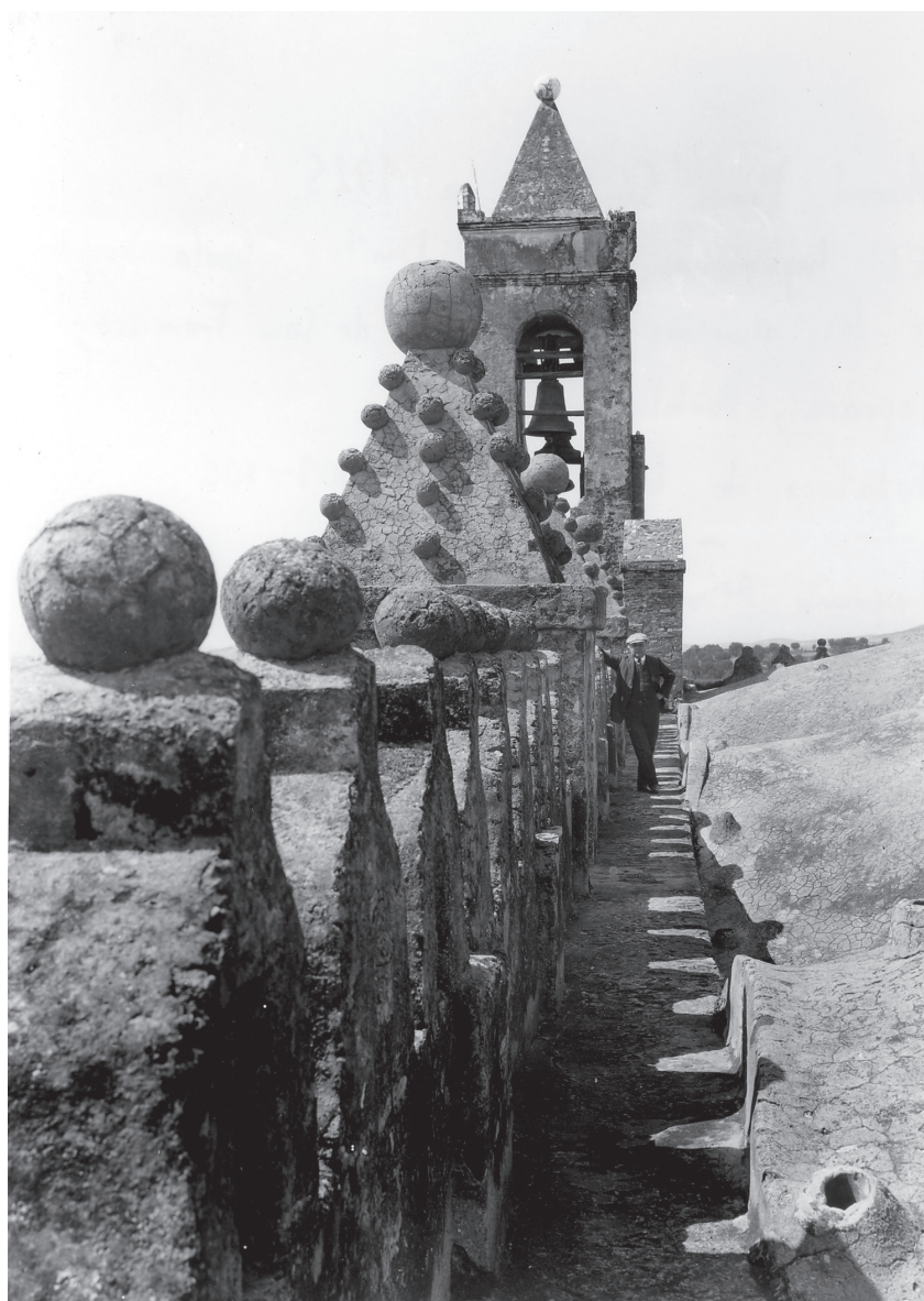
Templo de San Francisco Tepeaca, Puebla