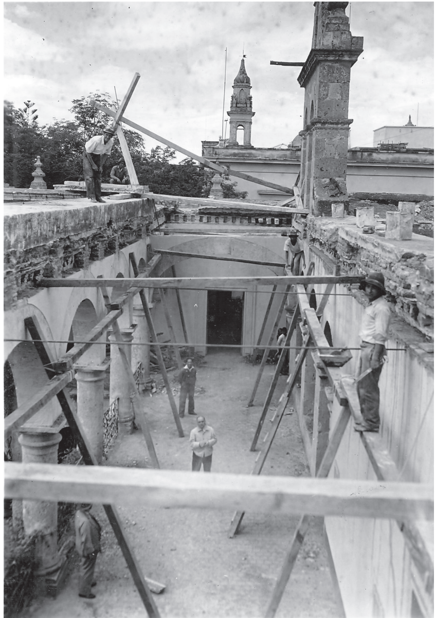
Museo Regional de Guadalajara

En su labor de reconstrucción de inmuebles artísticos o históricos es posible apreciar su preocupación por conservar la estructura original de los edificios, para lo cual abrió ventanas y puertas que habían sido tapiadas, quitó añadidos, levantó muros y techos demolidos. Sin embargo, con la finalidad de preservar a toda costa los elementos arquitectónicos que, debido al proceso de deterioro por aban-