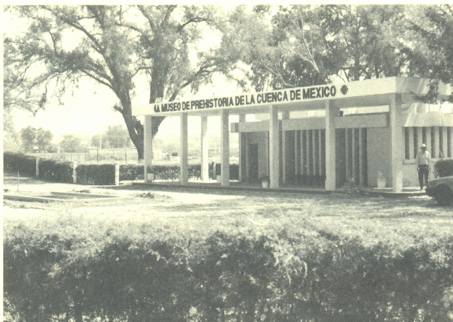
Museo de Prehistoria de la Cuenca de México.

museografía, mantenimiento, restauración y coordinación de los museos de Tepexpan, Acolman, Oxtotipac, Z.A. de Teotihuacan y Casa Morelos. Integración de talleres en las mismas áreas, aprovechando espacios ya existentes: