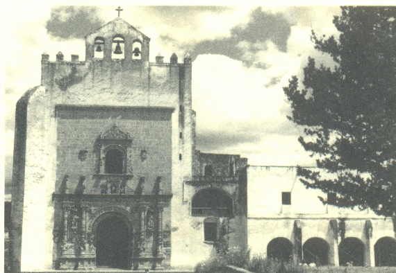
Ex-convento de San Agustín, Acolman. Foto: archivo CDM-INAH

3. El Museo Exconvento Agustino de Acolman. La historia de este monumento representante del estilo plateresco y de la arquitectura del siglo XVI, se publicó en el número anterior es por ello que no ahondaremos en este tema, sin embargo se puede mencionar que en la actualidad es considerado como uno de los museos más visitados en la República Mexicana, similar al Museo Nacional del Virreinato en Tepotzotlan. Las pinturas al fresco de la planta alta fueron descubiertas por el pintor Saldaña en el año de 1921, las obras de restauración se iniciaron en el año de 1922, principalmente desazolviendo el claustro chico y la fachada, estas obras y otras de restauración han continuado con pequeñas interrupciones por el Instituto Nacional de Antropología e Historia; en el año de 1933 fue declarado Monumento Nacional, hasta la fecha funciona como museo. Además de sus salas de exposiciones permanentes, cuenta con una sala de temporales en las que se han presentado: “Mujer Mazahua”, “Arte Plumarío”, “Vírgenes y Santas”, “Arte Chicano”, “La Sagrada Familia”... Este importante monumento fue sede del “Primer Encuentro de Museos en el Estado de México” proyecto del Centro INAH, Estado de México.