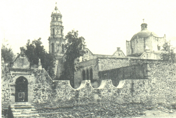
Ex-convento de San Nicolás Obispo, Oxtotipac.