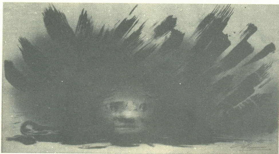
David Alfaro Siqueiros Ilustración para el Canto general de Pablo Neruda, 1968 Litografía a color 58.5 x 102.5 cm.

sendas obras, los muralistas mexicanos. Edición especial de 500 ejemplares numerados y autografiados por los tres artistas, que se agotó desde su publicación ya que fue una edición por suscripción que se distribuyó en todo el continente americano.