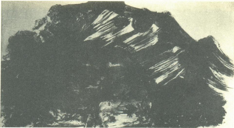
David Alfaro Siqueiros Ilustración para el Canto general de Pablo Neruda, 1968 Litografía a color 58.5 x 102.5 cm.