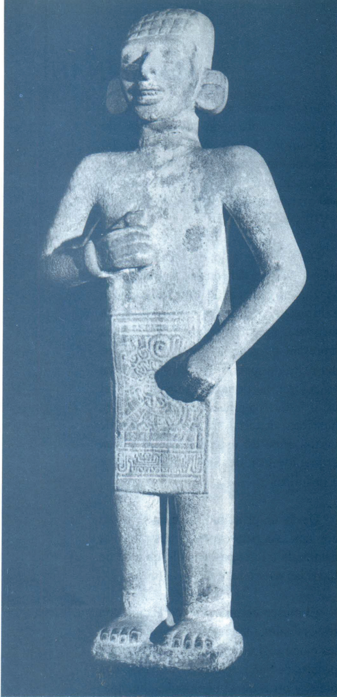
El adolescente del Tamuín. Vista frontal