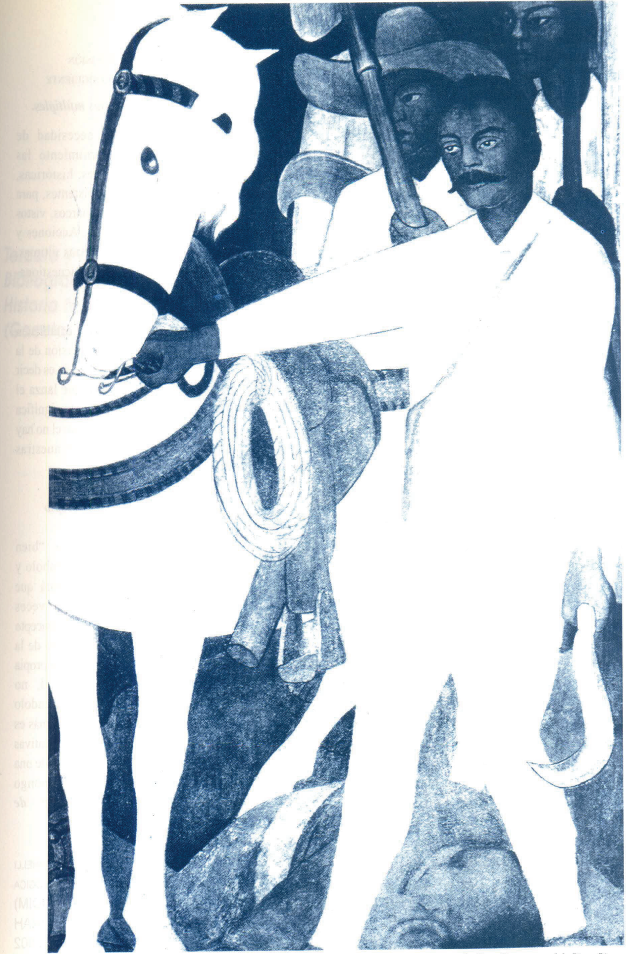
Emiliano Zapata, mural de Diego Rivera.