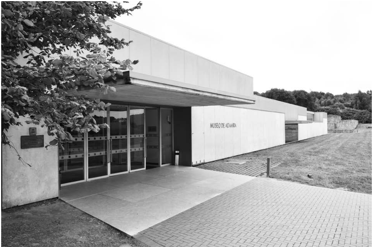
Museo Nacional y Centro de Investigación de Altamira, Ministerio de Cultura y Deporte de España. Entrada principal

ciervos, cabras, caballos y uros (Fatás y Lasheras, 2014: 30; Bahn, 2015: 110-115). Las técnicas empleadas son el dibujo, grabado y pintura, con pigmentos de carbón vegetal y óxidos de hierro.