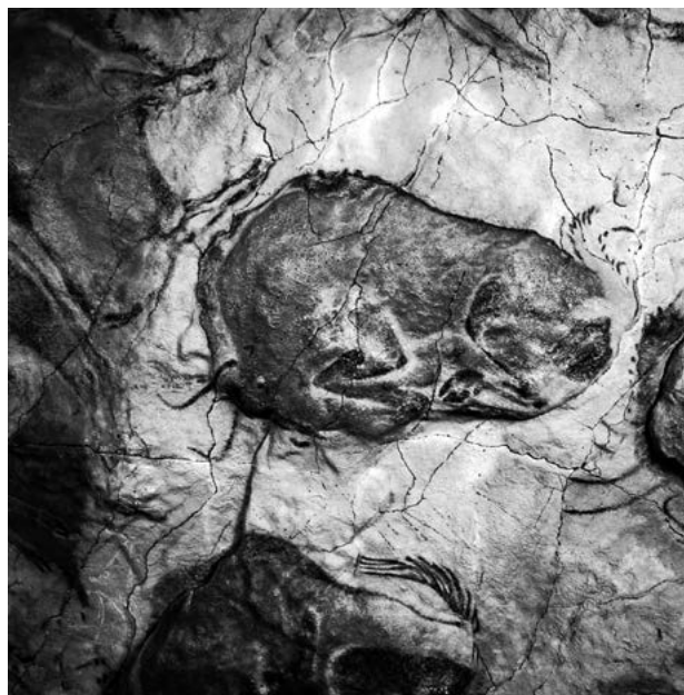
Museo Nacional y Centro de Investigación de Altamira, Ministerio de Cultura y Deporte de España. Neocueva. Bisonte recostado

La parte más espectacular y apreciada de esta cueva moderna es la reproducción facsimilar del gran techo policroma-