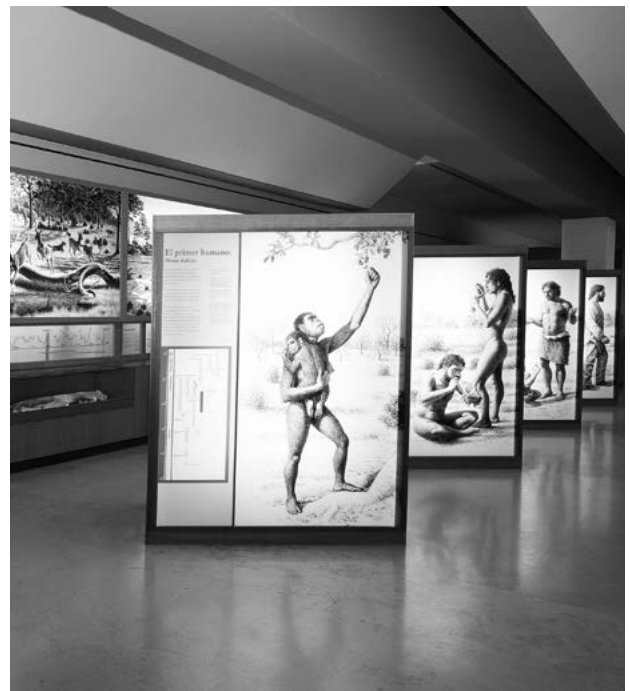
Museo Nacional y Centro de Investigación de Altamira, Ministerio de Cultura y Deporte de España. Exposición “Los Tiempos de Altamira”, Hominidos

Los cierres de la cueva, aunque plenamente justificados, han sido recibidos como contrariedades por algunos sectores que han considerado que con esto se afectan sus actividades econó-