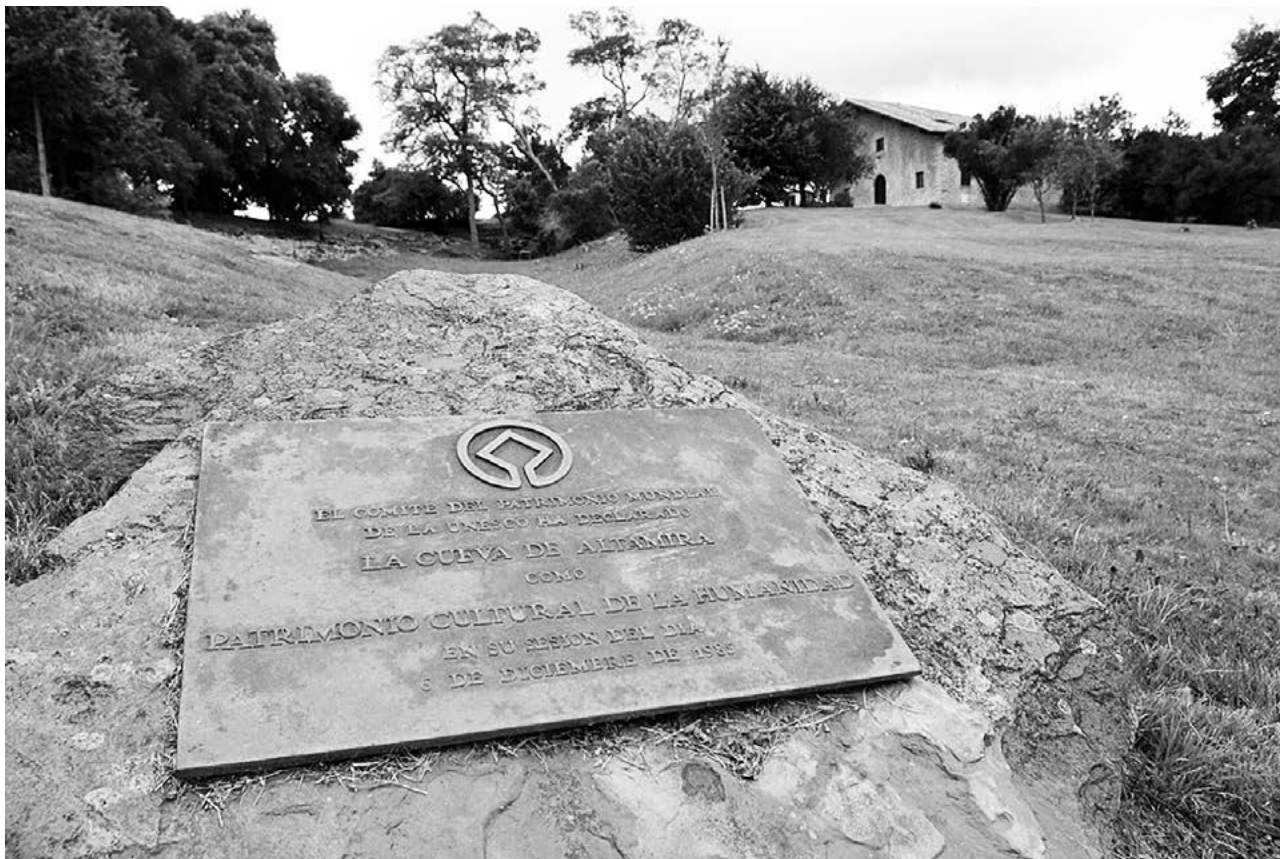
Museo Nacional y Centro de Investigación de Altamira, Ministerio de Cultura y Deporte de España. Parque, placa Patrimonio Mundial

En cuanto a lo social, resulta de tal singularidad este patrimonio que atrae a muchas personas de España y del mundo para visitar las zonas y contemplar las obras que allí se encuentran. Lo anterior ha traído a las regiones una riqueza turística y cultural por la forma de movilidad de personas, así como por los equipamientos estatales y privados.