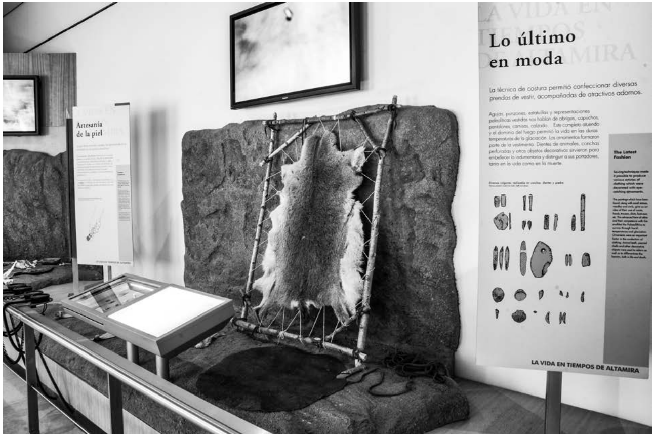
Museo Nacional y Centro de Investigación de Altamira, Ministerio de Cultura y Deporte de España. Exposición “Los Tiempos de Altamira”, Moda

Heras, Fatás y Lasheras, 2017: 830-831). La cavidad se convirtió en un atractivo mundial e incluso el gremio artístico acudió y encontró inspiración en ella.