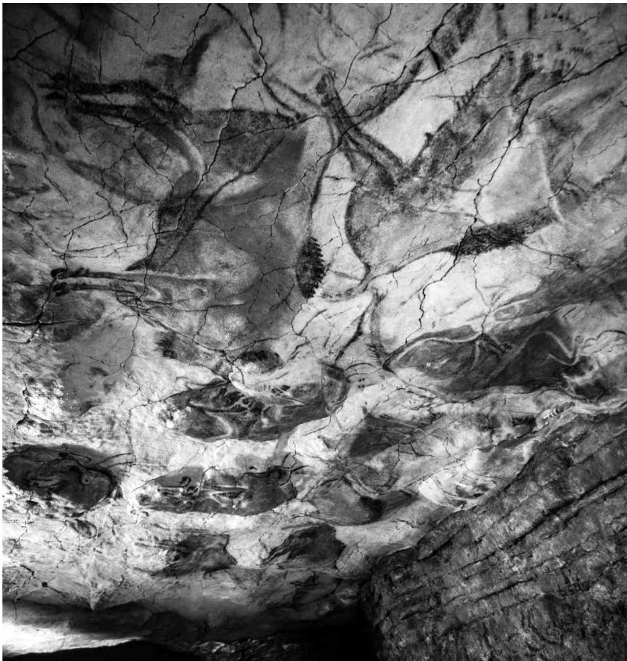
Museo Nacional y Centro de Investigación de Altamira, Ministerio de Cultura y Deporte de España. Neocueva. Techo policromos

La propuesta general es muy completa; ofrece una visita que puede realizarse en un tiempo razonable y que brinda un panorama completo de la cueva y los saberes asociados a ella. Ofrece múltiples oportunidades de observación detenida, de entendimiento, reflexión y disfrute. Tiene en exposición numerosas piezas arqueológicas originales. Utiliza todo tipo de recursos museográficos: reproducciones, dioramas, mapas, vitrinas y material audiovisual, entre otros.