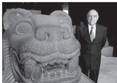
El arqueólogo.

Mayolo López, Reforma , 29 de mayo de 2009