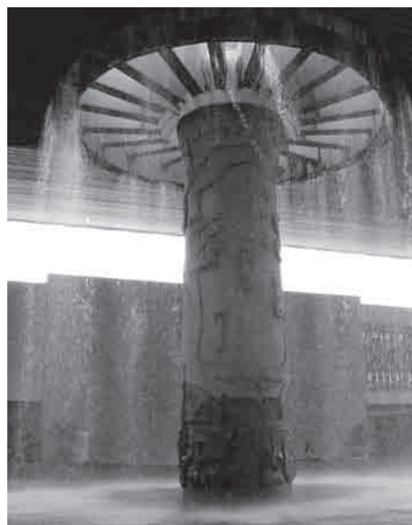
El Paraguas, de José y Tomás Chávez Morado, en la explanada interior del MNA.

Fastlicht anunció que el patronato realizará varios proyectos en el espacio museístico para revitalizar algunas áreas y brindar un mejor servicio a los visitantes.