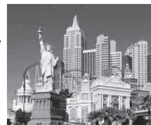
Uno de los grandes complejos hoteleros de Las Vegas: el NY Hotel.

“Las donaciones simplemente pararon, como si alguien hubiera cerrado un grifo”, dijo Lumpkin.