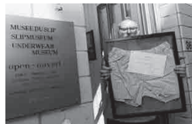
El coleccionista con uno de sus más preciados objetos.