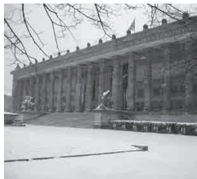
Fachada del Museo Egipcio de Berlín.