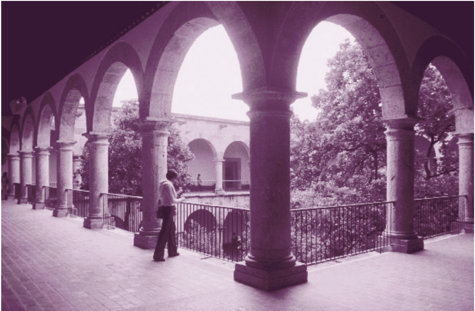
Museo Regional de Guadalajara. Fototeca CNME-INAH