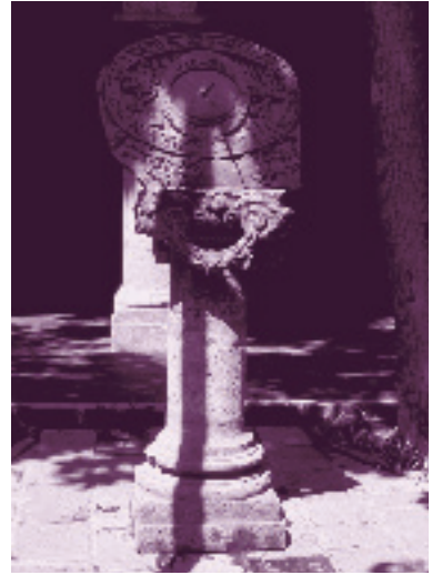
Reloj de sol, Museo Regional de Guadalajara