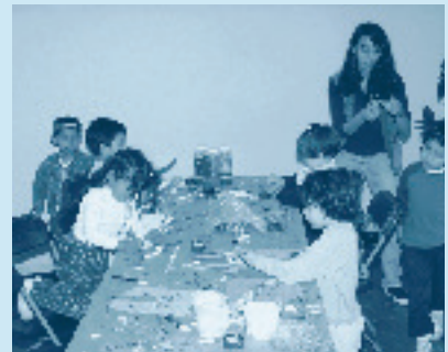
Taller de plástica infantil