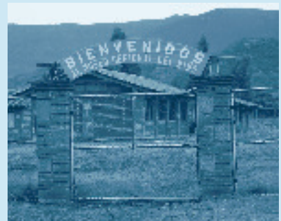
Museo Regional del Niño