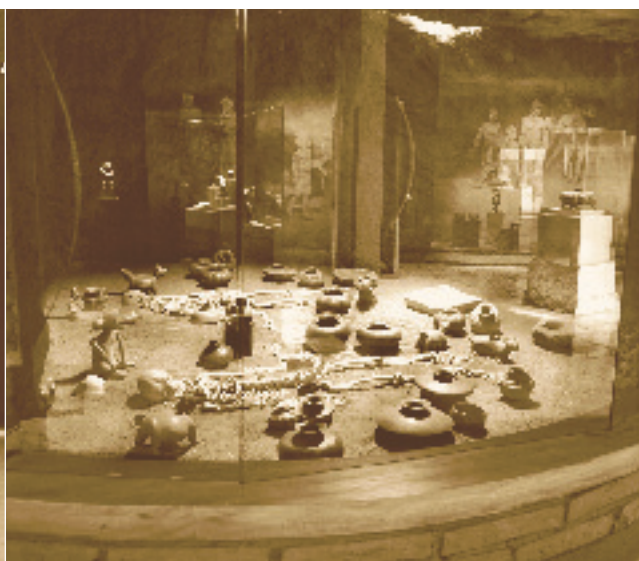
Tumba de tiro