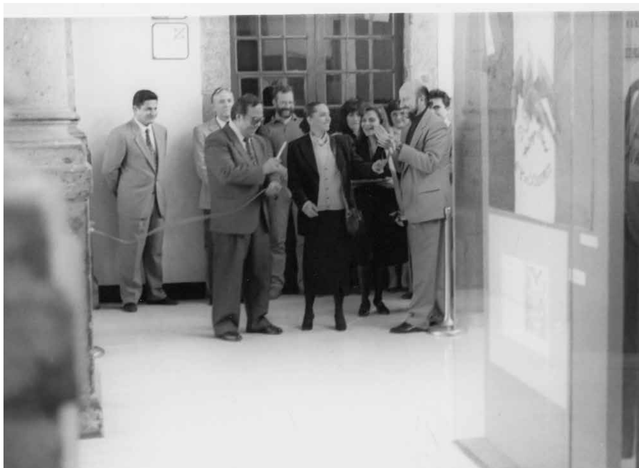
Inauguración de la exposición temporal Simbolos patrios , MNH, 2 de febrero de 1995.

Él aportó mucho para el desarrollo de la museografía desde el último cuarto del siglo XX y lo que llevamos del XXI. Es también un día triste para el Instituto Nacional de Antropología e Historia, porque el INAH pierde a un baluarte, a alguien que además de ser un gran museógrafo –un hombre talentoso, con un enorme conocimiento de la cultura universal y de las culturas mexicanas– fue un buen funcionario, constructor de equipos, difícilmente buscaba el crédito personal y siempre insistió en que el trabajo era un trabajo