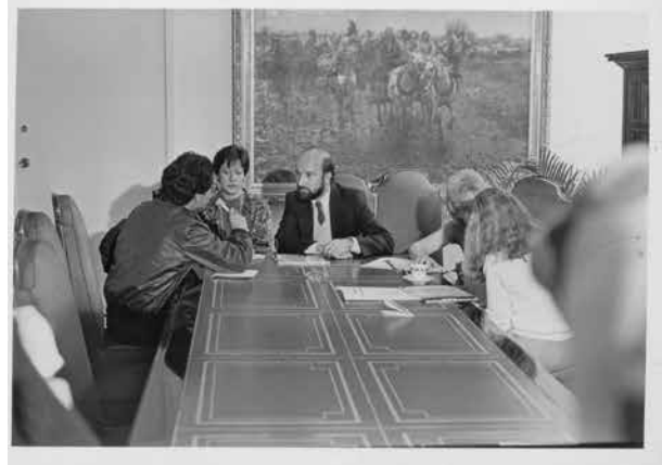
Rueda de prensa, MNH, enero de 1986.