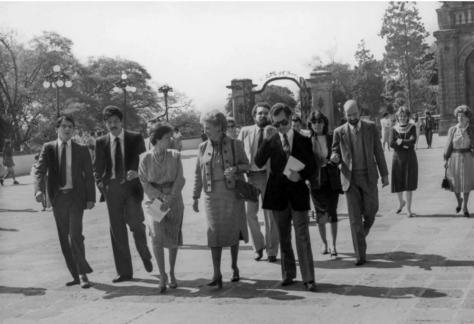
Inauguración de la exposición temporal Títeres , MNH, noviembre de 1983.