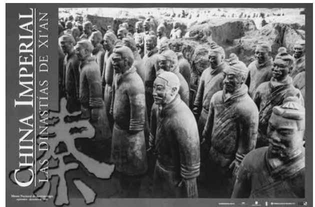
Cartel de la exposición temporal China Imperial: las dinastías de Xi'an , Museo Nacional de Antropología, septiembre-diciembre de 2000.