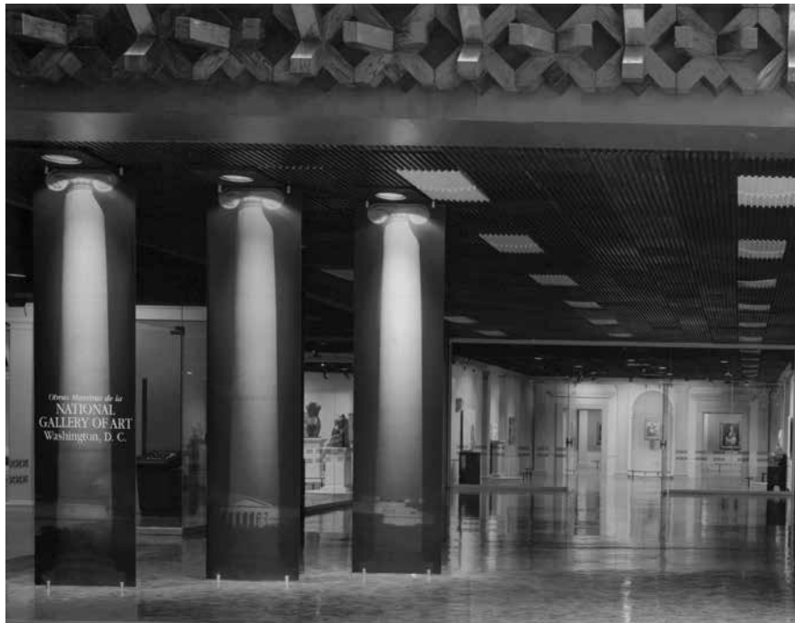
Exposición temporal Obras maestras de la National Gallery of Art Washington, D. C. , Museo Nacional de Antropología, 1996.