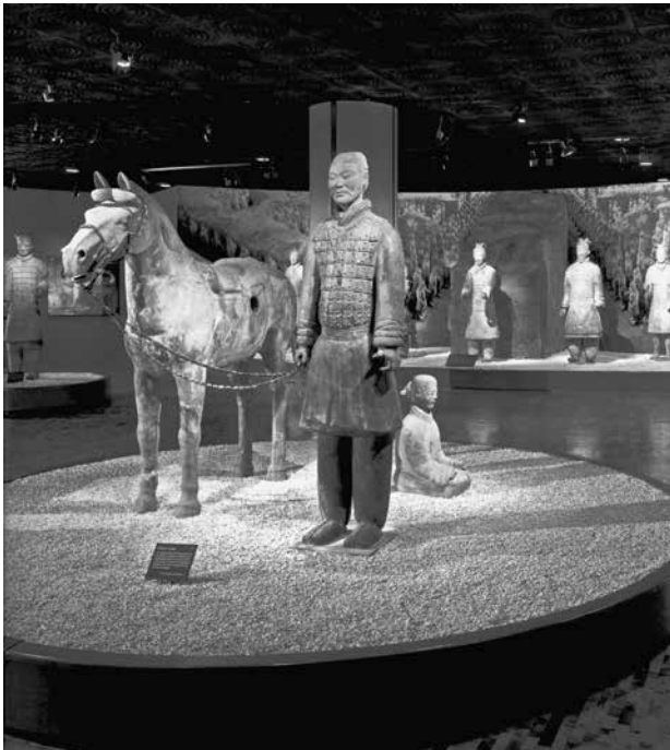
Exposición temporal China Imperial: las dinastías de Xi'an , Museo Nacional de Antropología, septiembre-diciembre de 2000.

en los museos, Miguel Ángel, con naturalidad, se vinculaba con las llamadas ciencias naturales y las exactas.