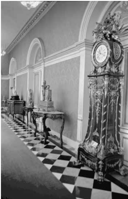
Exposición temporal Las ruedas del tiempo , MNH, octubre de 1976. Fotografía © Ernesto Durán. AHMNH/FF: Exposiciones. Registro fotográfico: Leonardo Hernández.