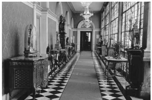
Exposición temporal Las ruedas del tiempo , MNH, octubre de 1976. Fotografía © Ernesto Durán. AHMNH/FF: Exposiciones. Registro fotográfico: Leonardo Hernández.