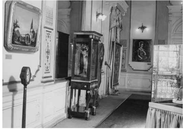
Exposición temporal Las ruedas del tiempo , MNH, octubre de 1976.