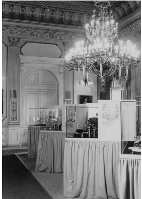
Exposición temporal Las ruedas del tiempo , MNH, octubre de 1976. Fotografía © Ernesto Durán. AHMNH/FF: Exposiciones. Registro fotográfico: Leonardo Hernández.

La convicción de quien suscribe la necesidad de la formación de profesionales para los museos, generadas de los