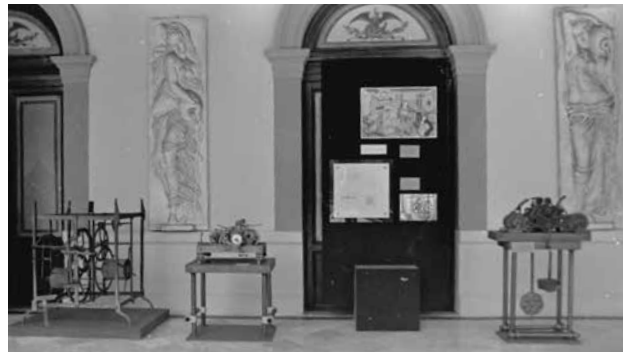
Exposición temporal Las ruedas del tiempo , MNH, octubre de 1976. Fotografía © Ernesto Durán. AHMNH/FF: Exposiciones. Registro fotográfico: Leonardo Hernández.

estudios de arte y de otras disciplinas, tuvo una respuesta inmediata del gran historiador y museógrafo Miguel Ángel Fernández. Su erudición en diversos campos fructificó en el apoyo a la planeación del programa de la Maestría en Museos.