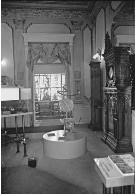
Proceso de montaje de la exposición temporal Las ruedas del tiempo , MNH, 1976.